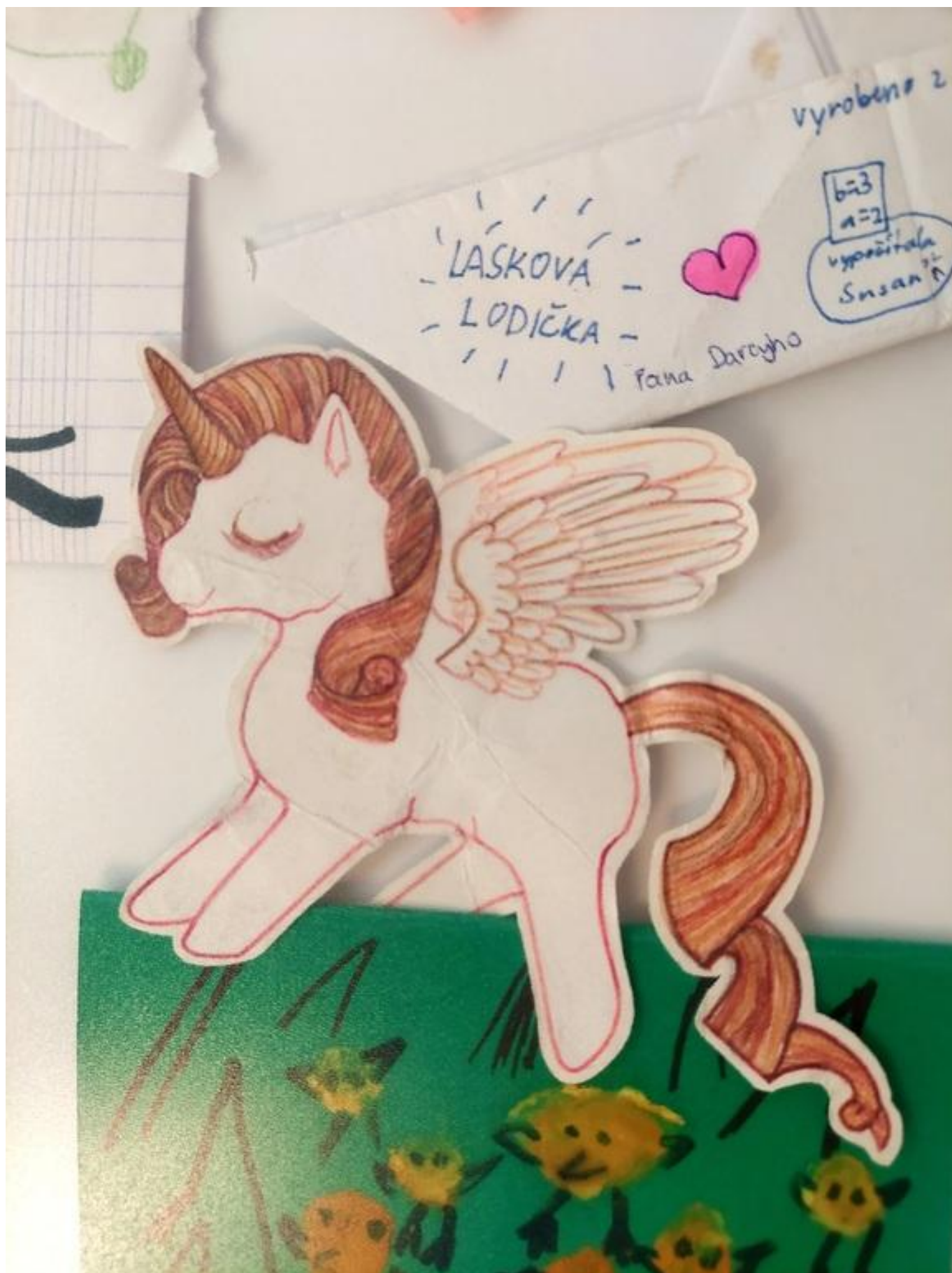
[11] Lásková lodička