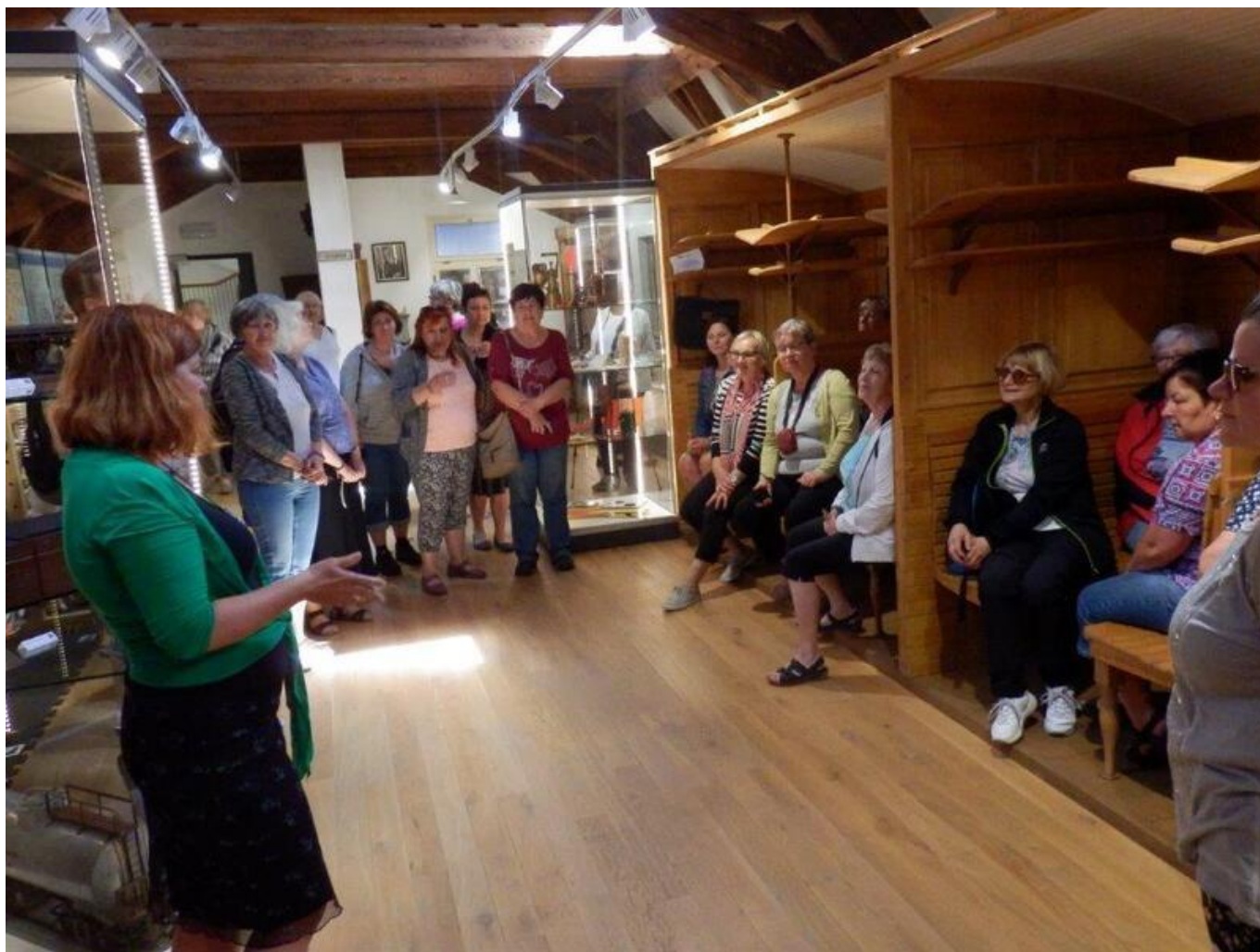
[25] Muzeum železnice

Ale to se již přiblížil čas rozloučení a odjezdu domů.