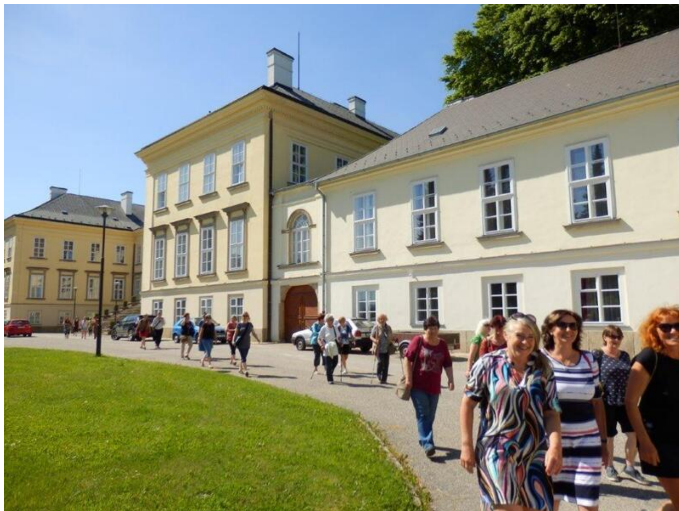
[14] Odchod na komentovanou prohlídku města