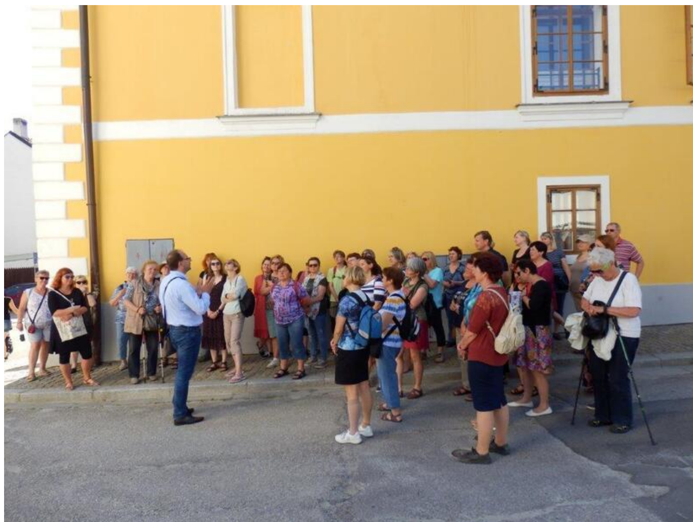
[15] Novohradské domy