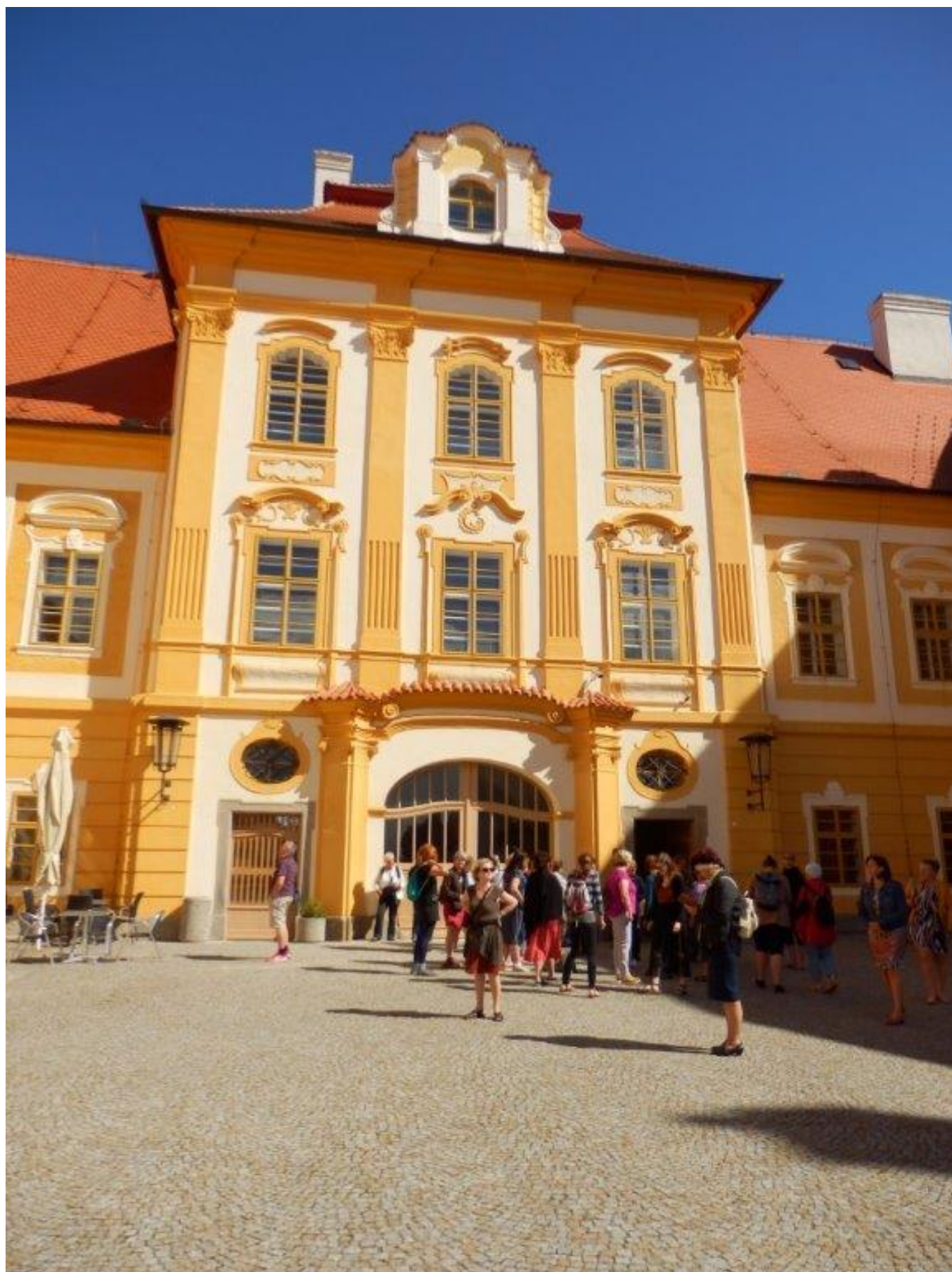
[24] Klášter Borovany, sídlo knihovny