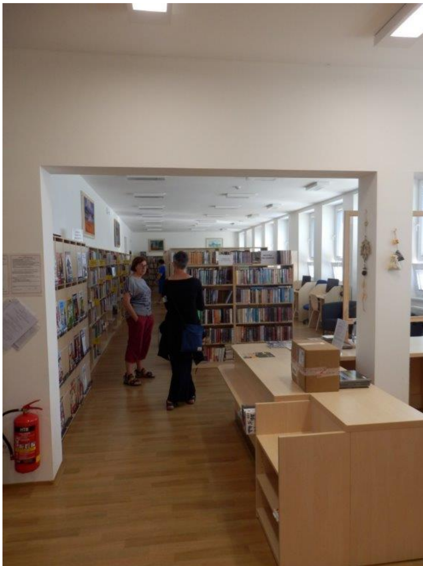
[20] Městská knihovna Nové Hradky