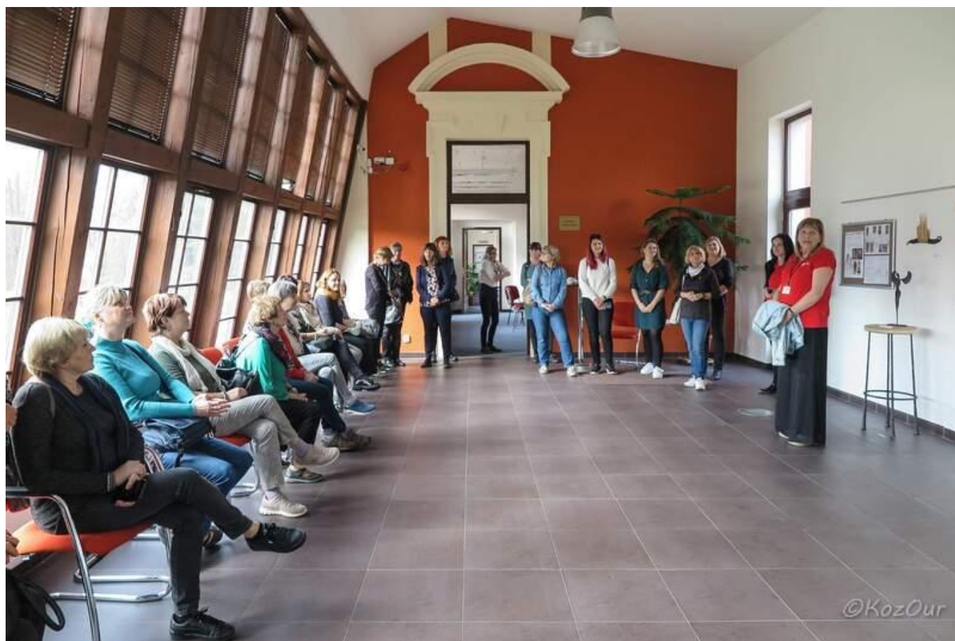
[17] Ostrovská knihovna je umístěna na zámku