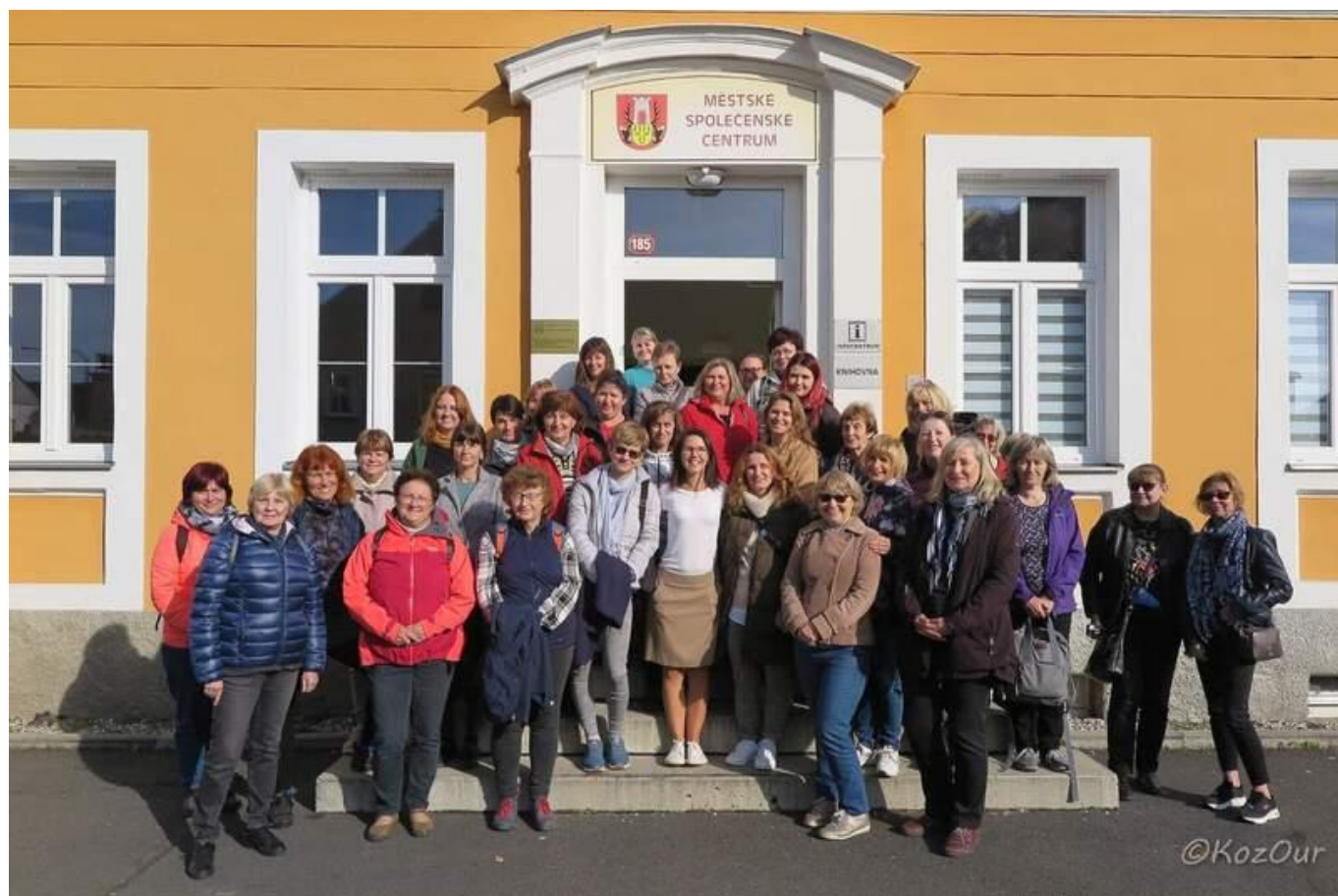
[16] Společná fotografie účastníků v Hroznětíně