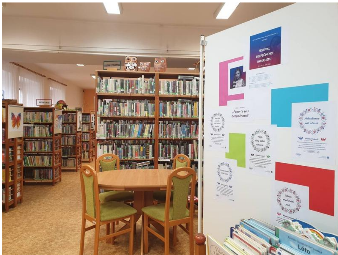
[19] Knihovna Bakov

Knihovny dostaly k dispozici i grafiky určené k využití na sociálních sítích Facebook a Instagram, což aktivně využívaly. Zájemci mohou příspěvky k vzdělávací kampani dohledat pod hashtagem #prislovinapovi na Facebooku [20] i Instagramu [21].