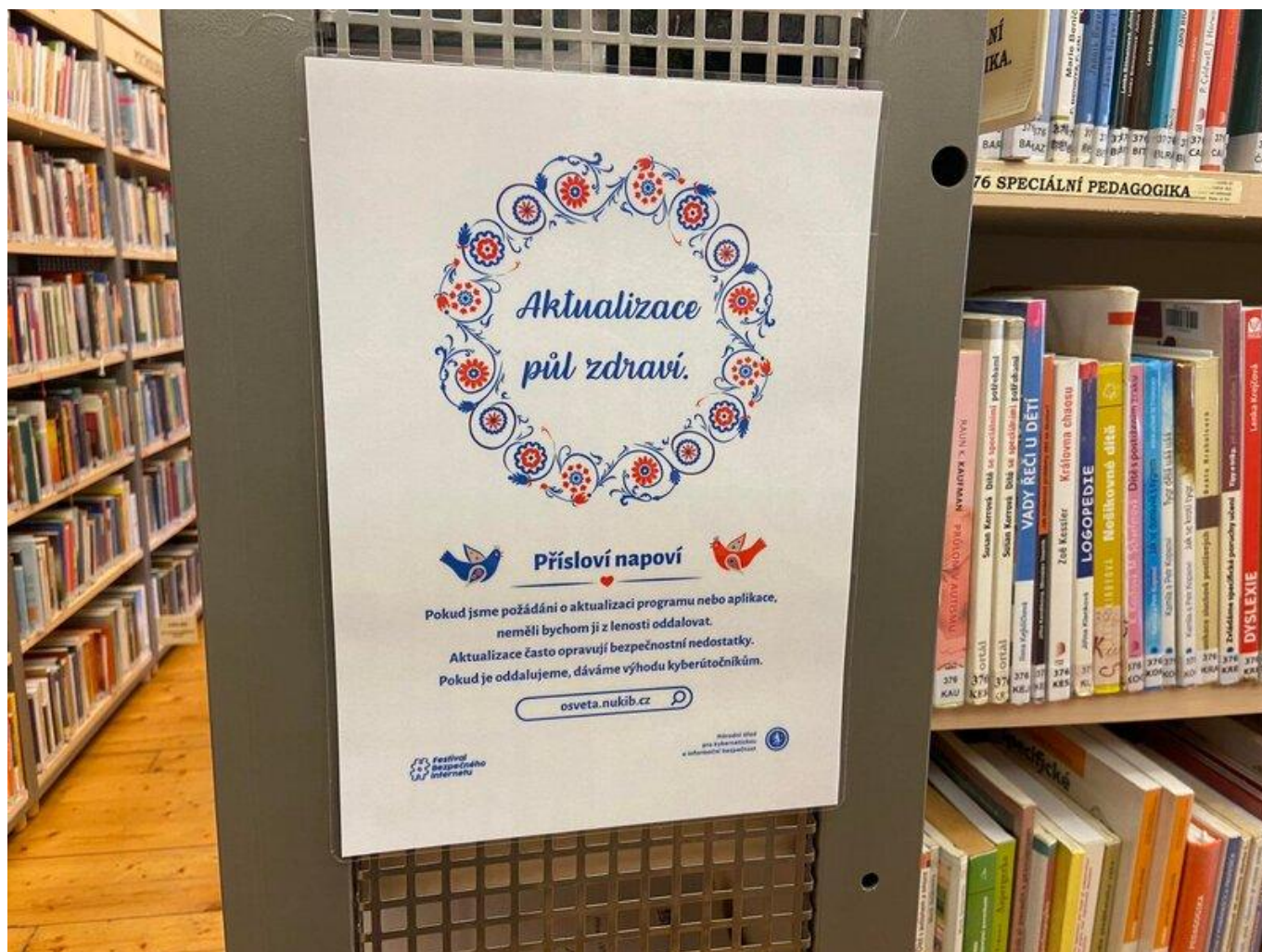
[18] Městská knihovna Jihlava