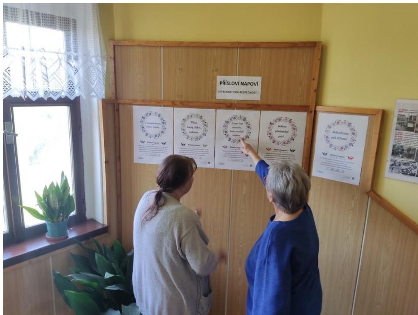
[11] Městská knihovna Duchcov