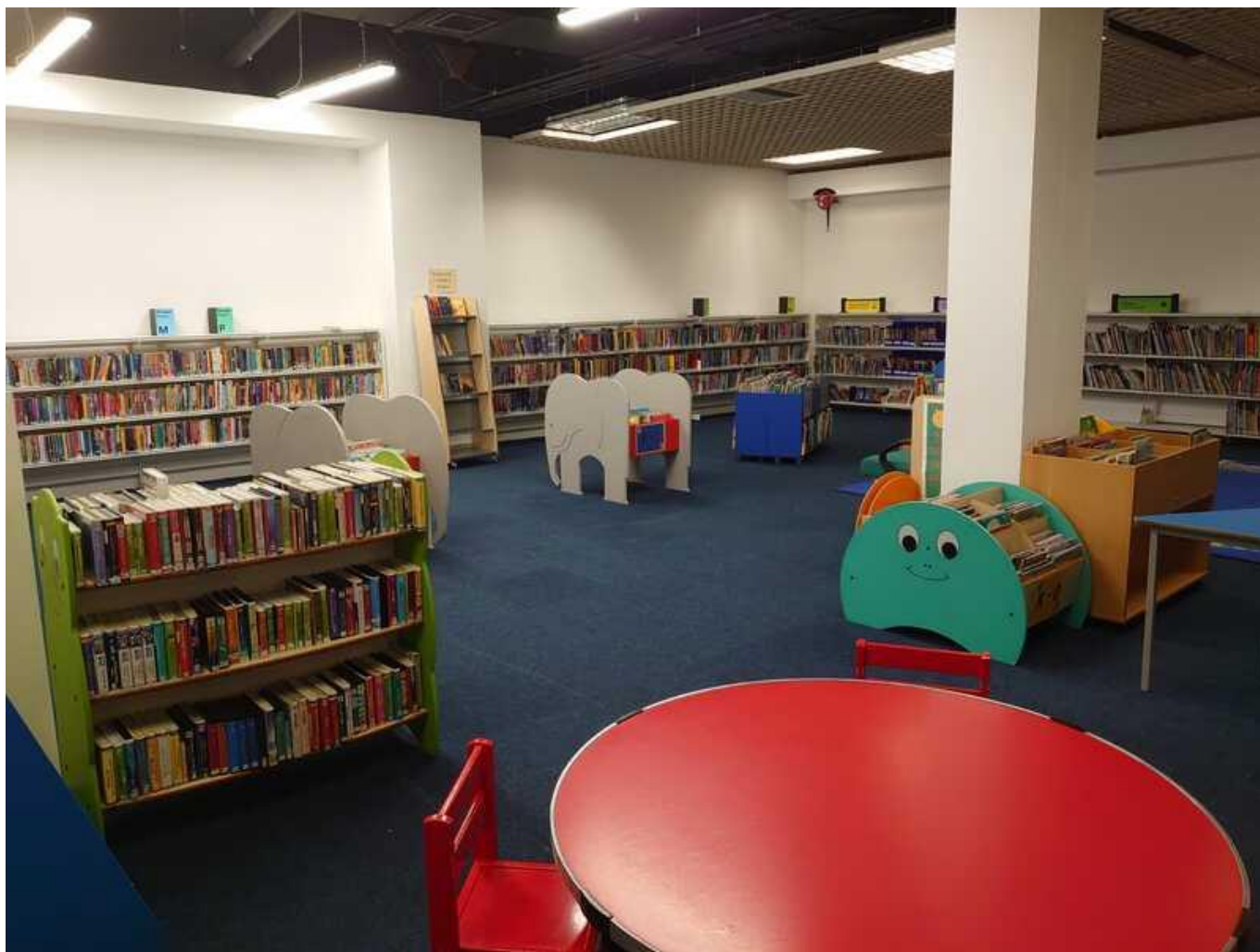
[35] Dublinská Ústřední knihovna – Oddělení pro děti