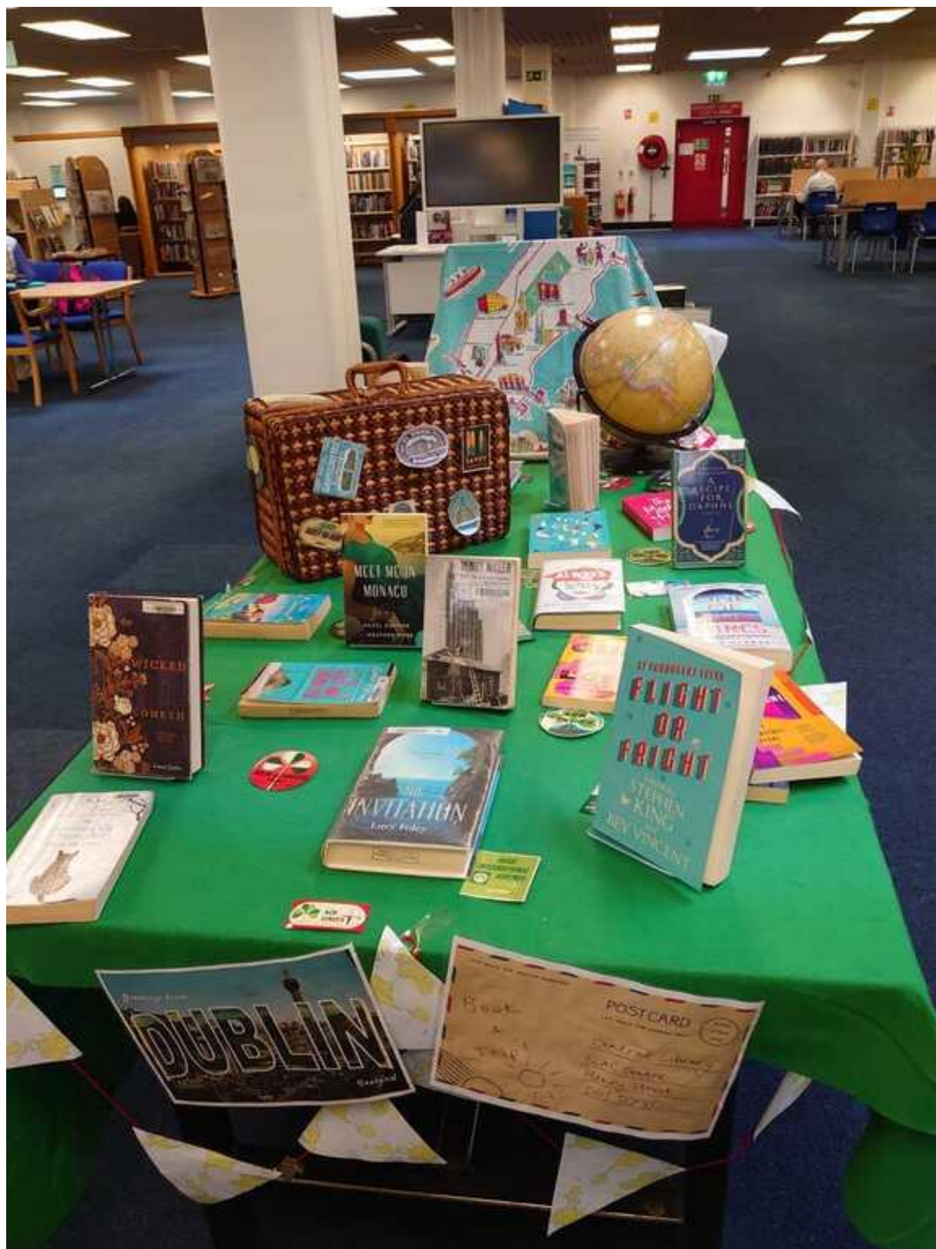
[36] Dublinská Ústřední knihovna - Oddělení pro dospělé