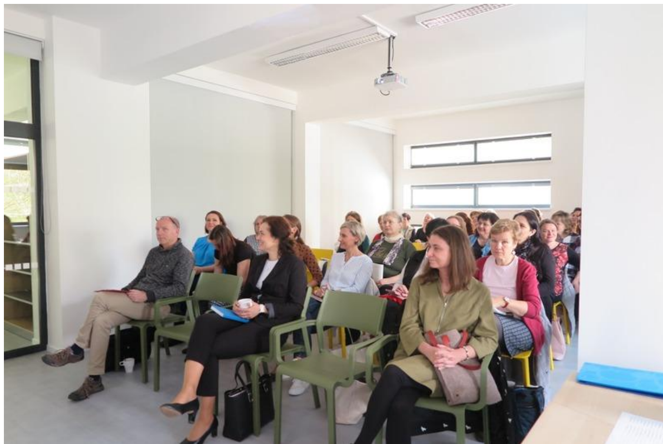
[9] Účastníci semináře v pobočce Podroužkova (součást Knihovny města Ostravy)