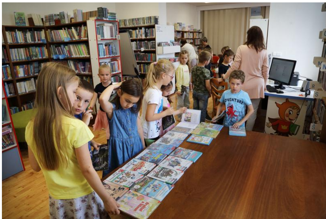
[21] Děti si vybírají knihu na půjčení