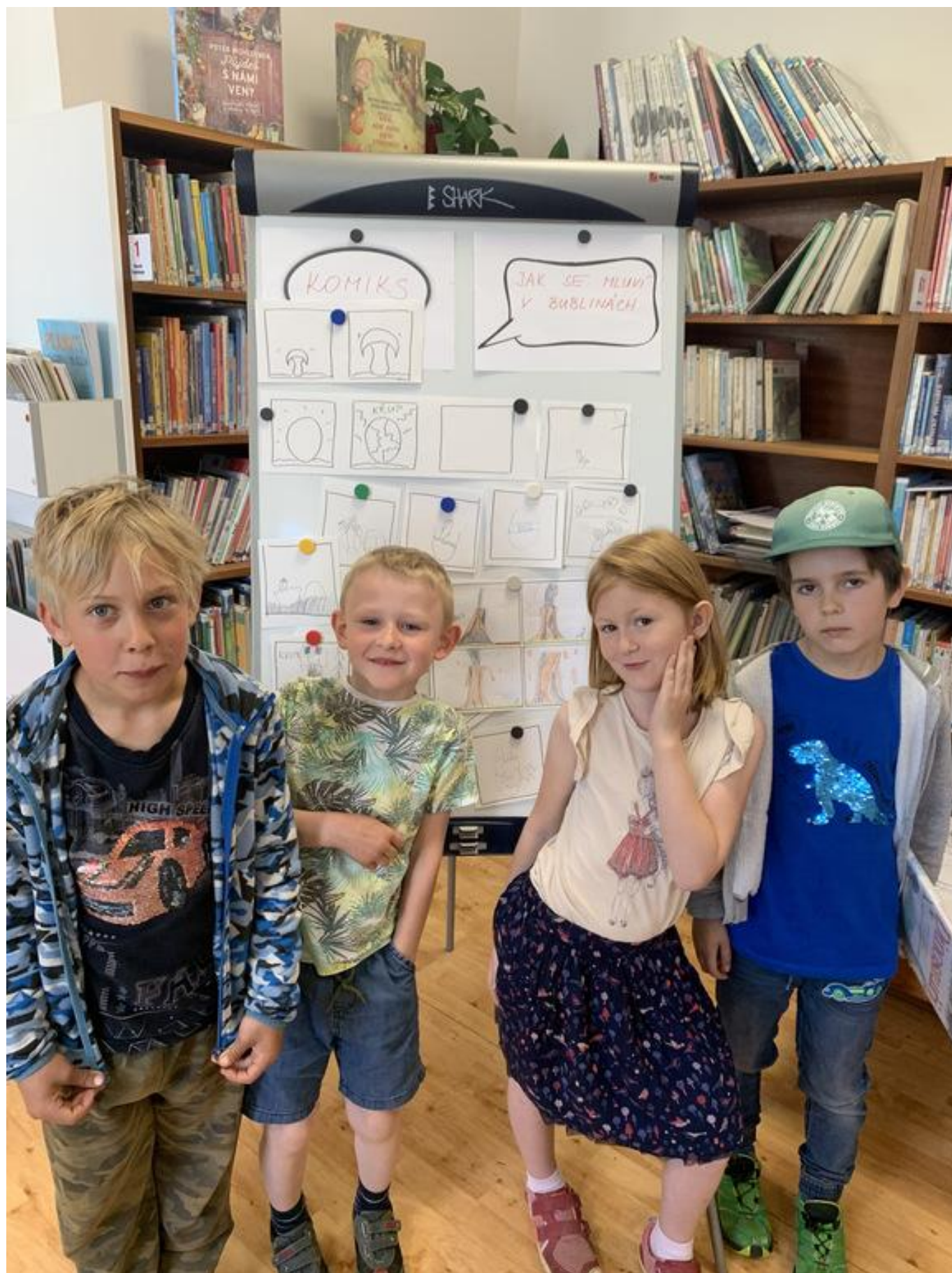
[15] Komiks aneb Jak se mluví v bublinách