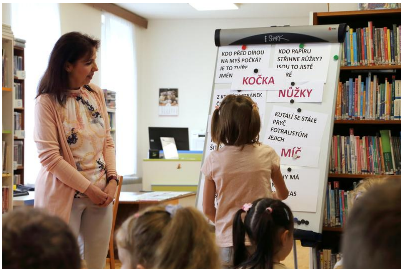
[16] Děti dokončují říkanky s rýmy