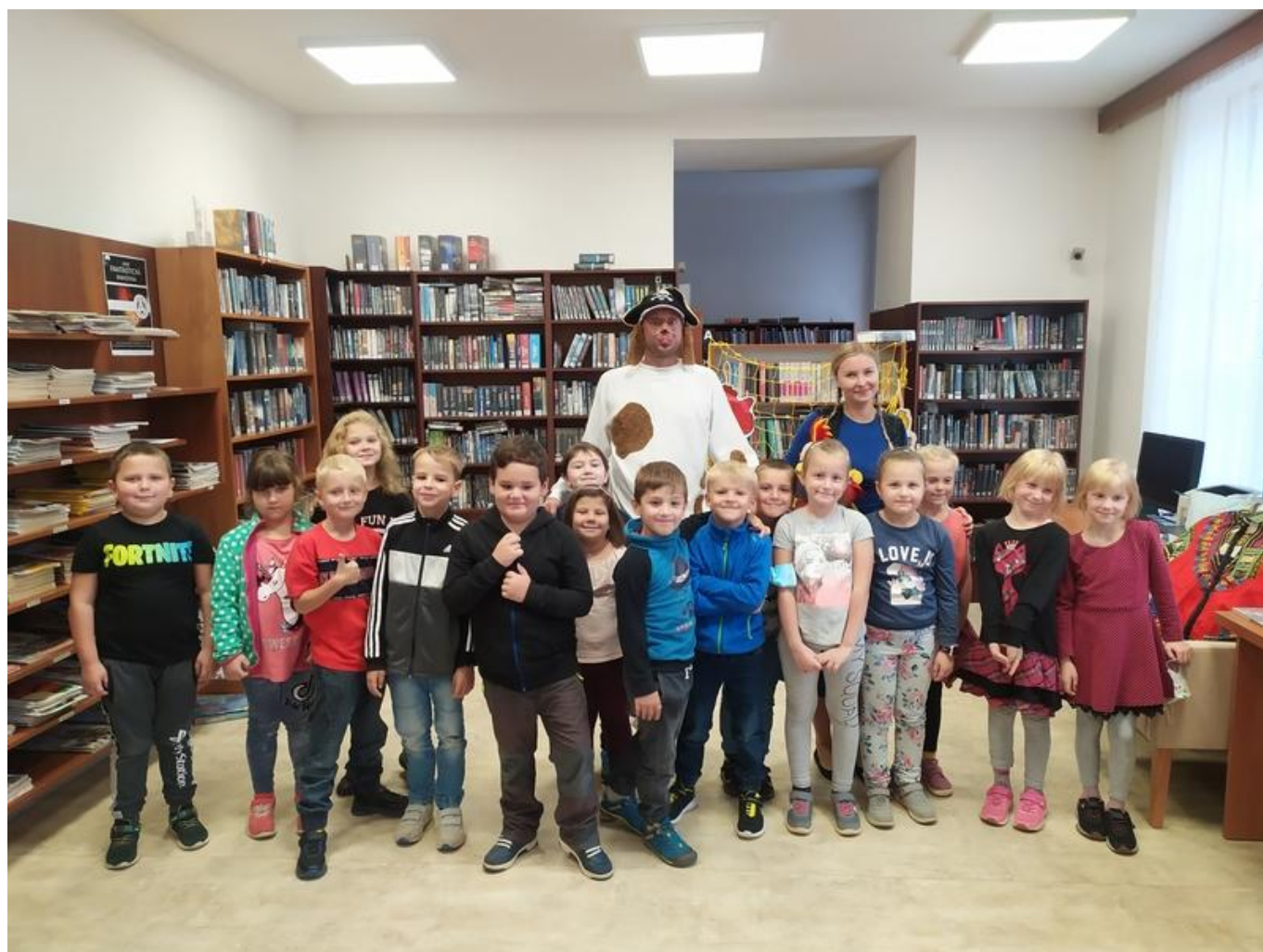
[13] Tajemství ukryté v knize - divadelní představení