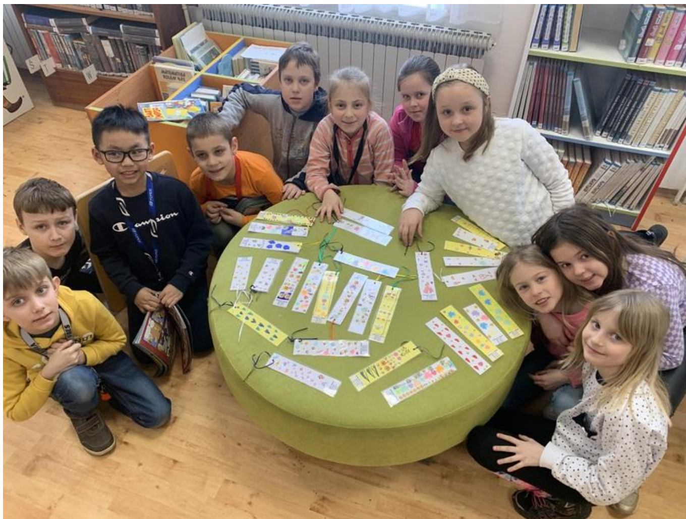
[14] Vyrábění záložek se školní družinou