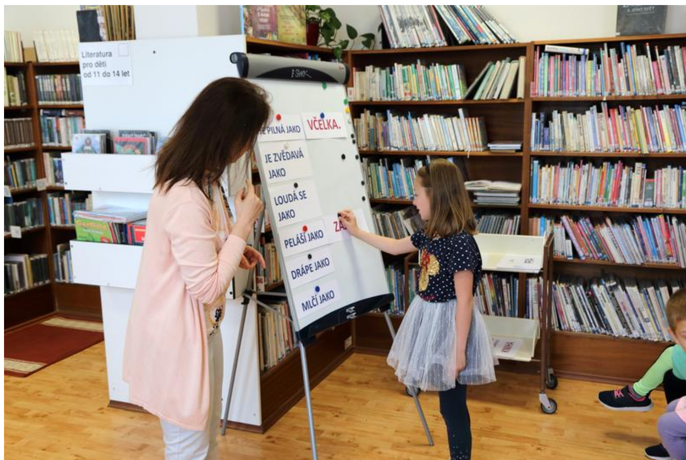
[17] Plnění úkolu spočívajícího v dokončování přirovnání