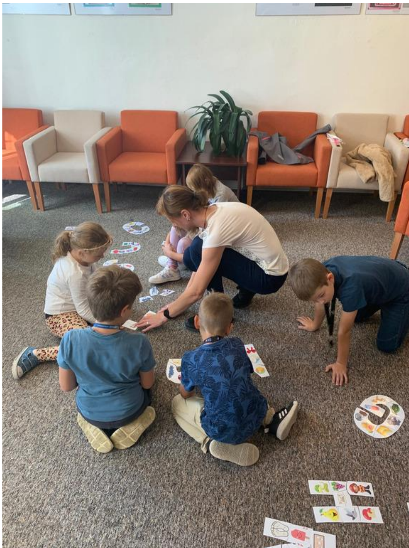
[11] Návštěva prvňáčků v čítárně - úkoly s abecedou