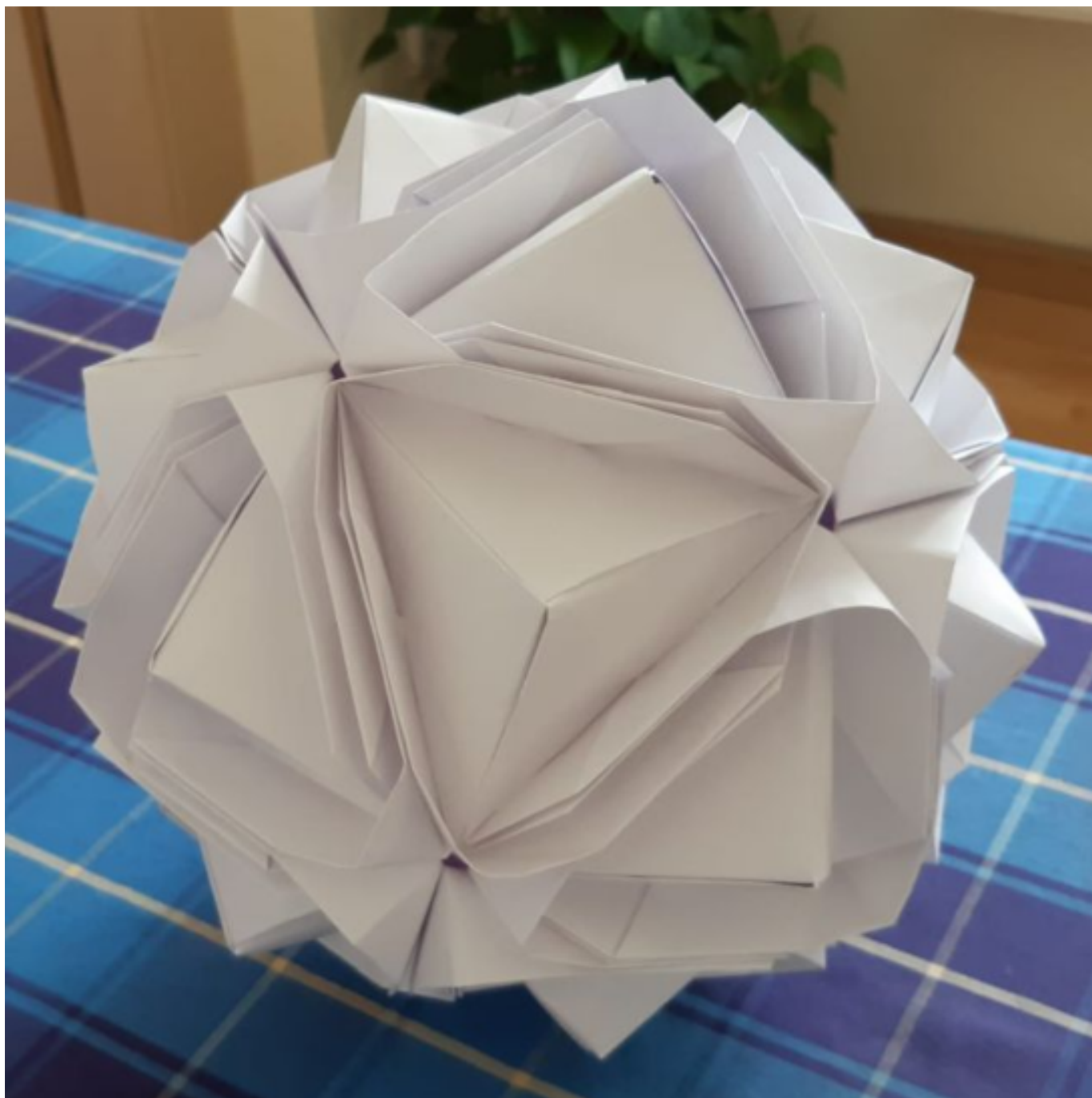
[20] Model Japanese Brocade (autorka Minako Ishibashi, 30 modulů z papírového čtverce o rozměrech 20 × 20 cm)