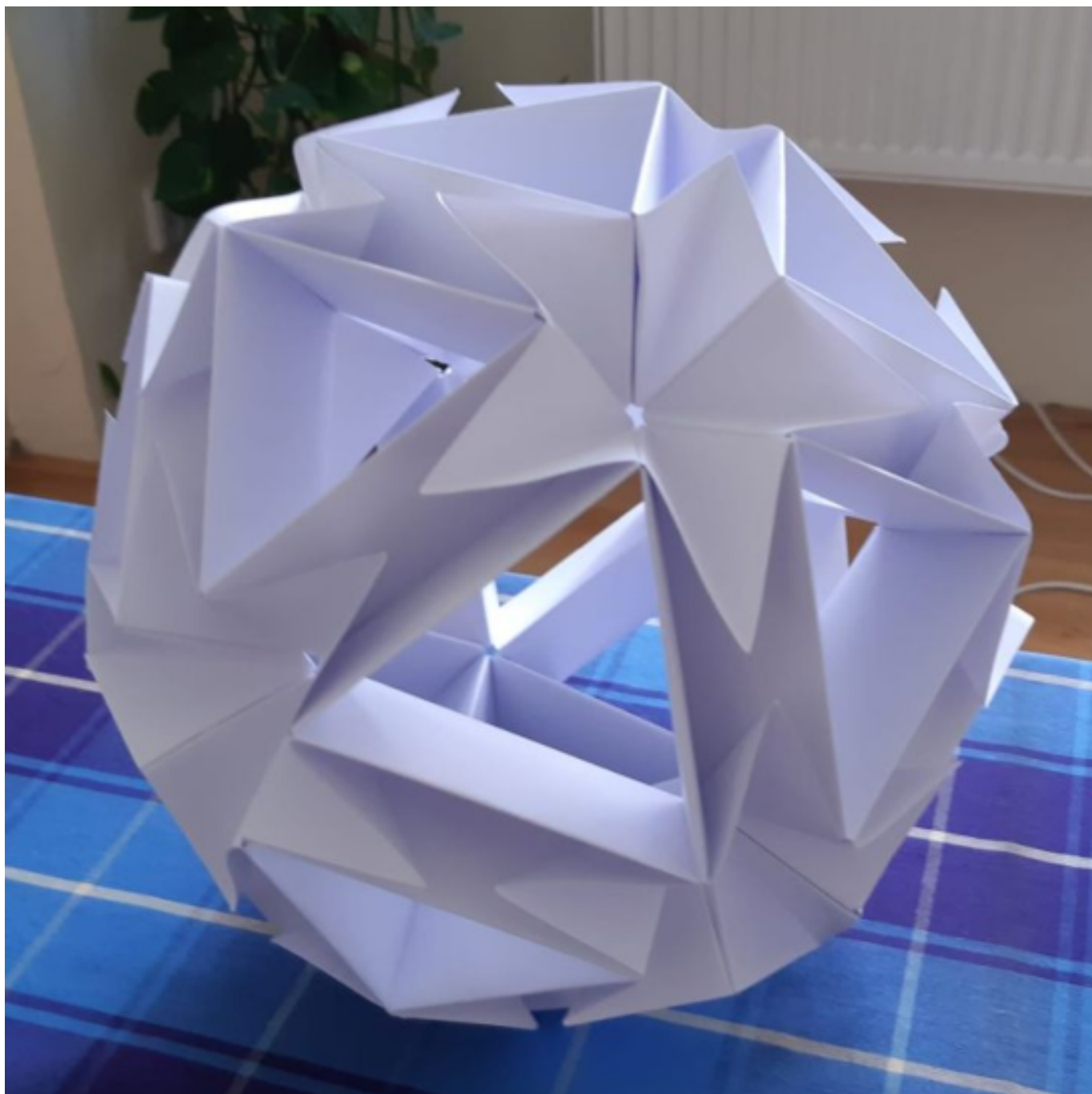
[19] Model Laconical roll obi (autorka Tomoko Fuse, 60 modulů z papírového obdélníku o rozměrech 8,5 × 17 cm)