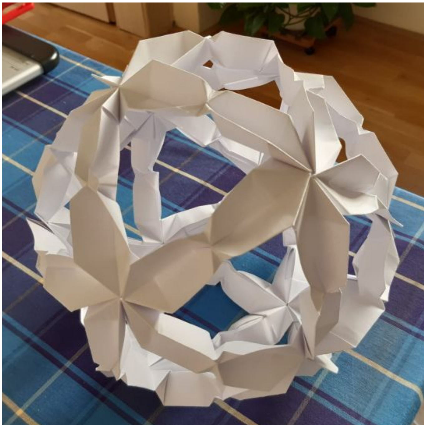
[16] Model Cherry Blossom Ball (autor Toshikazu Kawasaki, 30 modulů z papírového obdélníku o rozměrech 9 × 18 cm)