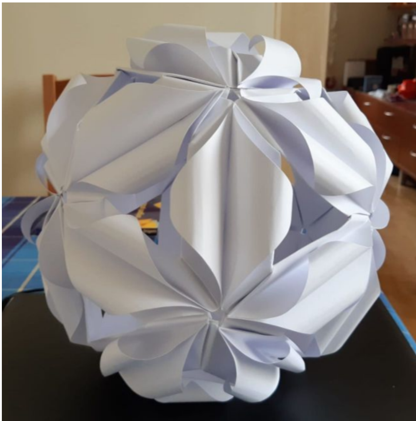
[17] Model Firefly Sonobe (autorka Ekaterina Lukasheva, 30 modulů z papírového čtverce o rozměrech 15 × 15 cm)