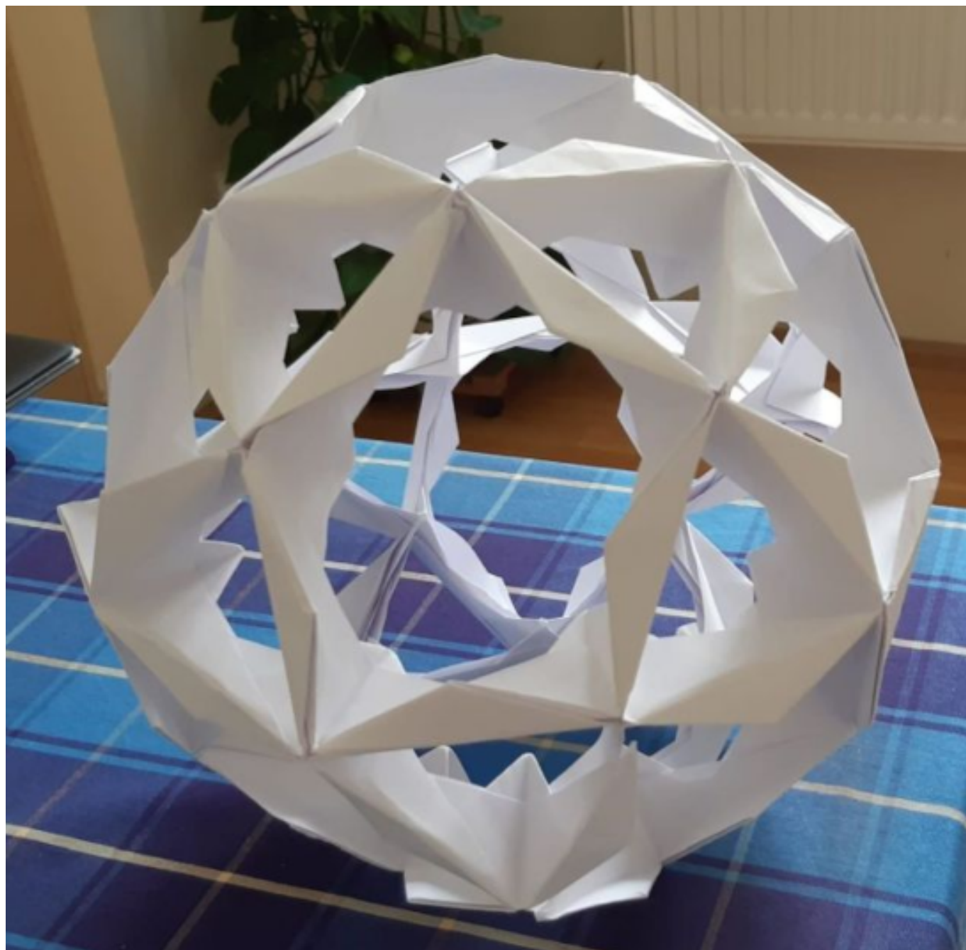
[15] Model Pinwheel Frame (autorka Tomoko Fuse, 30 modulů z papírového čtverce o rozměrech 21 × 21 cm)