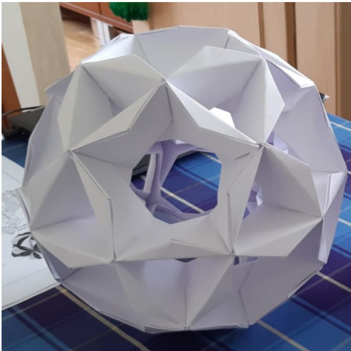
[18] Model Pinwheel Ball A (autorka Tomoko Fuse, 30 modulů z papírového čtverce o rozměrech 15 × 15 cm)