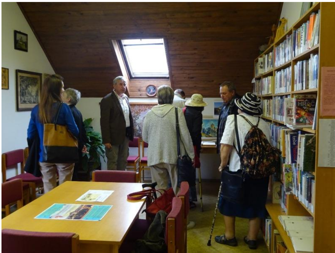
[13] Prohlídka výstavy v libošovické knihovně