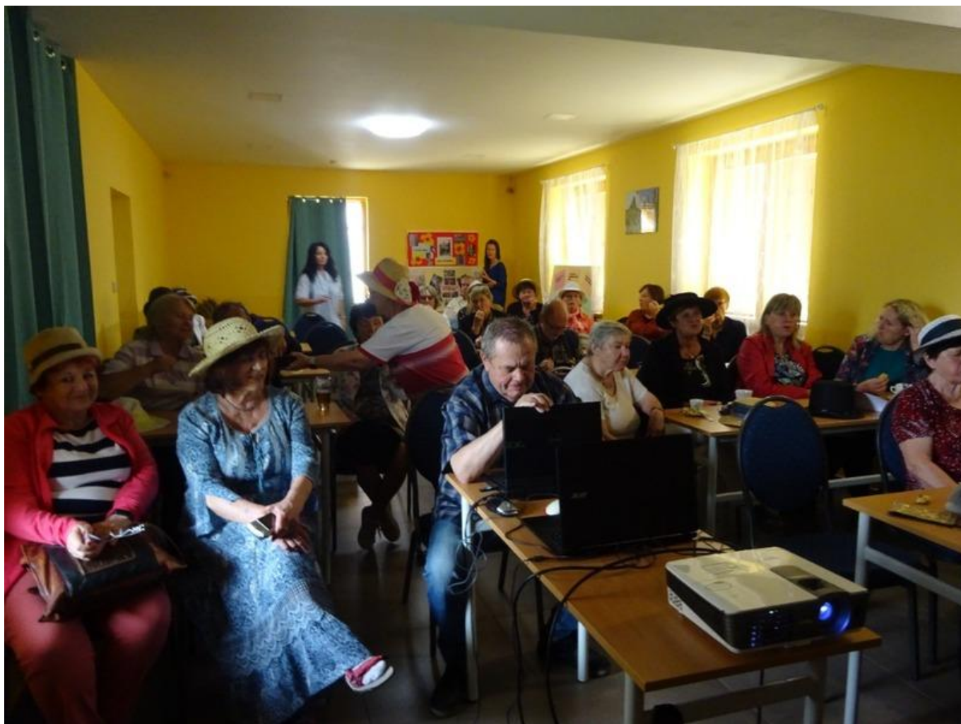
[15] Pohled do plného sálu

Následujícímu večernímu programu je věnována samostatná část článku.