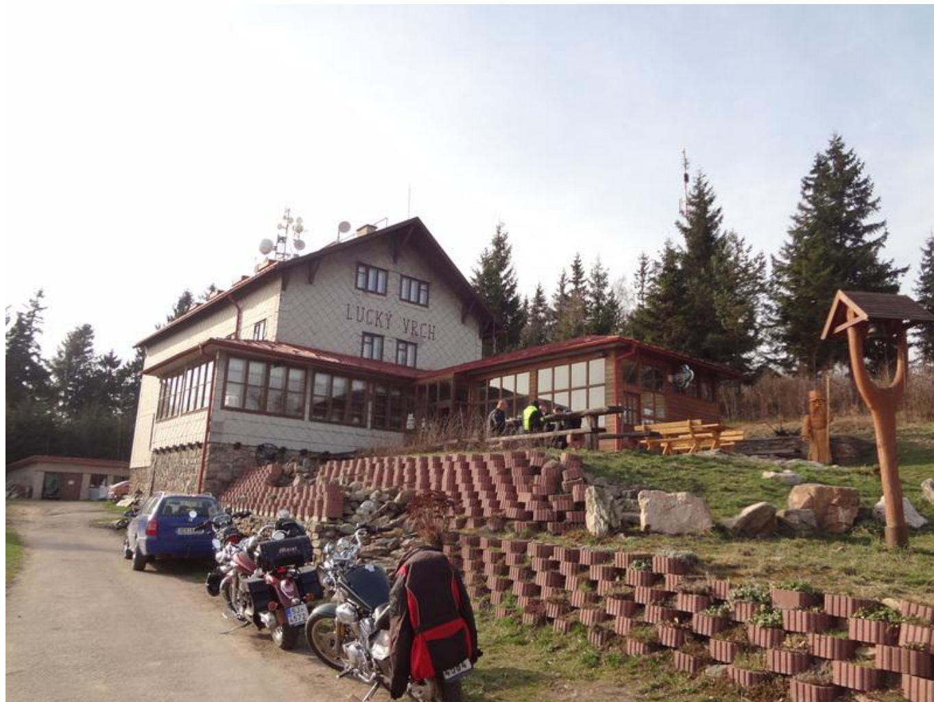
[17] Lucký vrch

Vraťme se ještě časově zpět – do doby Andělina dětství. To je do mladšího školního věku spojené s Luckým vrchem [16], turistickou chatou Klubu českých turistů, ležící na nehostinném místě Českomoravské vrchoviny několik kilometrů od Poličky. Zde její rodiče působili jako správce a kuchařka až do roku 1953, kdy chatu převzala armáda.