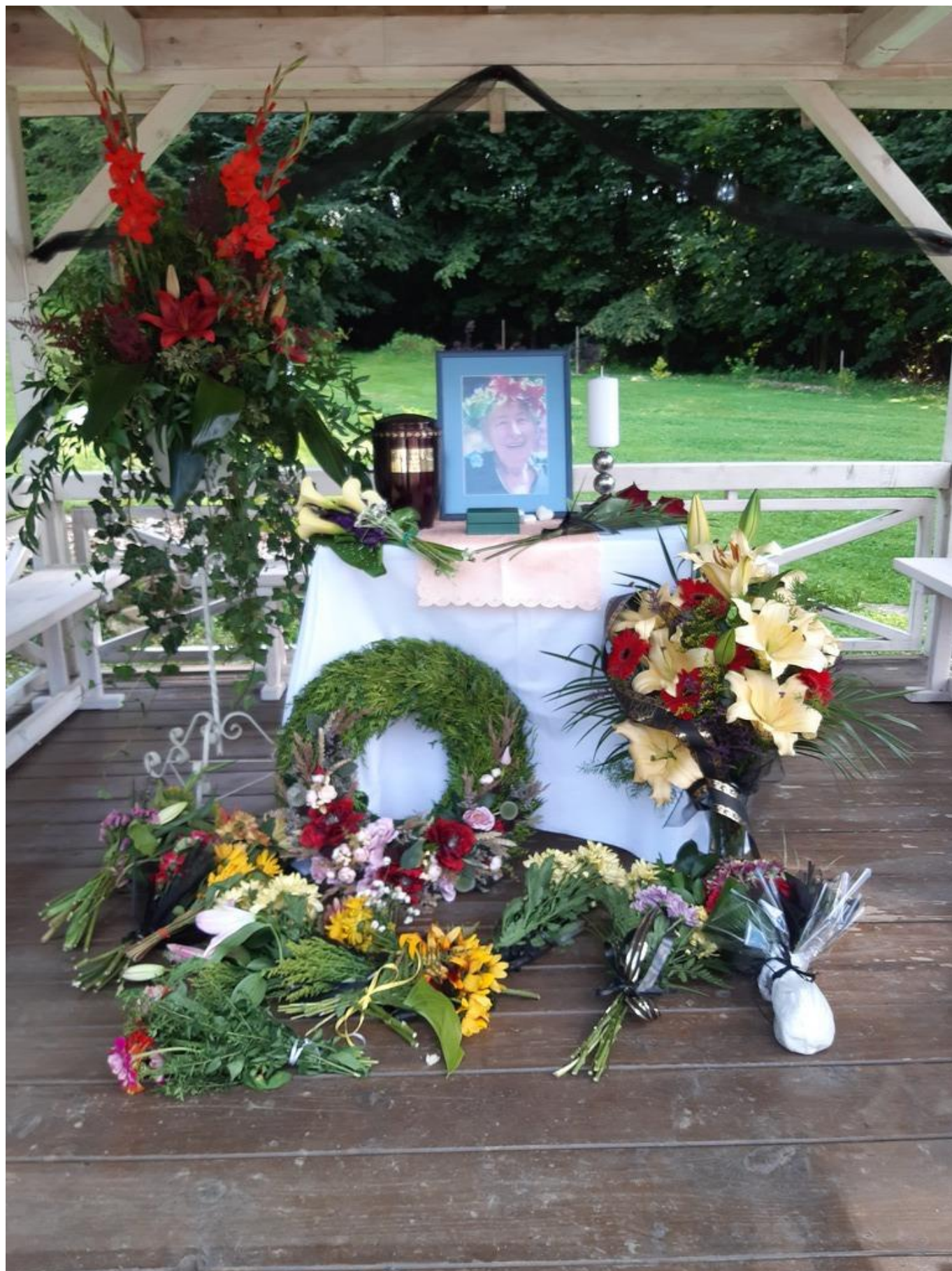
[21] Altánek se smuteční výzdobou