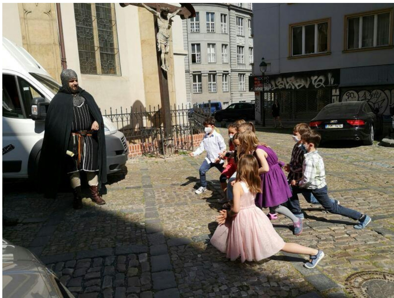
[16] Při skládání slibu

Jsem za tuto úplně novou zkušenost moc vděčná. Nemyslete si, že se při online výuce s dětmi ztratí živý kontakt. První živé setkání po otevření škol a knihovny to potvrdilo. Děti i rodiče vzpomínali na jednotlivá online setkání a stejně nevymizela a nezničila se ani ta vzácná tichá chvíle, která vzniká při společném čtení. Objevila se i v online setkání a opakovala se, viz kupříkladu snímek zachycující napětí, smutek a soucit dětí během příběhu o nesnázích malého chameleona.