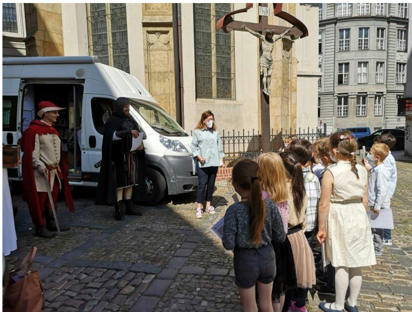
[15] Děti se připravují na pasování