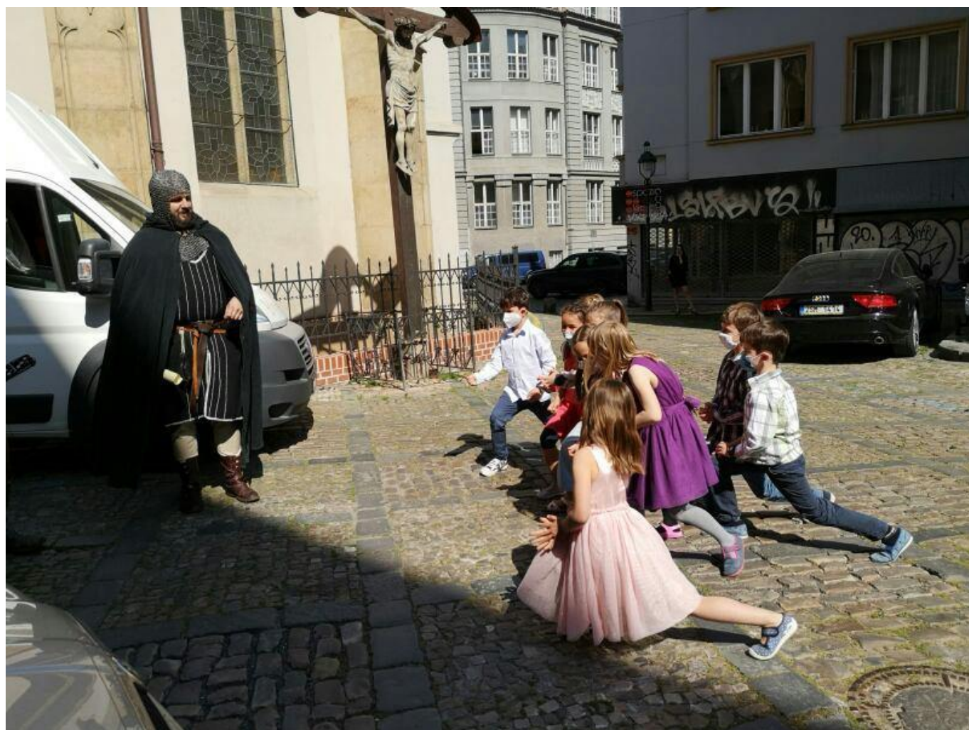
[16] Při skládání slibu

Jsem za tuto úplně novou zkušenost moc vděčná. Nemyslete si, že se při online výuce s dětmi ztratí živý kontakt. První živé setkání po otevření škol a knihovny to potvrdilo. Děti i rodiče vzpomínali na jednotlivá online setkání a stejně nevymizela a nezničila se ani ta vzácná tichá chvíle, která vzniká při společném čtení. Objevila se i v online setkání a opakovala se, viz kupříkladu snímek zachycující napětí, smutek a soucit dětí během příběhu o nsnázích malého chameleona.