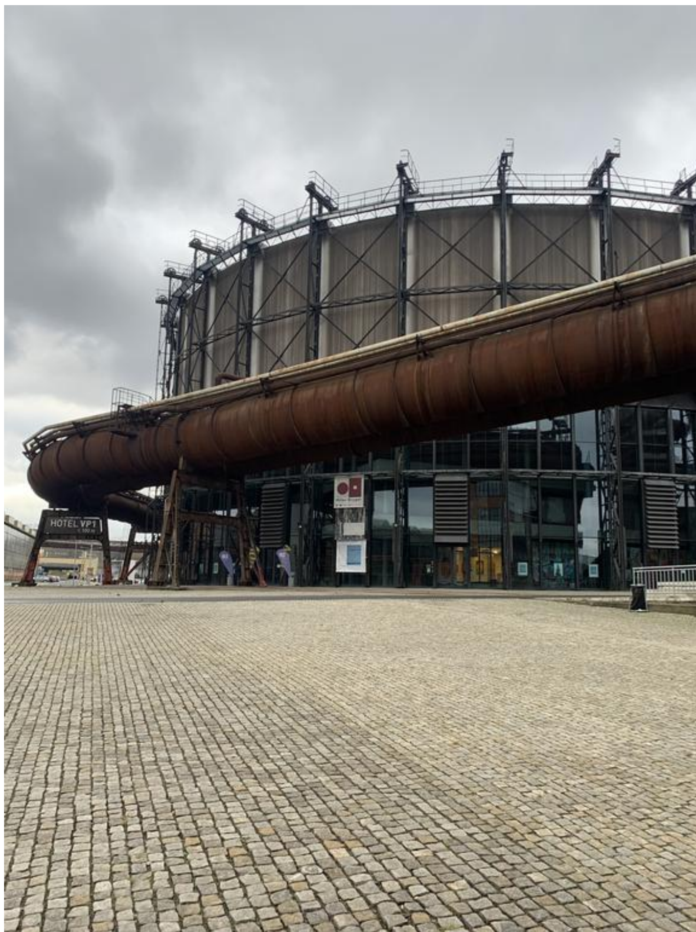
[12] Aula Gong je moderní multifunkční centrum vzniklé vestavbou do původního plynojemu z roku 1924 (projekt zpracoval architekt Josef Pleskot)