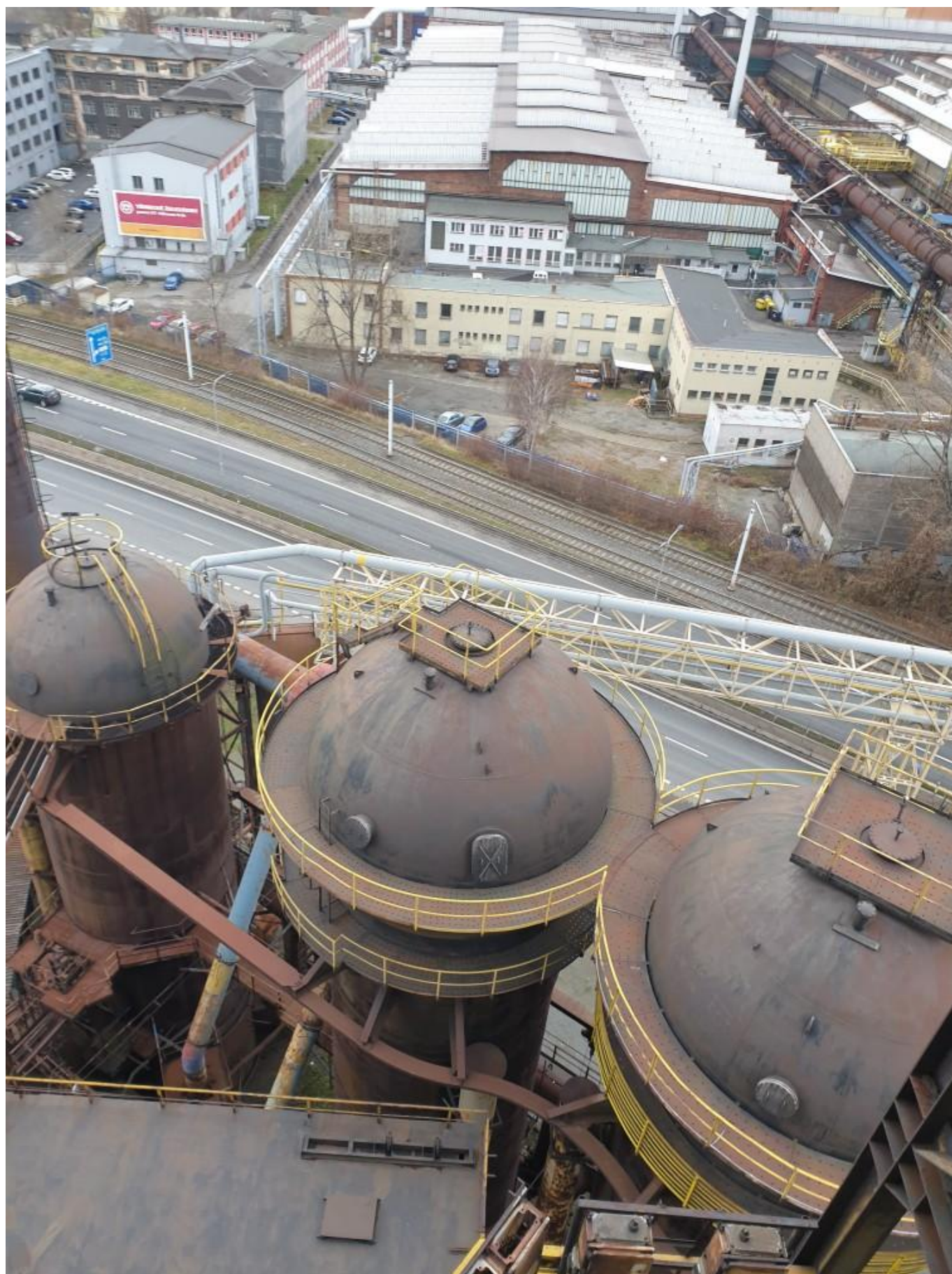
[24] Bolt Tower