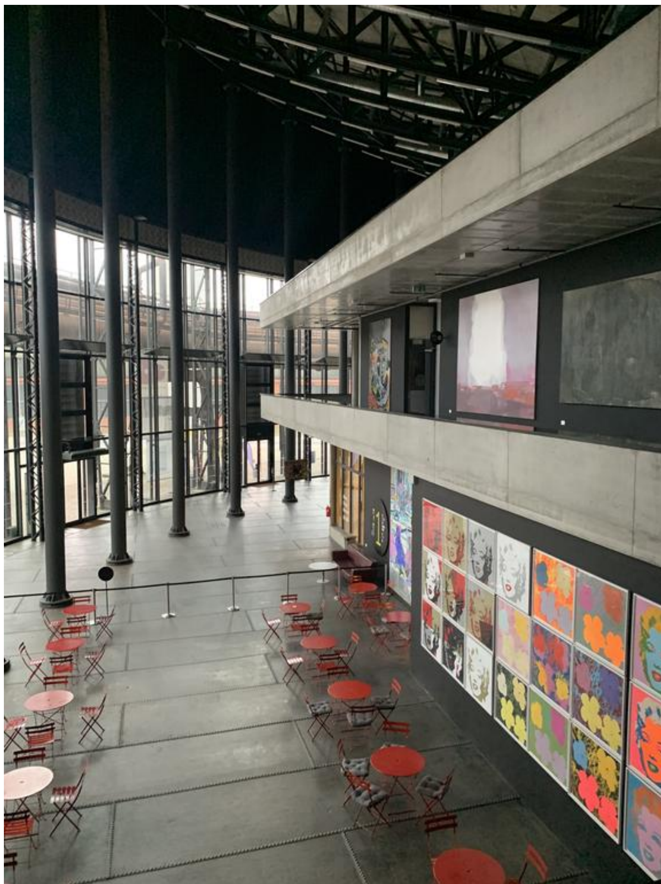
[15] Pohled z ochozu do vstupního foyer Gongu