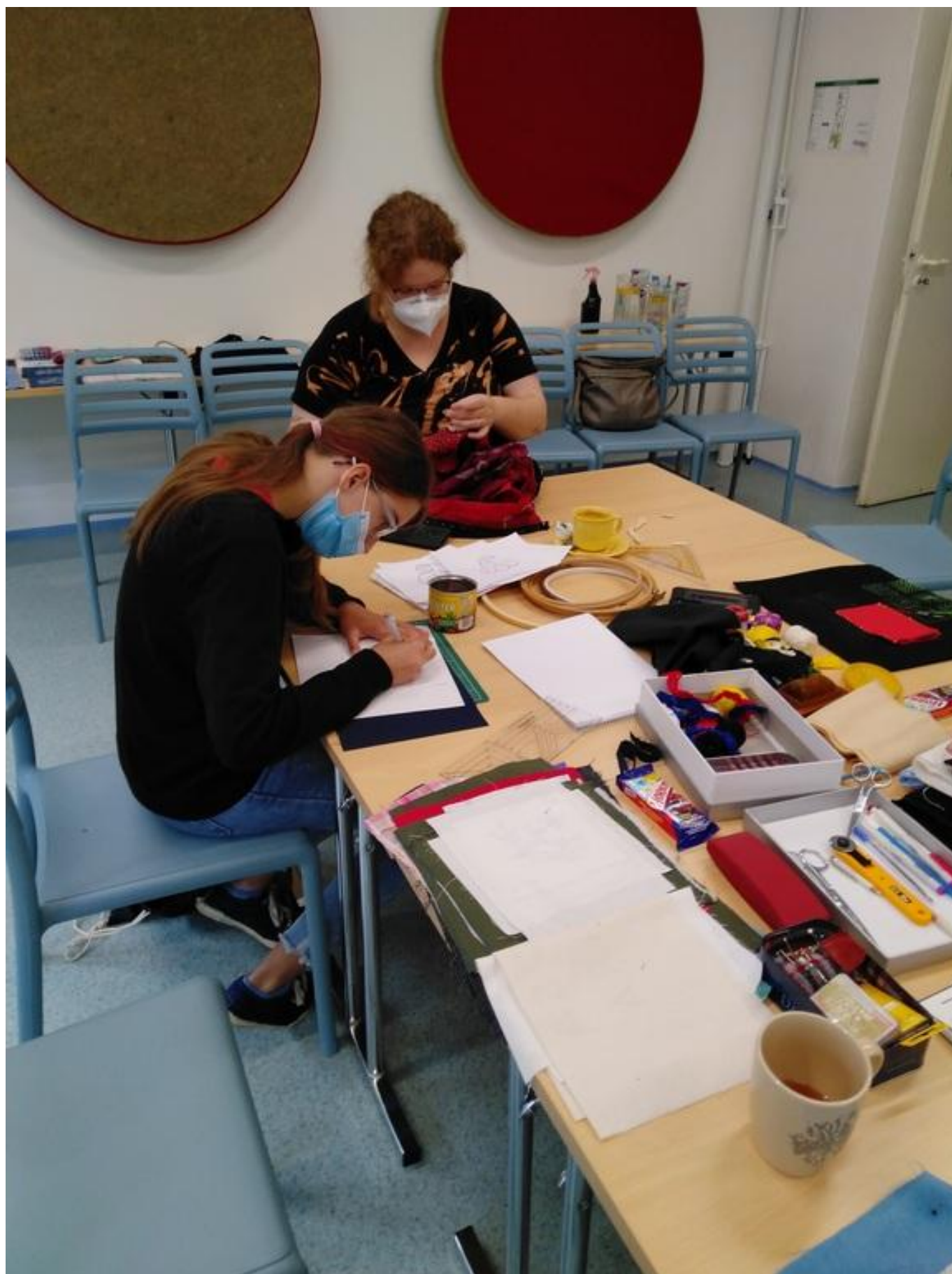
[13] Při vyšívání