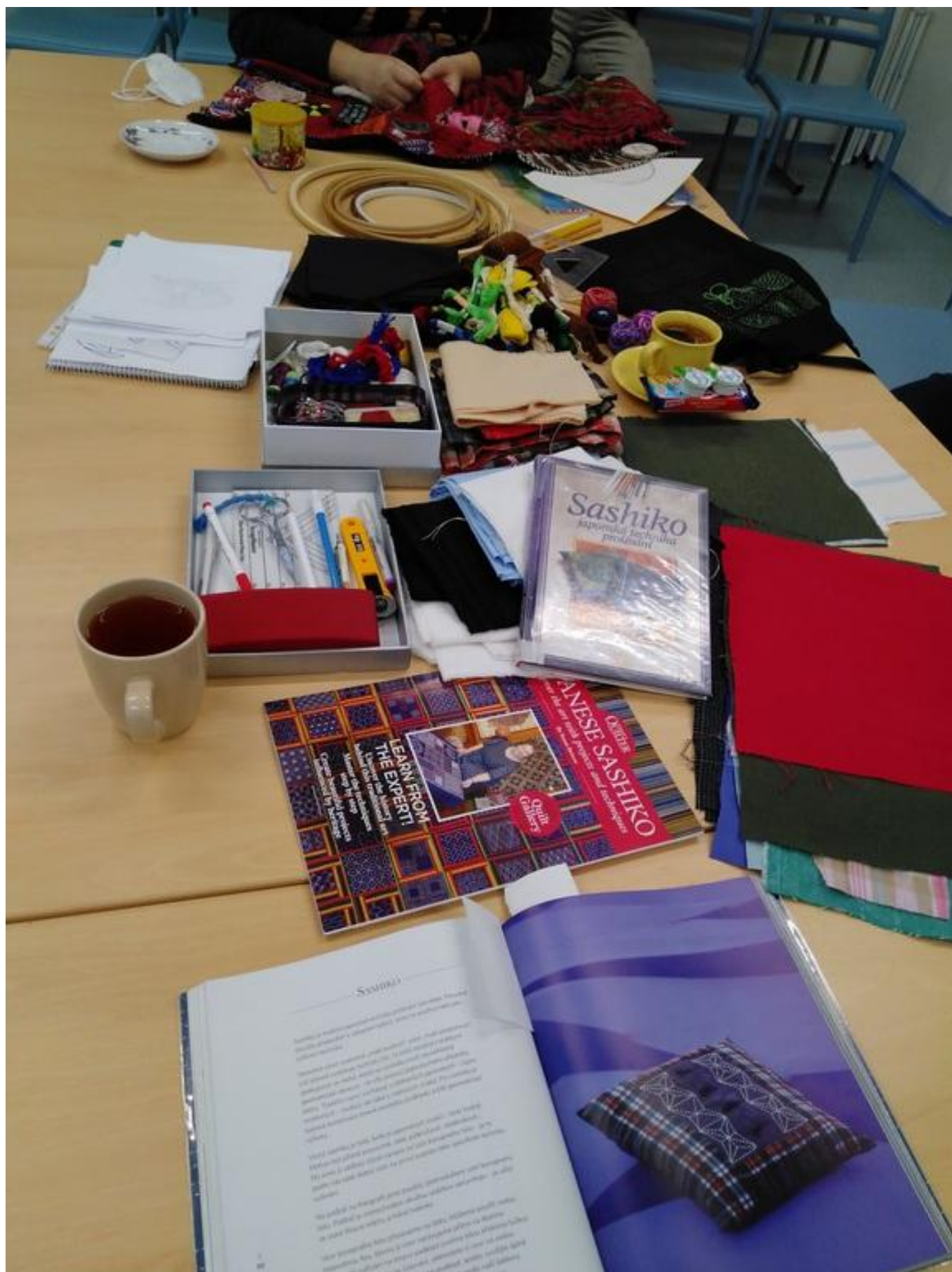
[14] Nechyběla ani související literatura