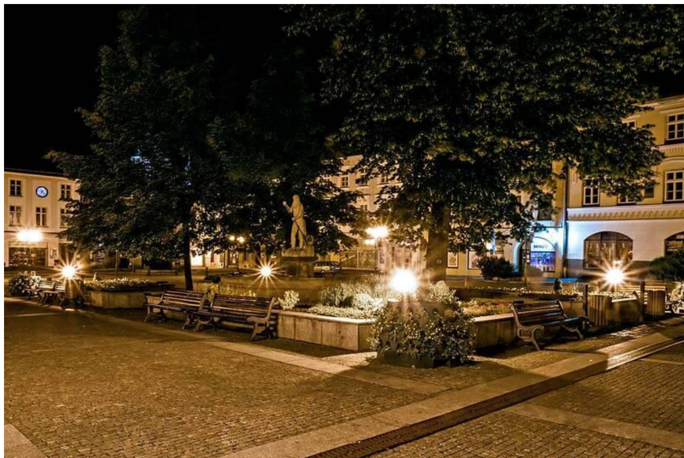
[10] Frenštátské náměstí s kašnou s Neptunem