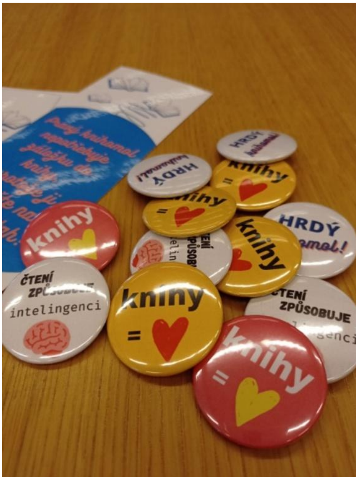
[18] Na luštitelé čekají drobné dárky s knižní tematikou