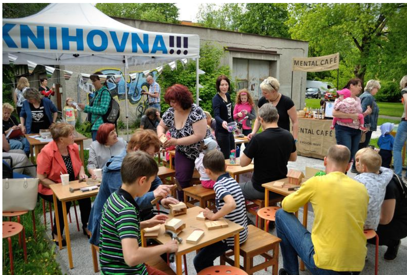
[33] Druhá sousedská slavnost

Na podzim 2019 už začala rekonstrukce. Trvala do konce roku 2020 a provoz po rekonstrukci byl zahájen k 19. únoru 2021, kdy si Knihovna města Ostravy připomíná výročí 100 let od svého vzniku.