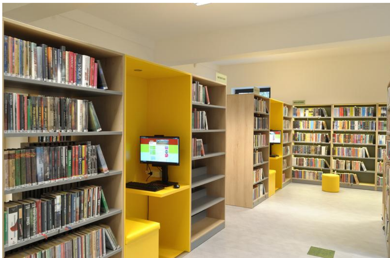
[22] V oddělení pro dospělé