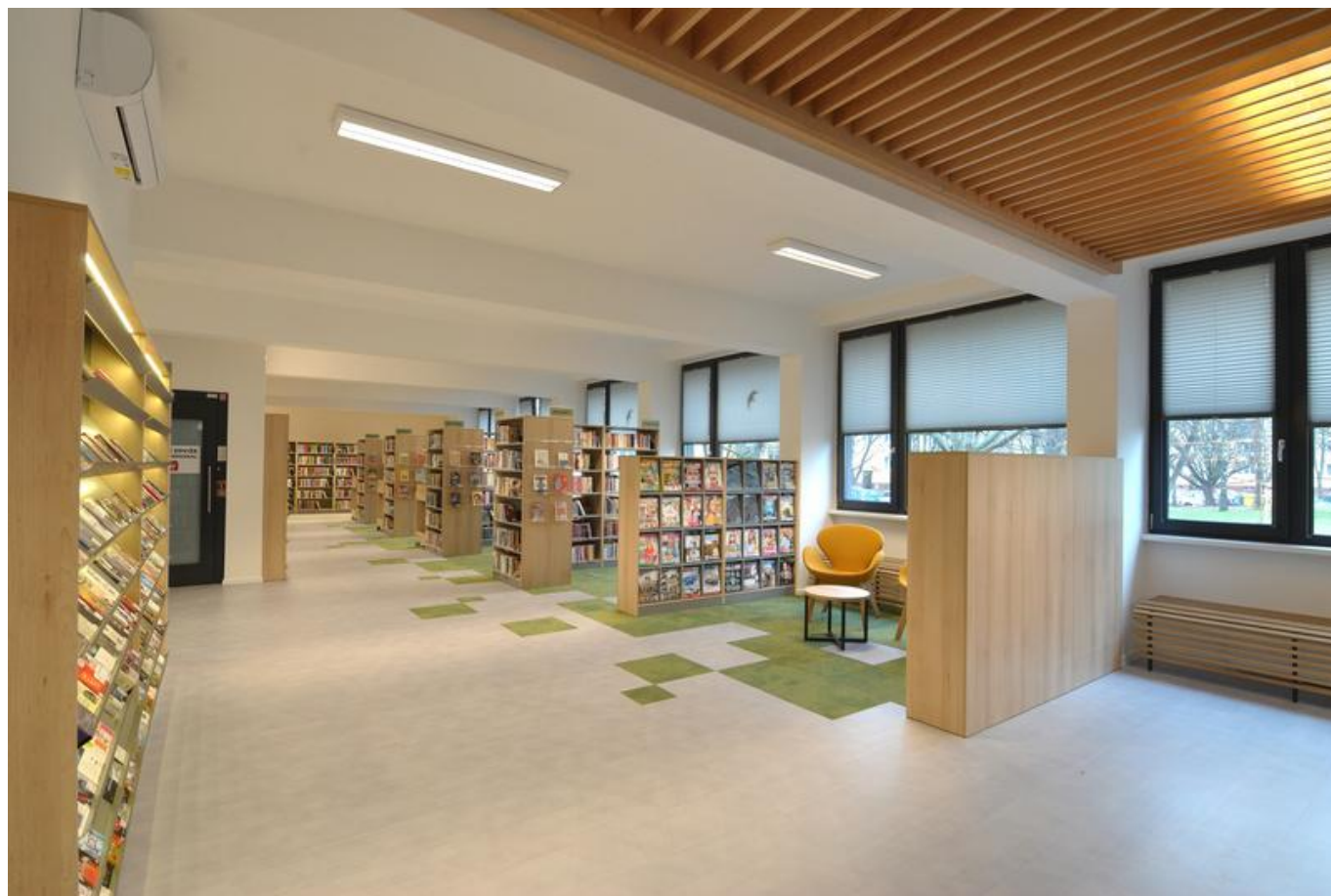
[21] Pohled čtenáře, který vstoupí do oddělení pro dospělé