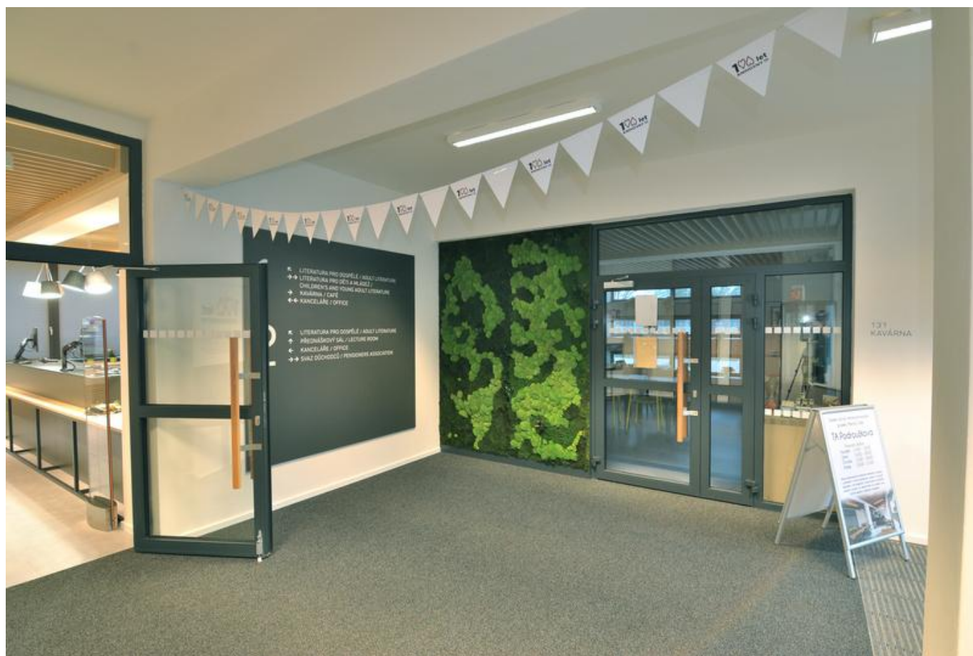
[13] Foyer; pohled při vstupu hlavním vchodem (vstup do kavárny je u dekorace, tzv. mechové stěny)