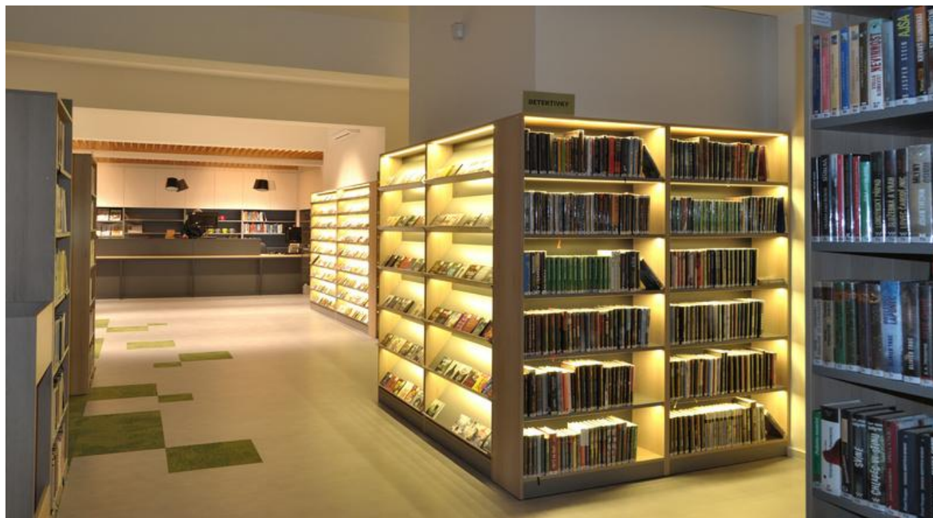
[24] LED osvětlení u vybraných regálů