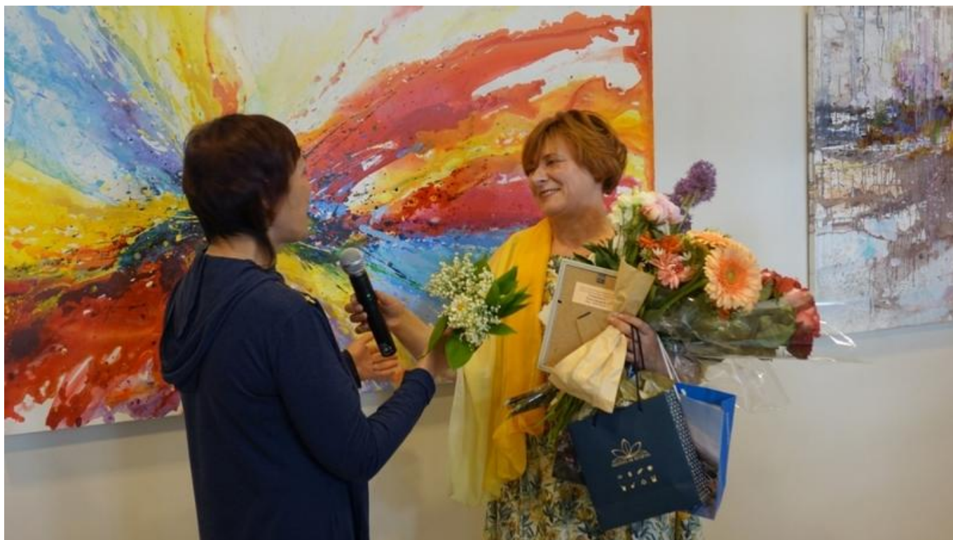
[30] Z vernisáže výstavy