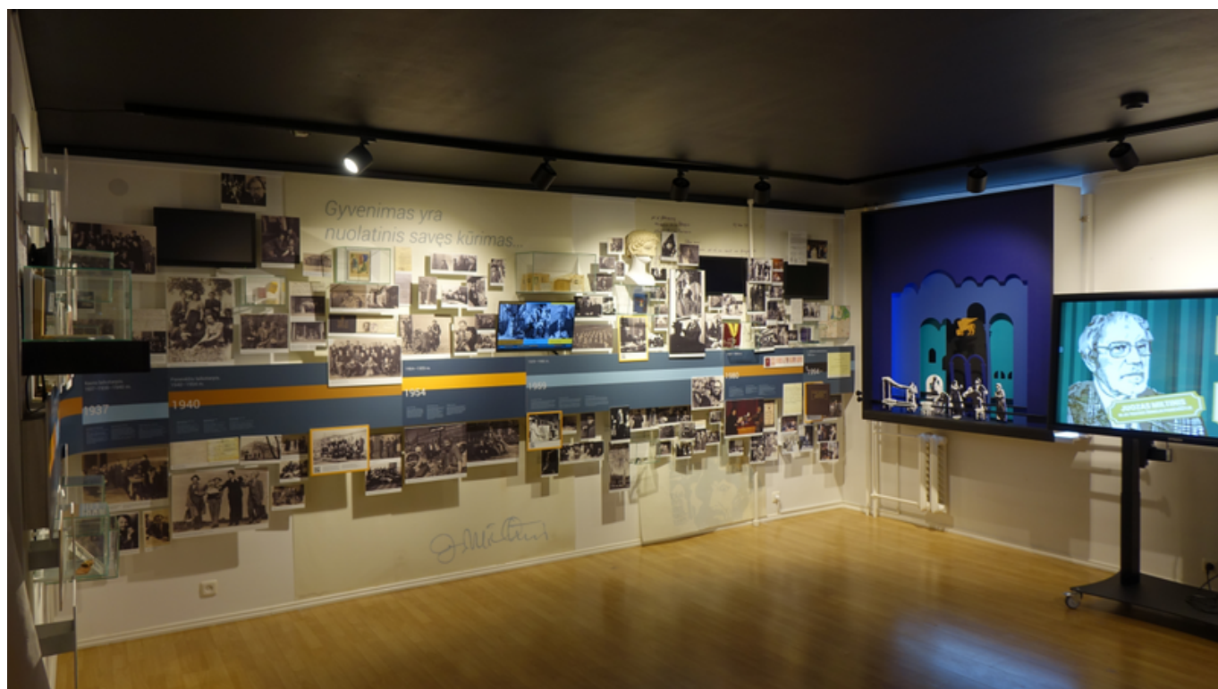
[35] Součástí střediska je moderní expozice