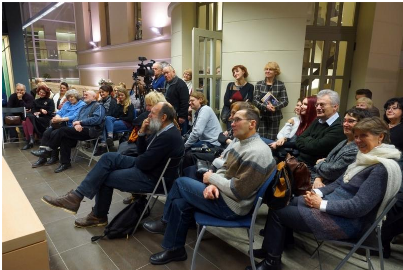
[28] Literární festival v knihovně