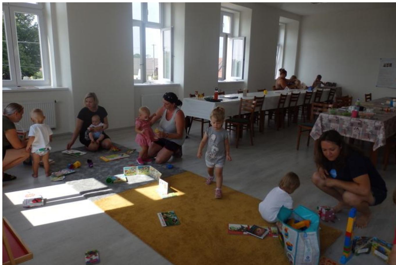
[16] Hraní v učebně