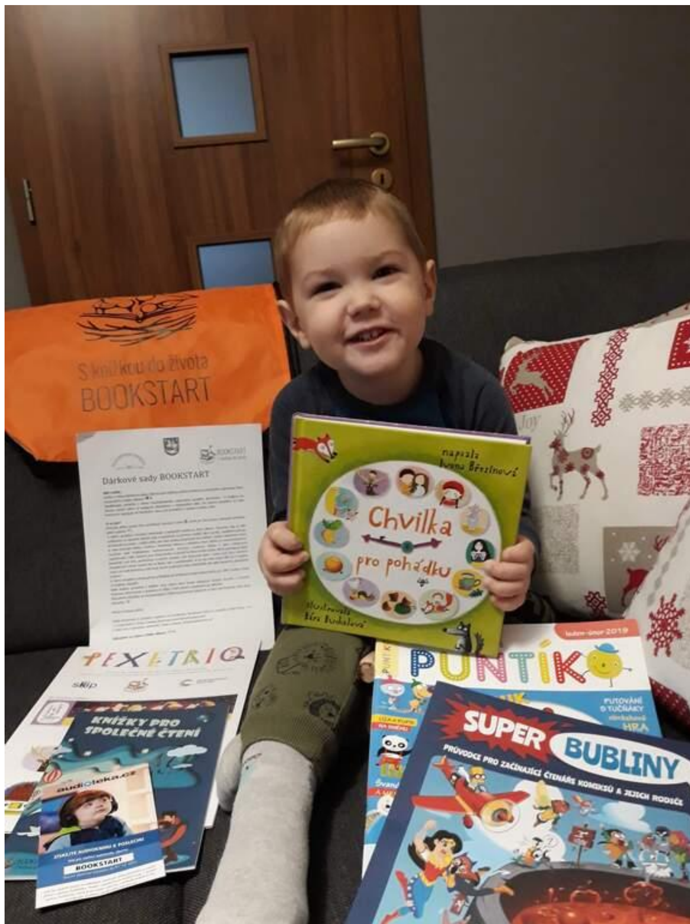
[29] Předání sad doma