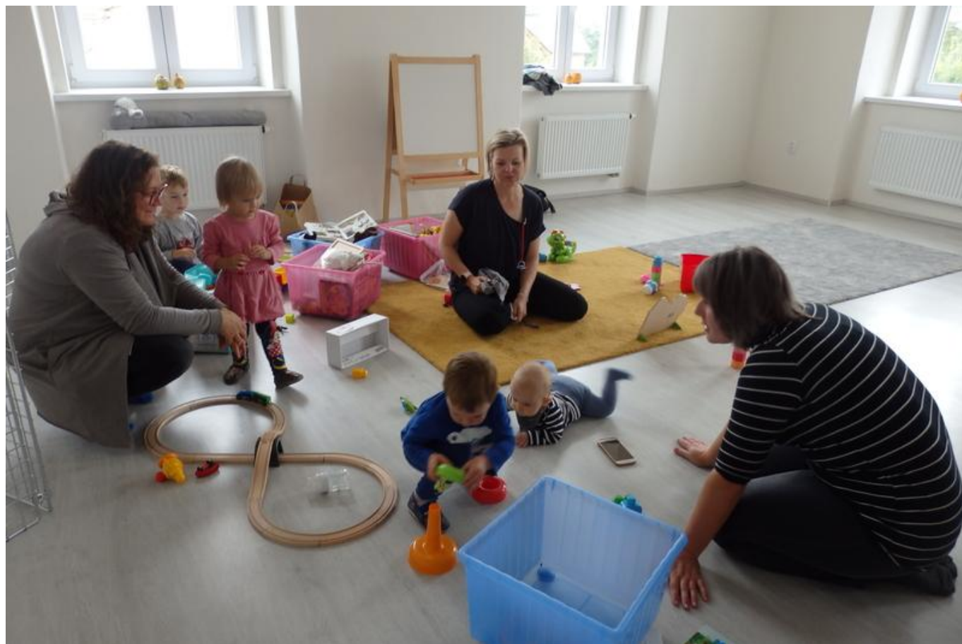
[20] Skupinové hraní v učebně