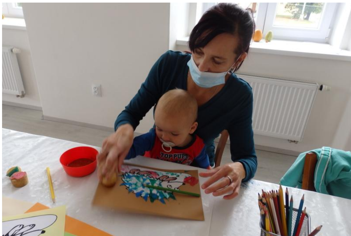
[21] Výroba ježků