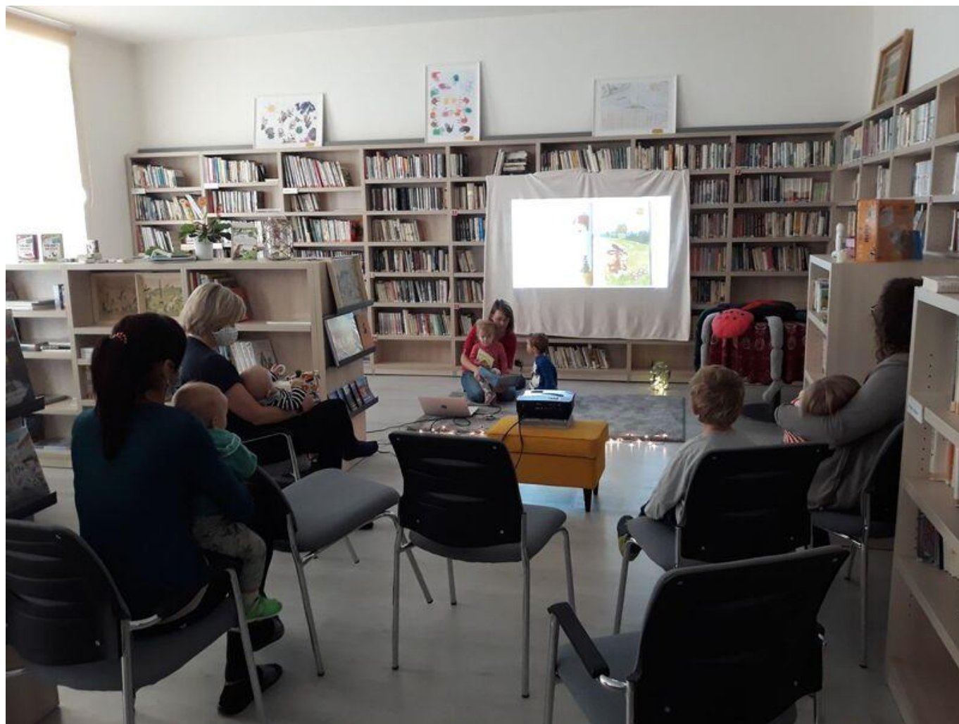
[18] Čtení pohádek s projekcí obrázků při zářijovém setkání