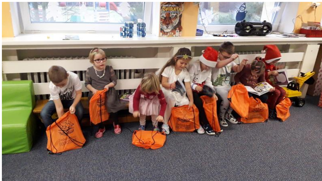
[24] Předání sad ve školce