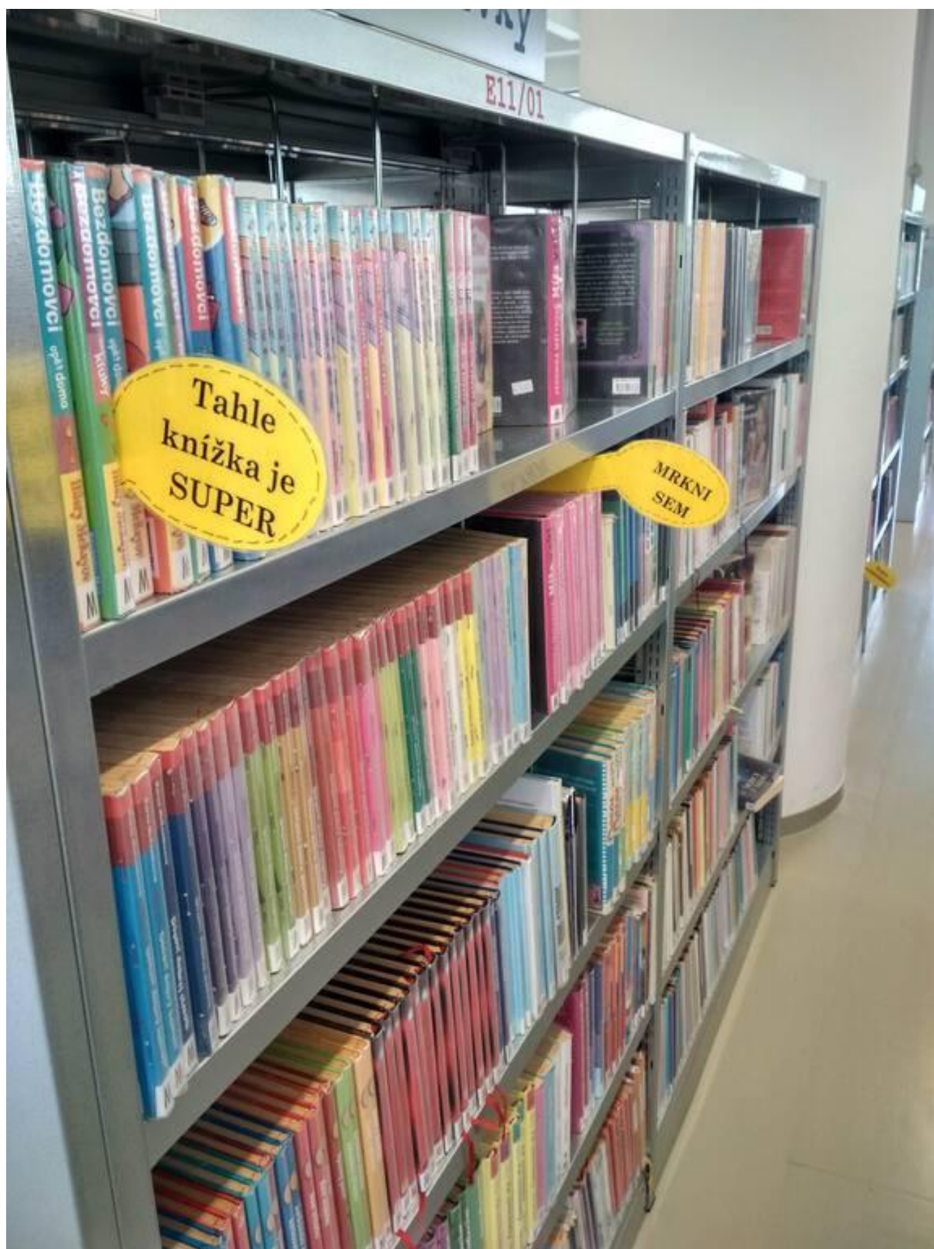
[15] Knihožrouti doporučují knížky