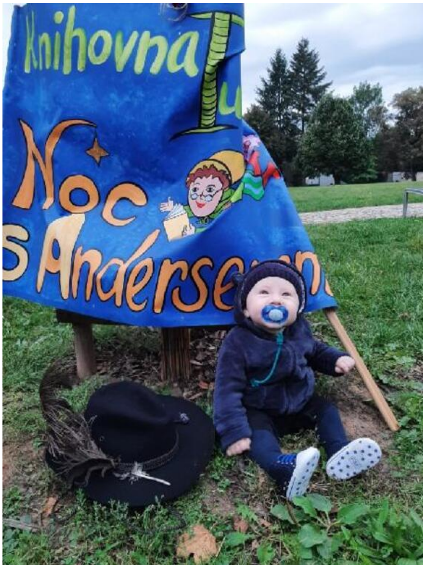
[19] Na čerstvém vzduchu v Turnově