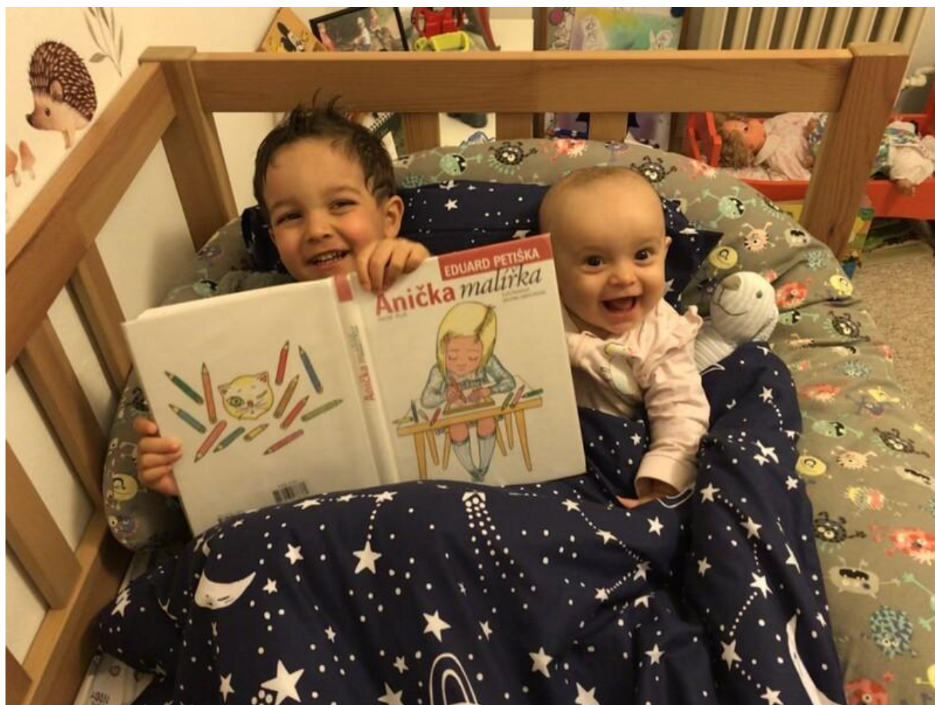
[13] S Aničkou malířkou