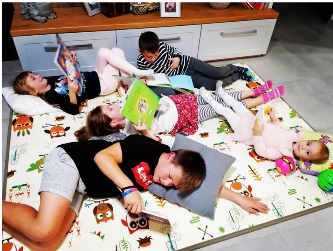
[14] Hromadné čtení