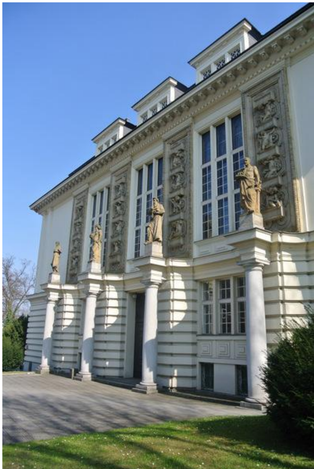
Průčelí budovy (r. 2015)