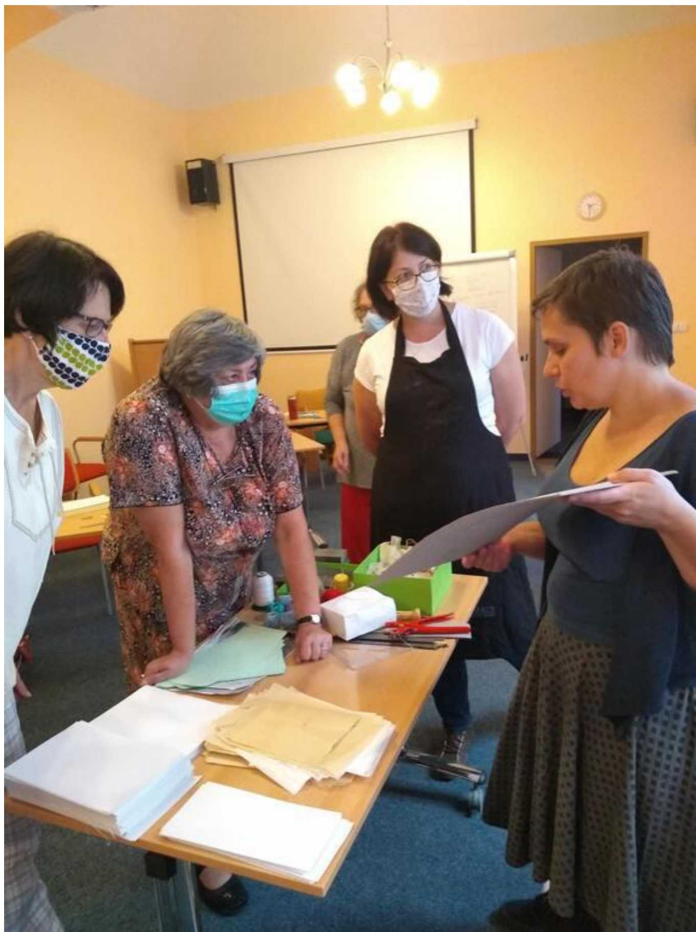
[11] Lektorka ukazuje používané materiály a vazby