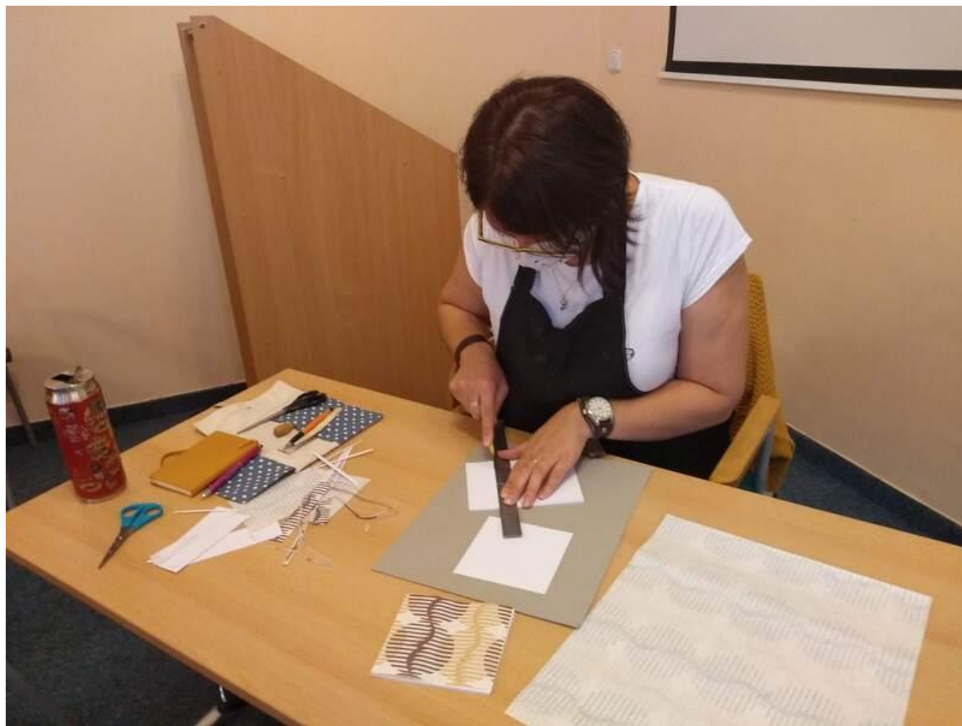
[13] Ořezávání listů papíru do požadované velikosti