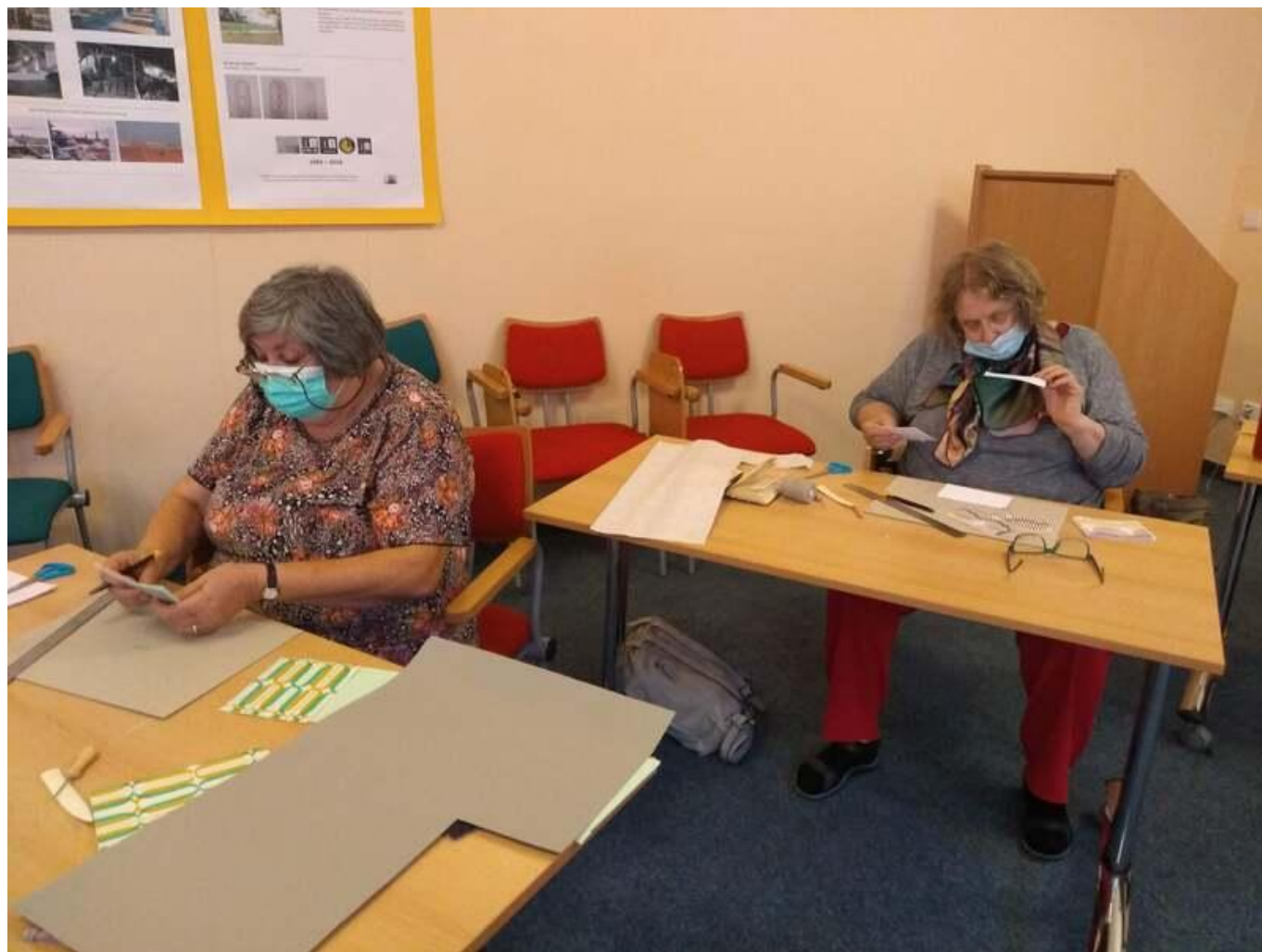
[14] Sestavování listů a obálky