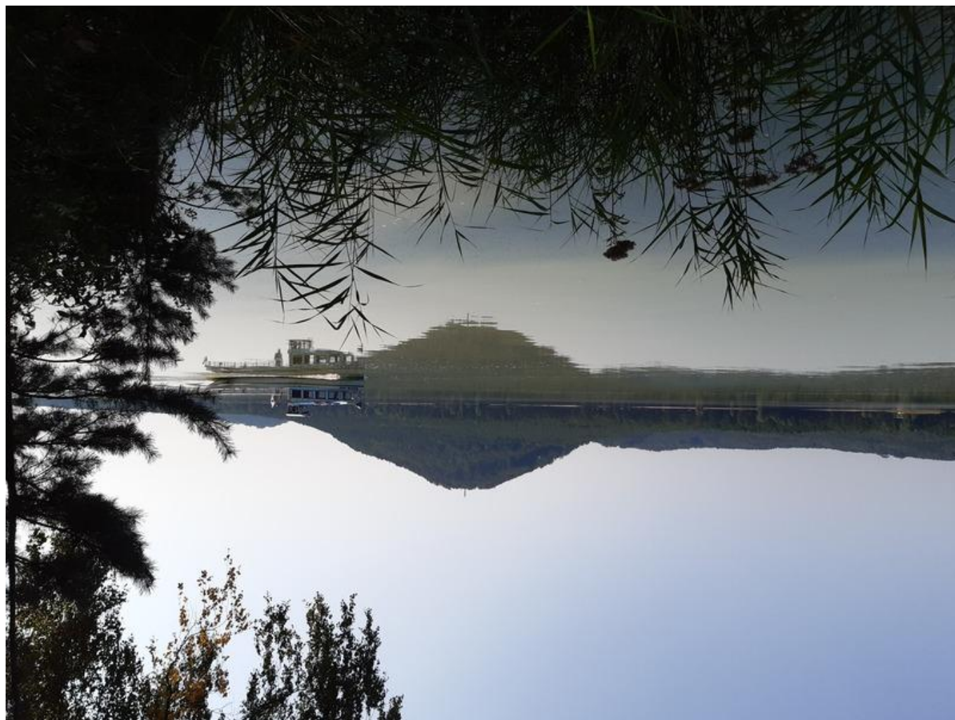
[8] Vrch Borný – symbol Máchova jezera