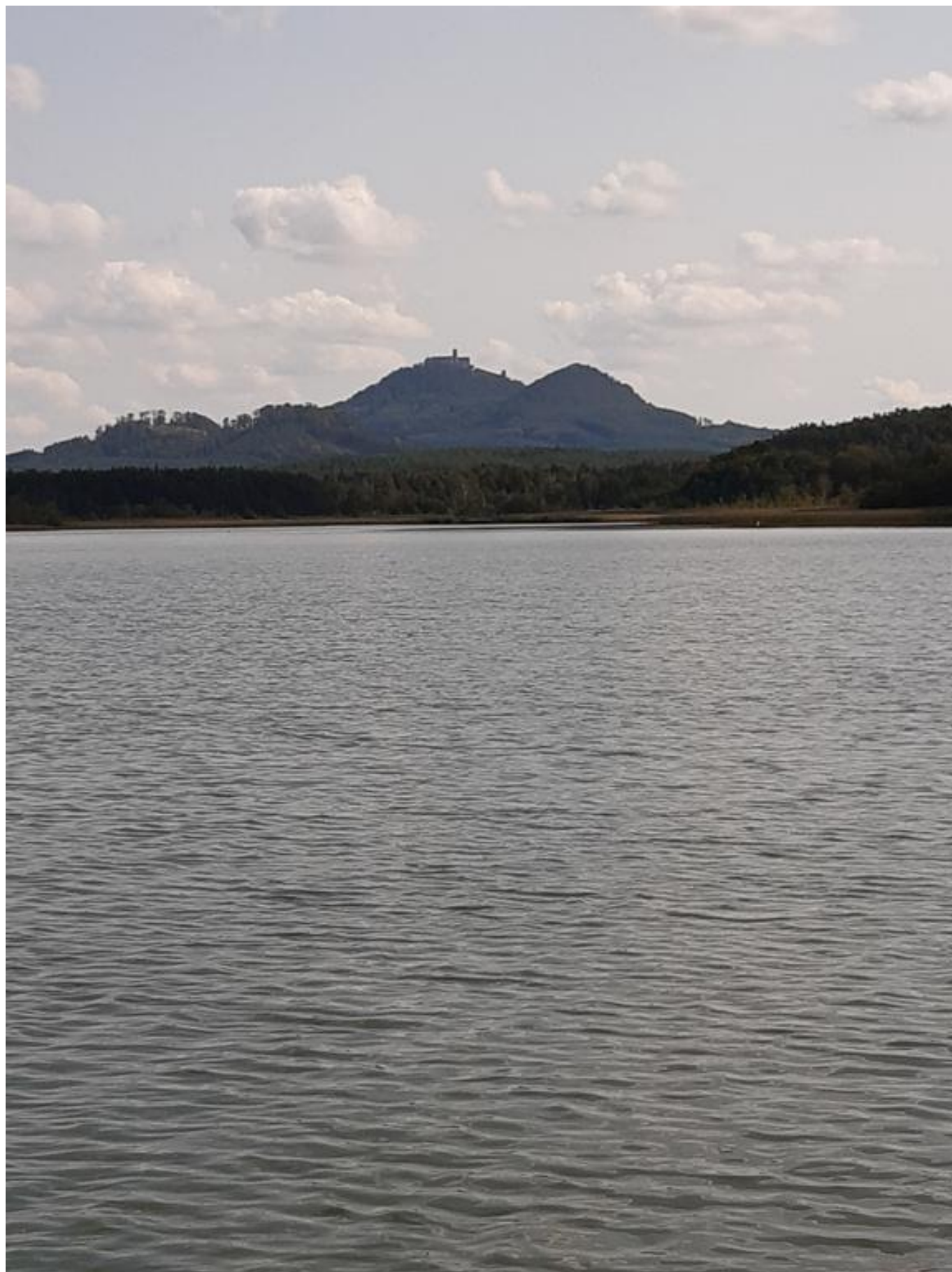
[9] Bezděz z vodní plochy Máchova jezera