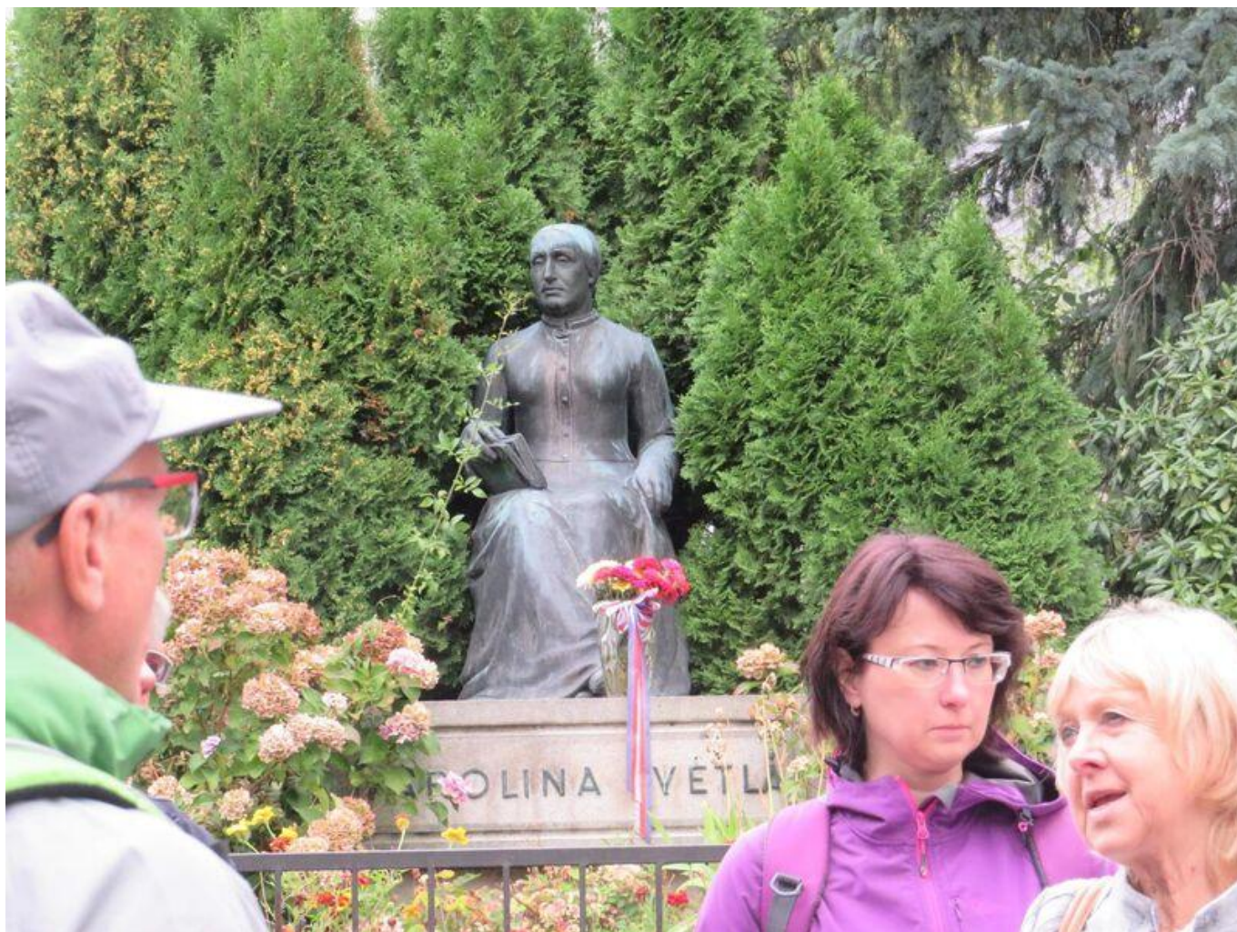
[11] Bronzová socha Karoliny Světlé ve Světlé pod Ještědem