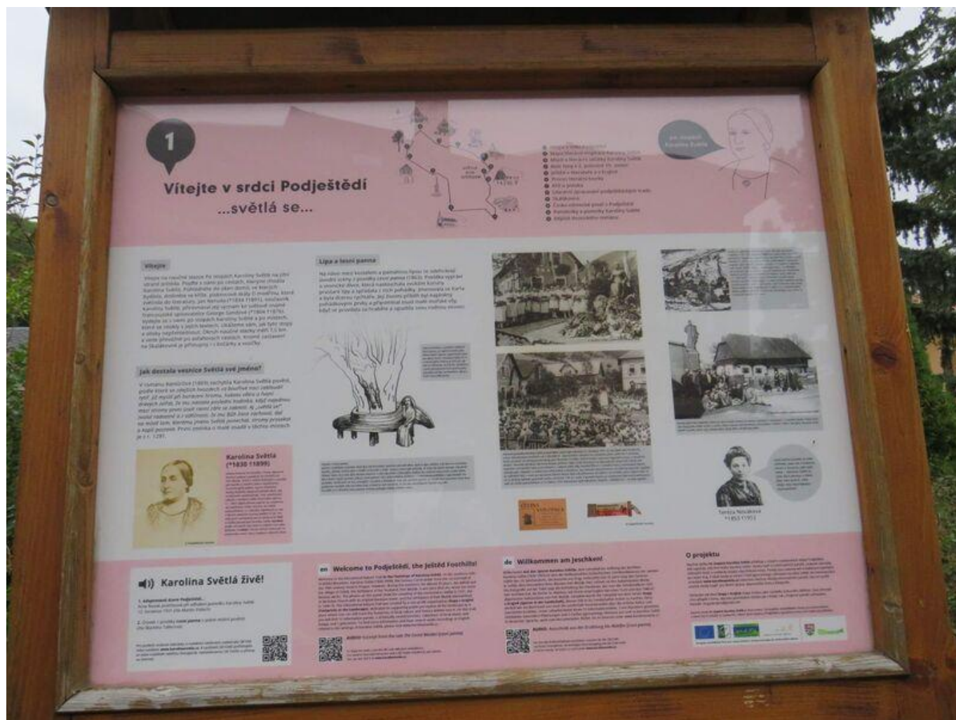
[9] První zastávka naučné stezky