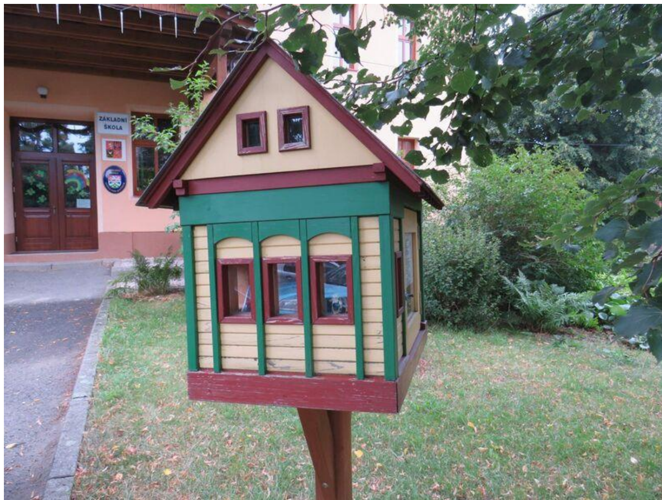
[12] Knihobudka ve Světlé pod Ještědem