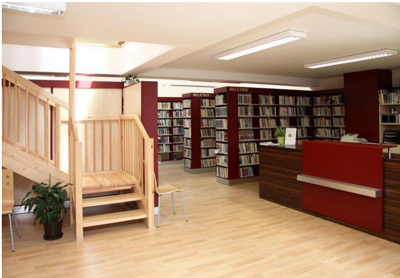
[12] Oddělení pro dospělé