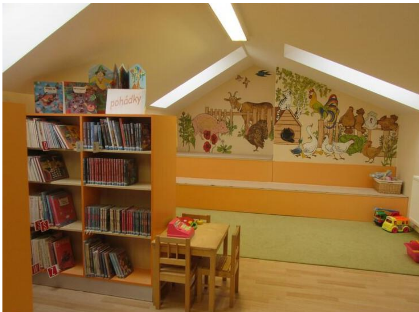
[15] Oddělení pro děti