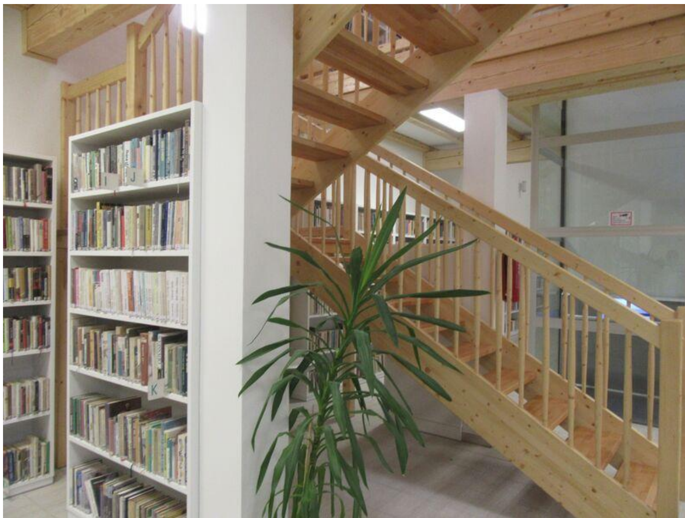
[19] Oddělení pro dospělé