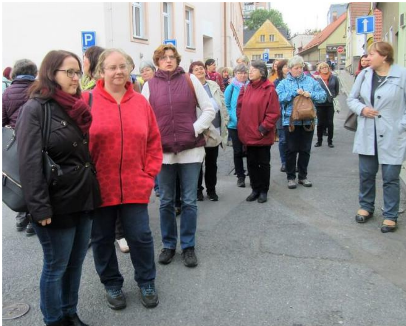
[10] Před blovicou knihovnou