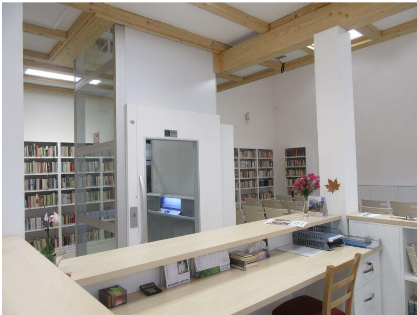
[18] Přízemí knihovny