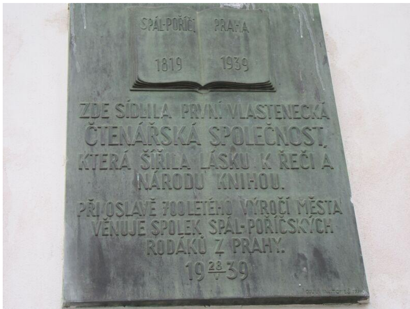
[17] Připomínka čtenářské společnosti