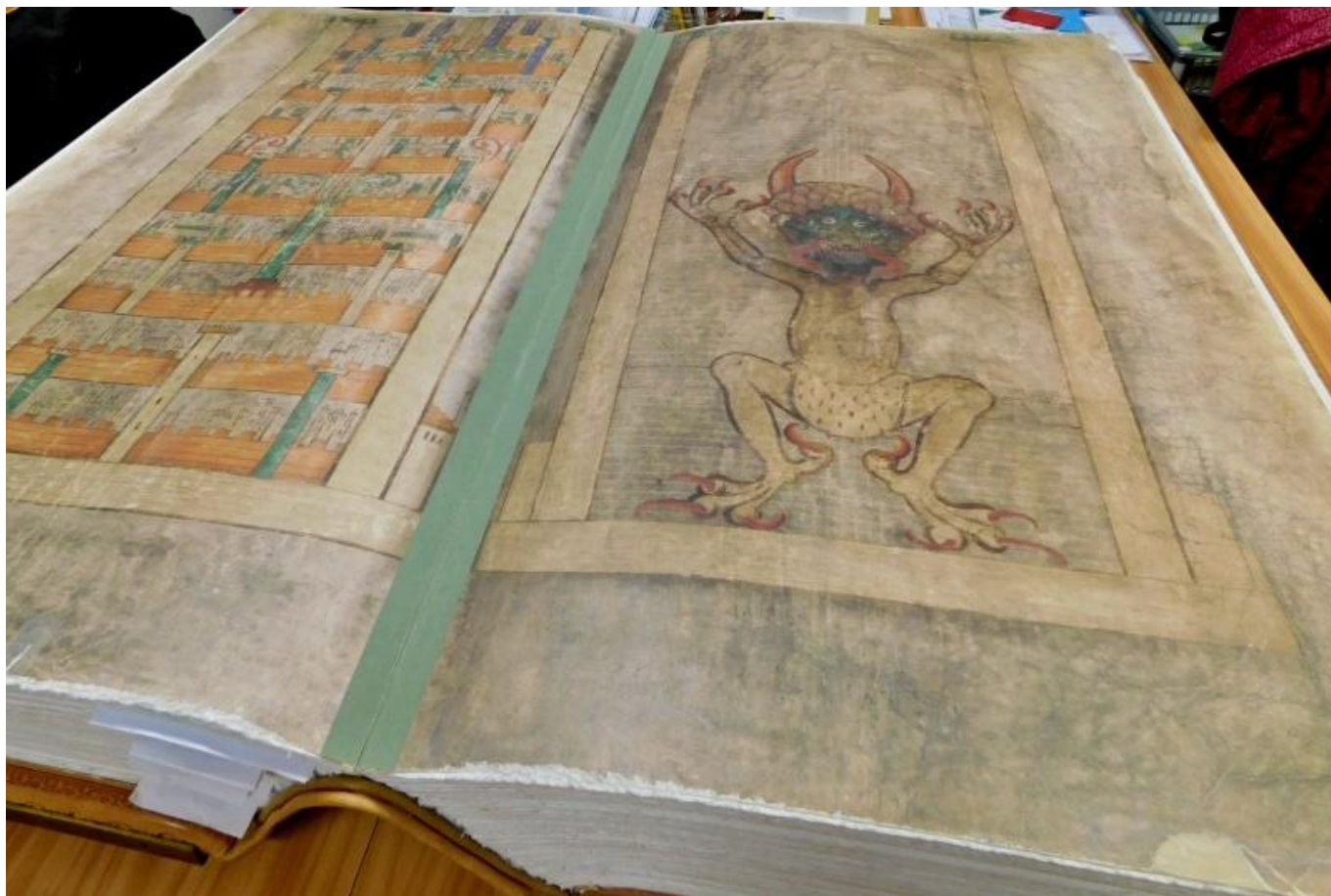
[17] Ukázka z knihy