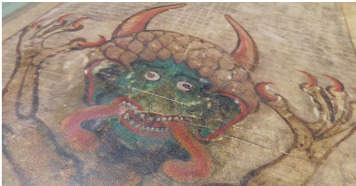
[18] Detail vyobrazení

Spolupráce knihoven Mokrý a Přepychy se Spolkem ABAKUS určitě není poslední ani ojedinělá. Knihovna v Mokrém se spolkem spolupracuje od jeho vzniku v roce 2006. V roce 2009 byl Spolek ABAKUS významným partnerem výročí vzniku knihovny v Mokrém. Od té doby jejich spolupráce trvá víceméně nepřetržitě. Jedná se především o podporu kulturního dění v regionu, propagaci myšlenky projektu Rodného kraje Františka Kupky i za hranice regionu.