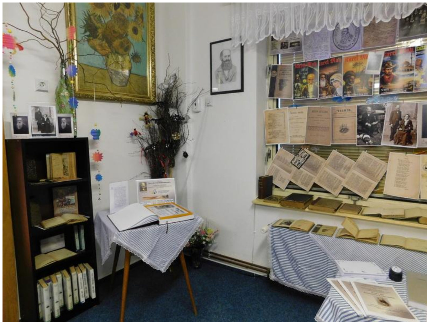
[17] Výstava v knihovně