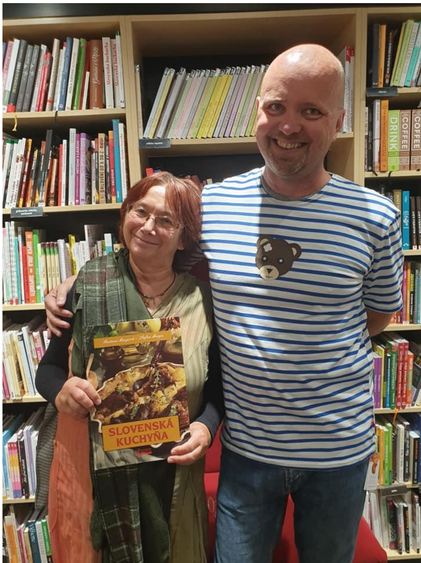
[15] Exkurze v knihkupectví Martinus v Bratislavě