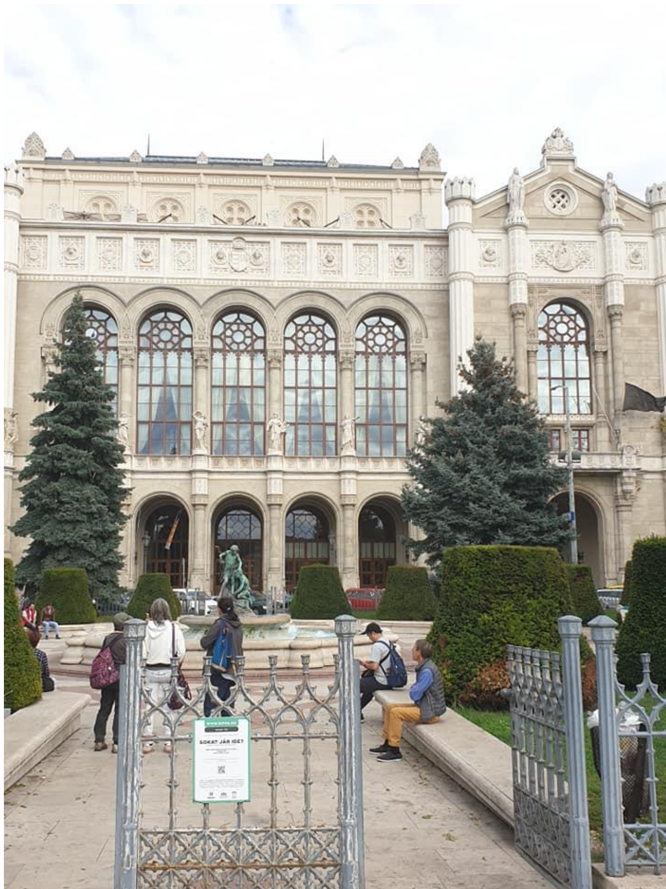
[12] Budapešťská secese