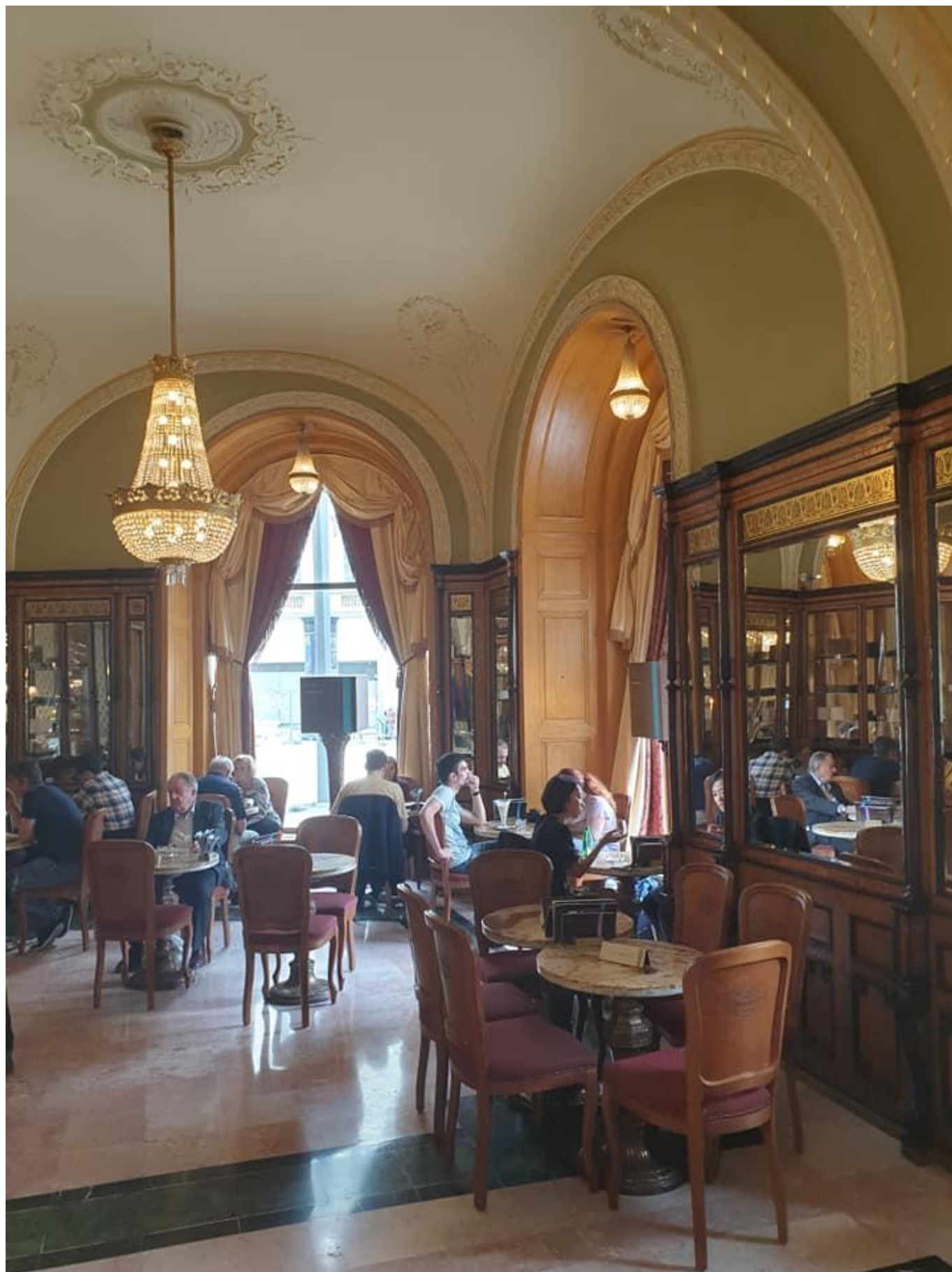
[13] Kavárna Gebaud v Budapešti