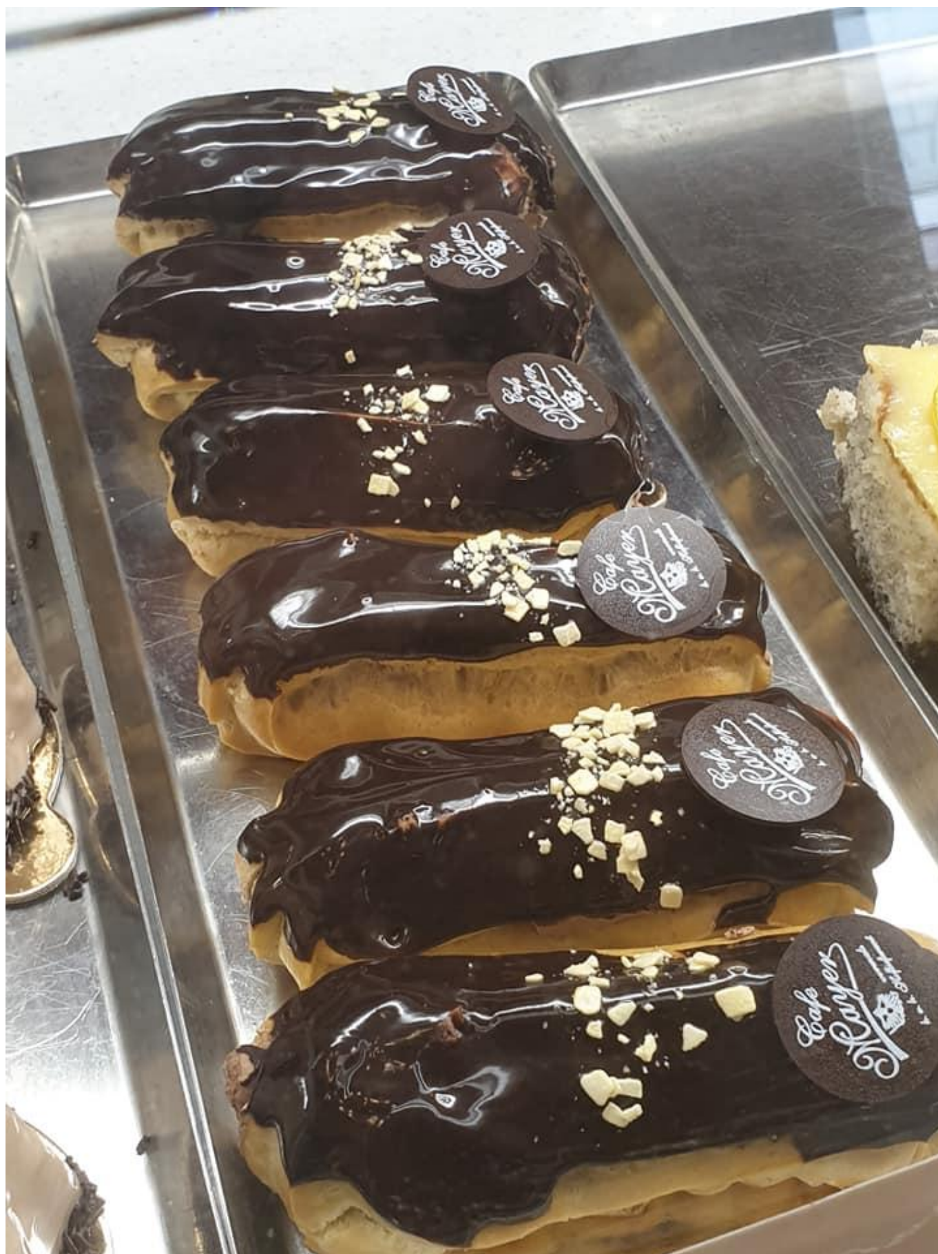
[14] Dezerty v Kaffe Mayer v Bratislavě