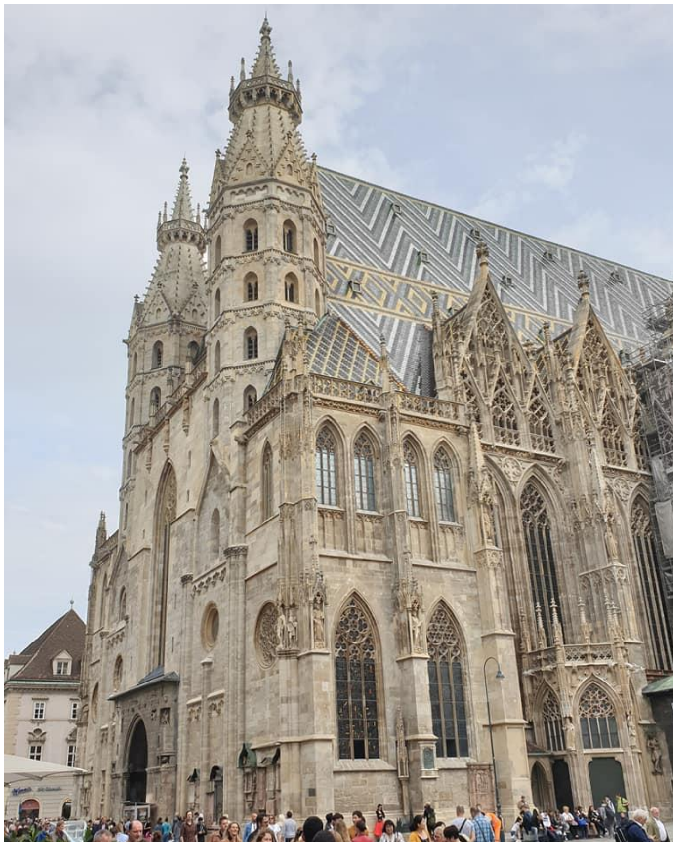
[11] Chrám sv. Štěpána ve Vídni

Druhý den jsme se vydali do Budapešti, kde do druhé světové války fungovalo pět set kaváren. Mohli jste zde potkat Franze Kafku, Charlese Chaplina, Alfreda Hitchcocka nebo Marlene Dietrichovou. Dnes jich můžete navštívit 195. V některých kavárnách si můžete připadat jako na zámku. Duch mocnářství se z kaváren nedal vyhnat. Naše první zastávka byla v kavárně Gerbaud. K Pešti