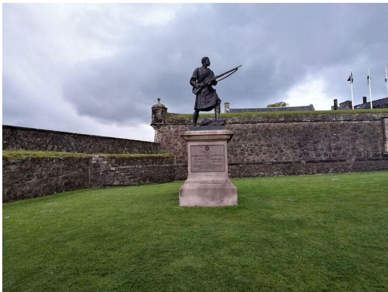
[42] Stirling Castle