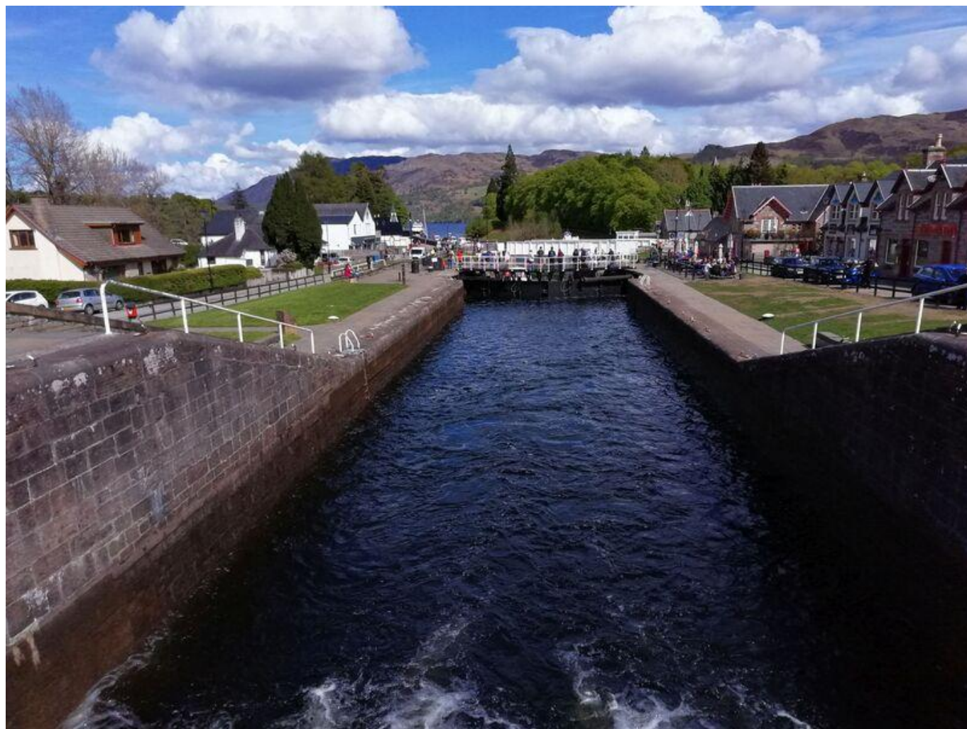
[31] Fort Augustus - nad zdymadly