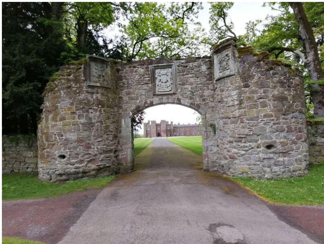
[39] Stará brána v parku u Scone Palace