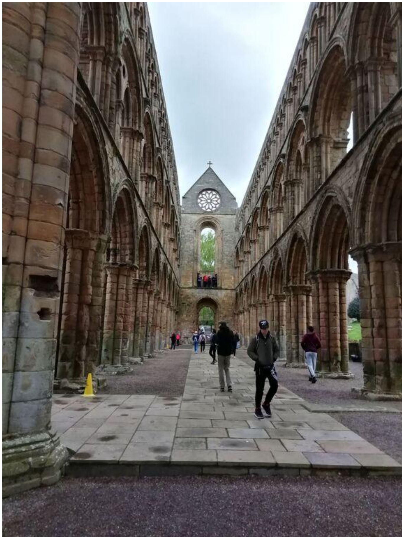
[12] Jedburgh - chrámová loď