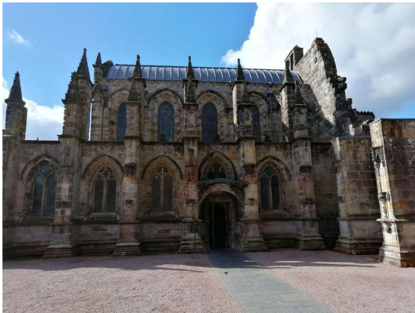
[47] Roslynská kaple