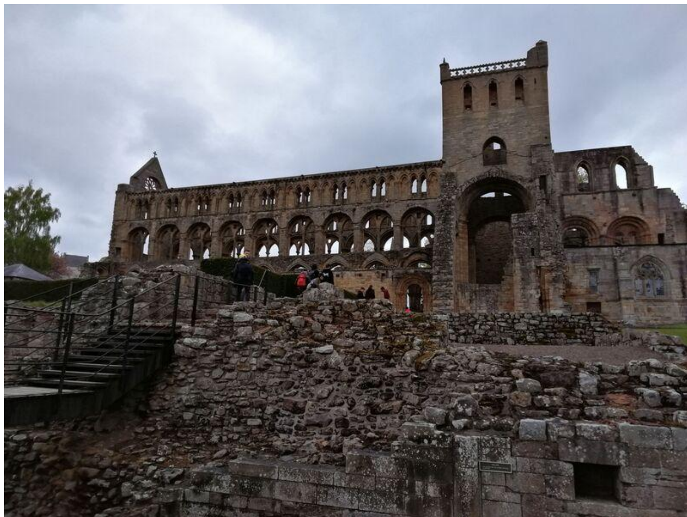
[11] Jedburgh - ruiny augustiniánského opatství