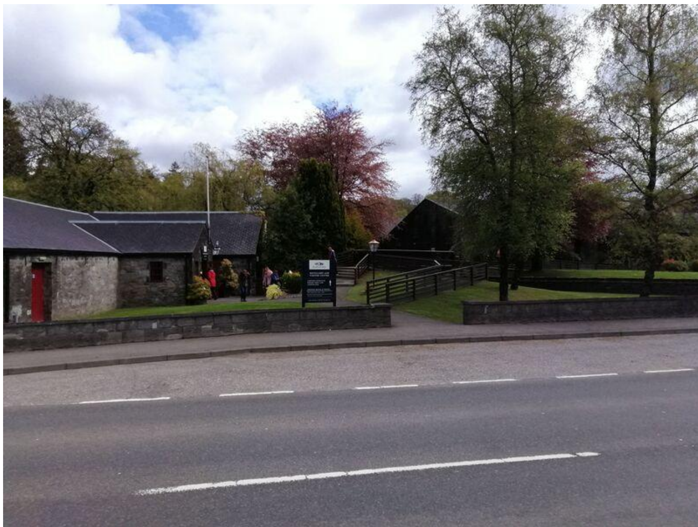
[36] Romantický vstup do Distillery Blair Athol