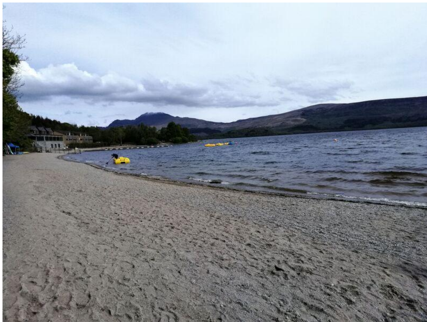
[22] Loch Lomond