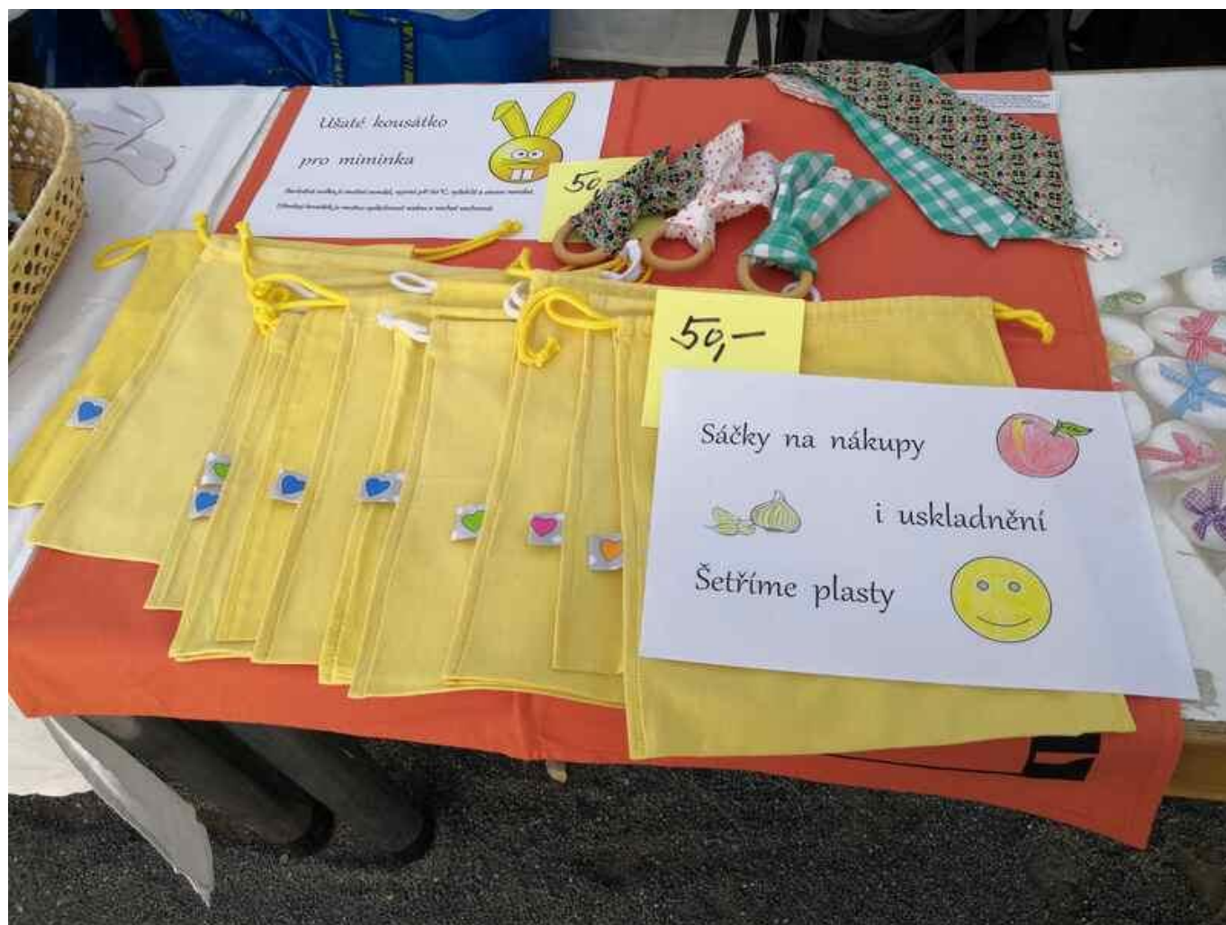
[34] Stánek Marty Kožíšek Ouřadové s ekologickými výrobky