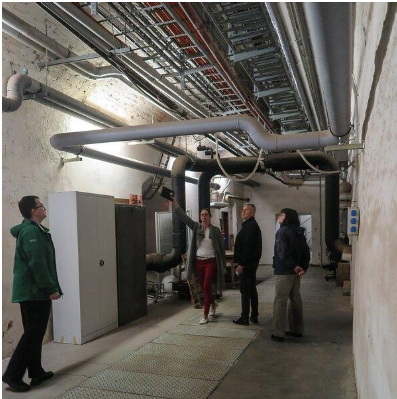
[20] Technické zázemí