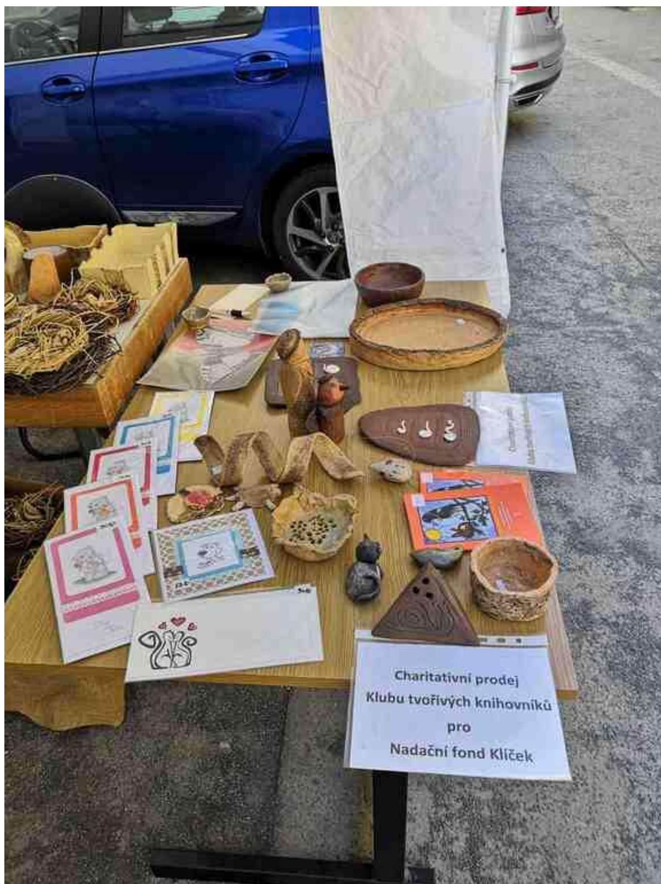
[16] Charitativní prodej pro Nadační fond Klíček