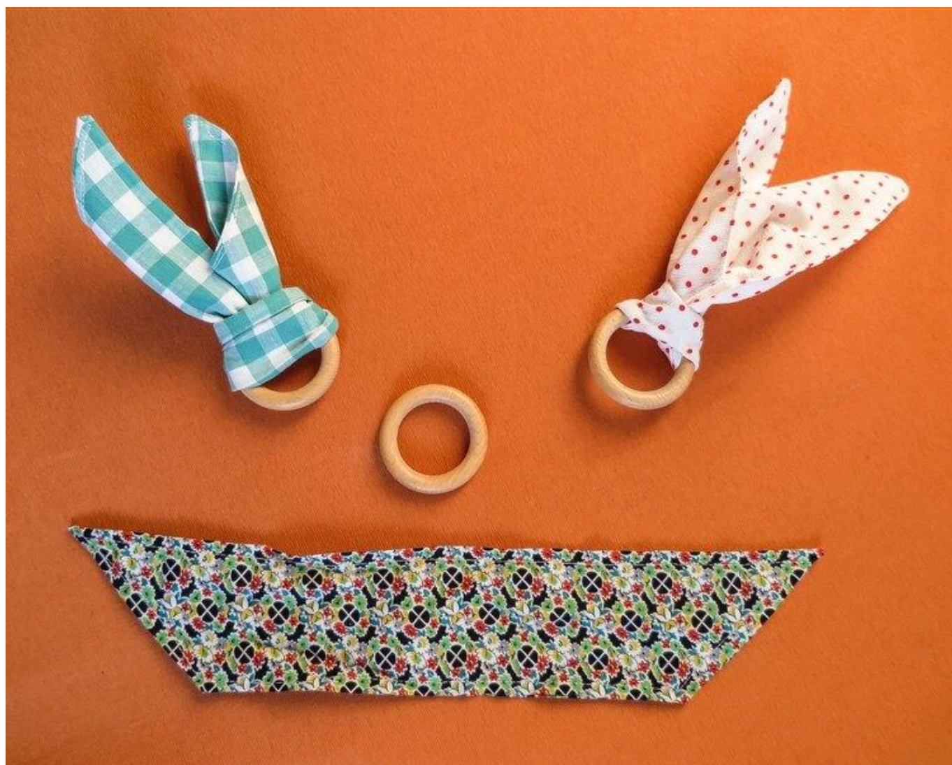
[38] Jak vytvořit kousadlo pro miminka