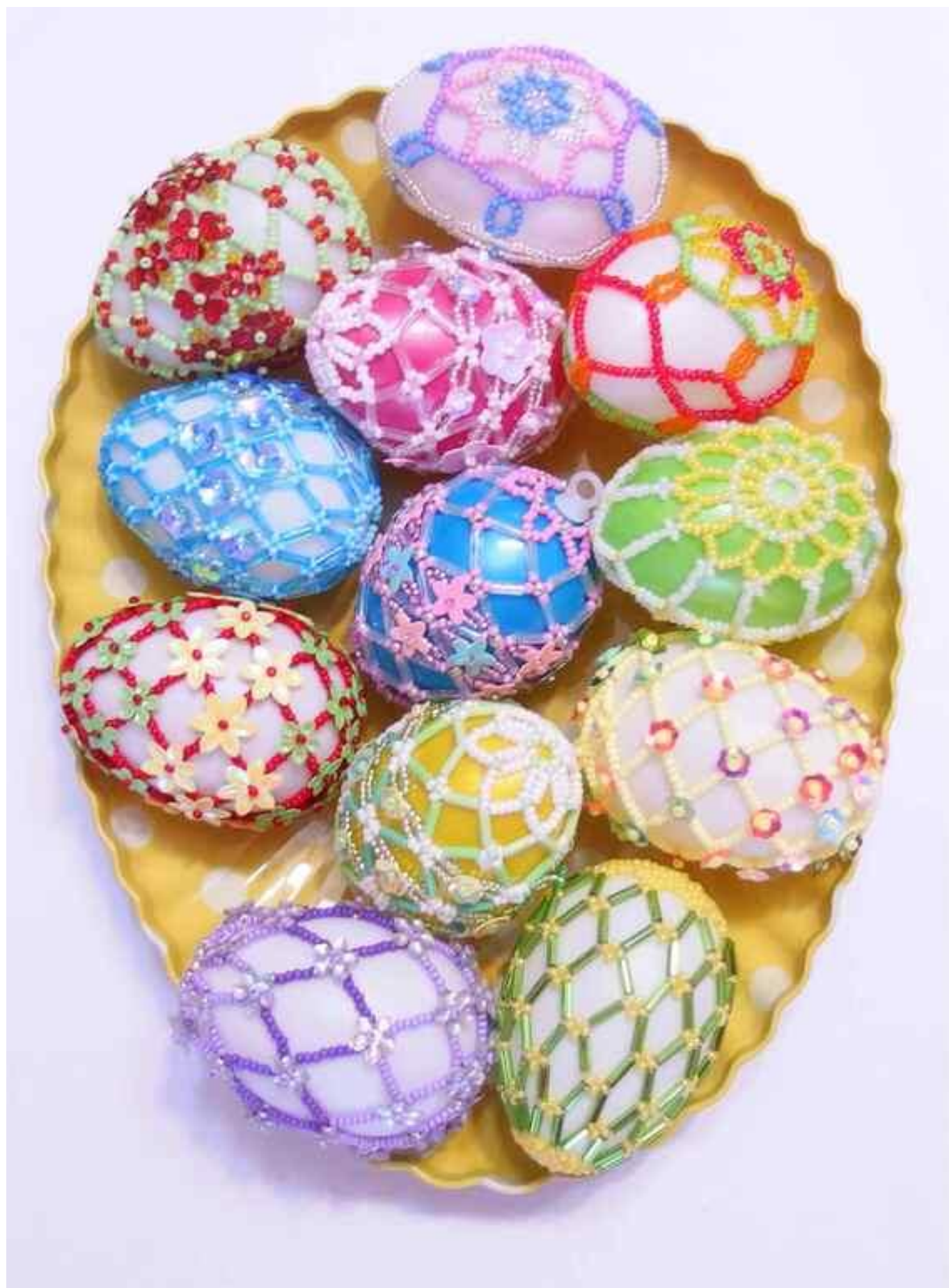
[32] Velikonoční kraslice zdobené korálky