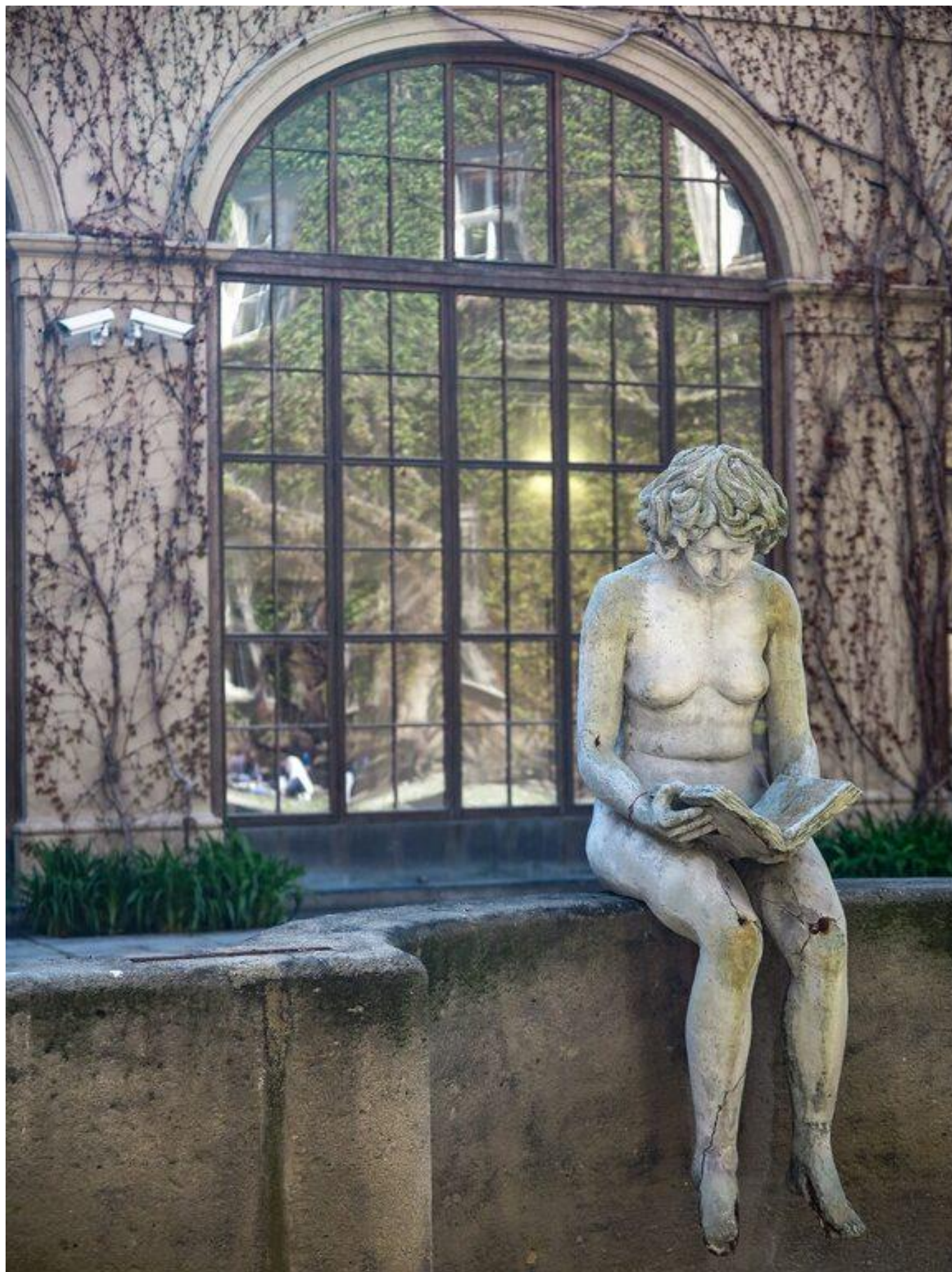
[22] Kašna se sochami na révovém nádvoří