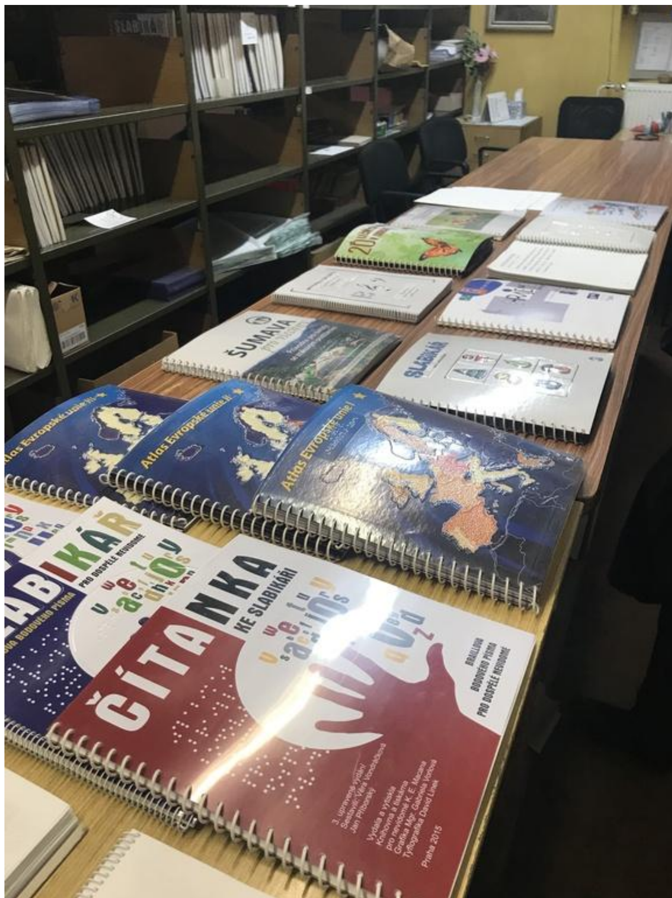
[17] Knihovna a tiskárna pro nevidomé K. E. Macana - produkce tiskárny