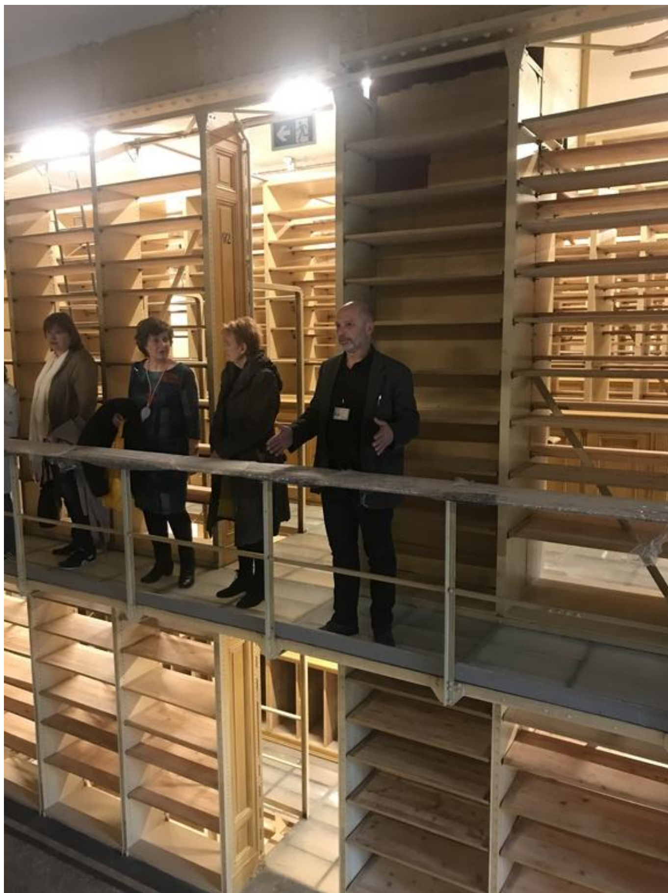
[15] Národní muzeum - zatím prázdné sklady knihovny