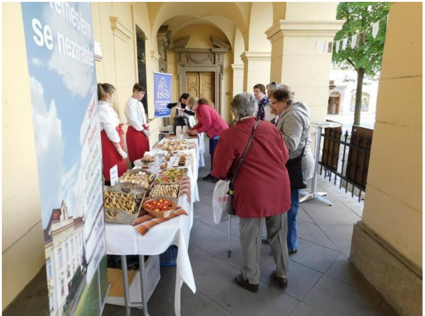
[35] Férová snídaneň - ochutnávka