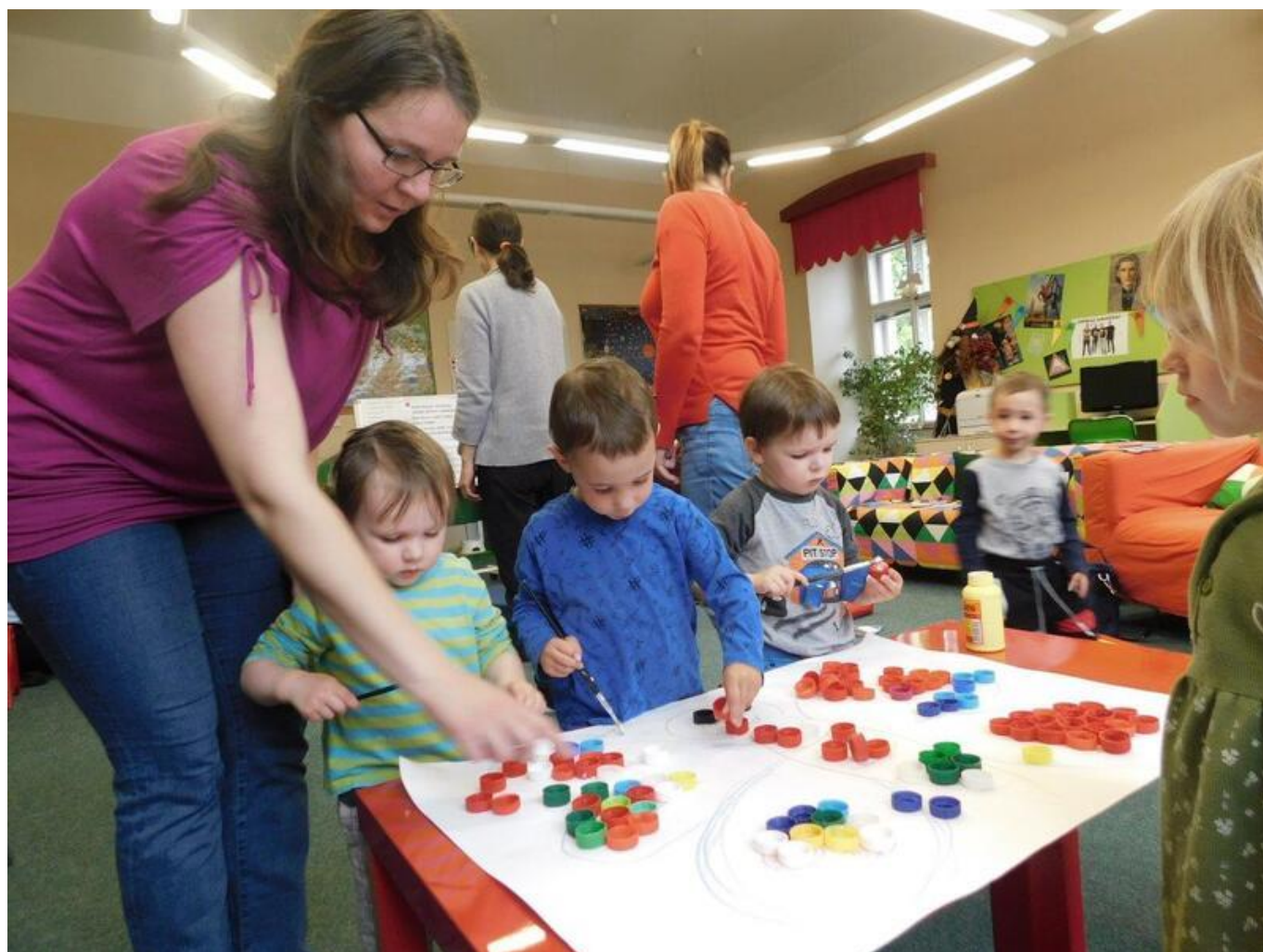
[15] Čítálek - výtvarné tvoření

V roce 2014 jsme začali intenzivně spolupracovat s Informačním centrem pro mládež [16] a jeho zahraničními dobrovolníky. Od té doby jsme již dvakrát zrealizovali týdenní programy pro žáky základních a studenty středních škol s názvem Nesud' knihu podle obalu (projekt Živá knihovna), které měly vyvrátit u dětí zažitá stereotypy o jiných národech a národnostech. Dětem se moc líbili dobrovolníci z cizích zemí (čím byla jejich země vzdálenější, tím byli vyhledávanější). Komunikační jazyk byla angličtina nebo němčina, takže si děti mohly současně vyzkoušet, jak na tom jsou s cizím jazykem. K dispozici jsme samozřejmě měli tlumočníky, ale děti si hravě poradily. Dobrovolníci, kteří jsou u nás ve městě v Informačním centru pro mládež na stáži a bývají z různých zemí světa, dochází pravidelně každý týden do knihovny a zapojují se do aktivit s dětmi.