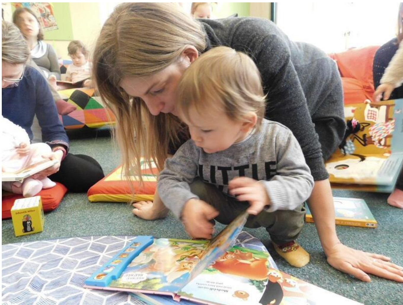
[12] Čítálek - seznamování s novými knihami