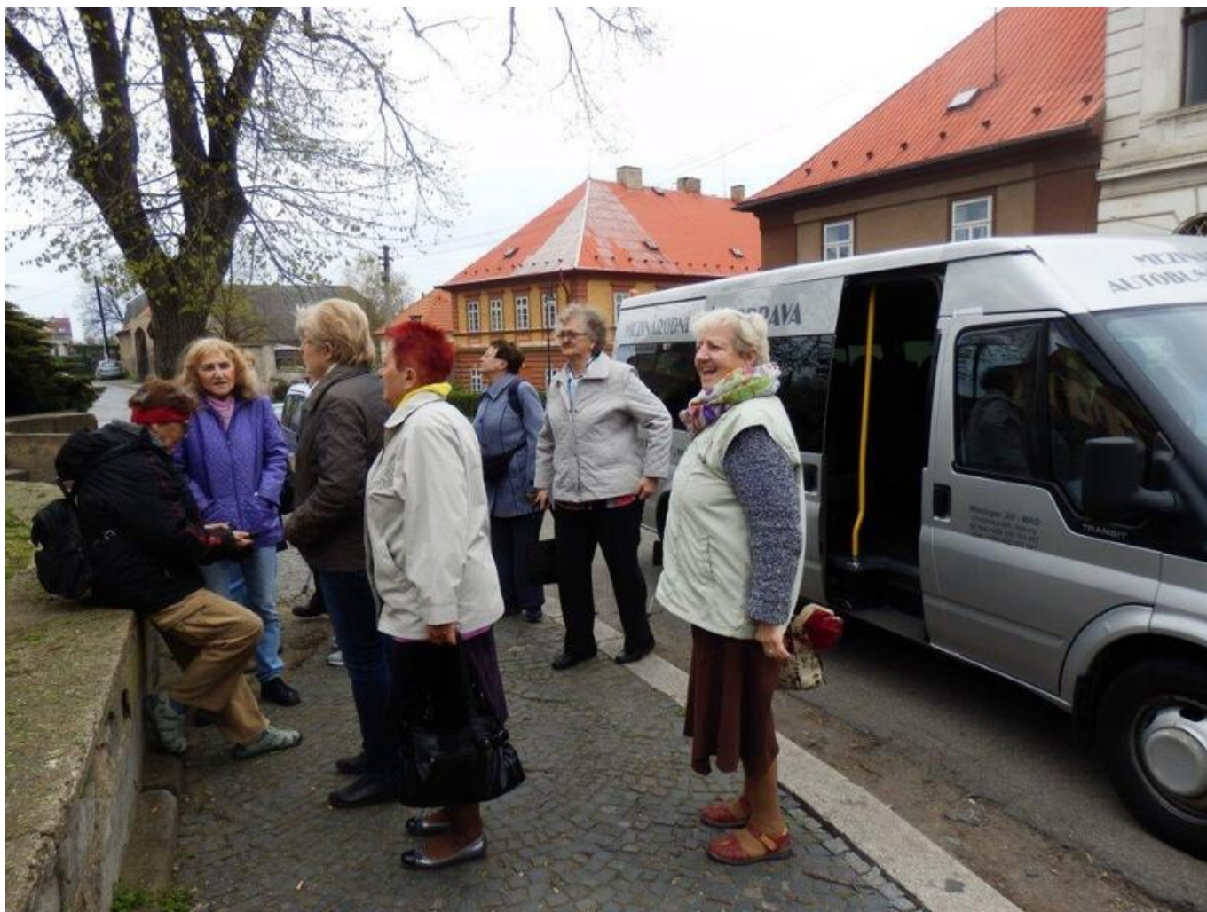
[24] Setkávání - výlet do Zlonic