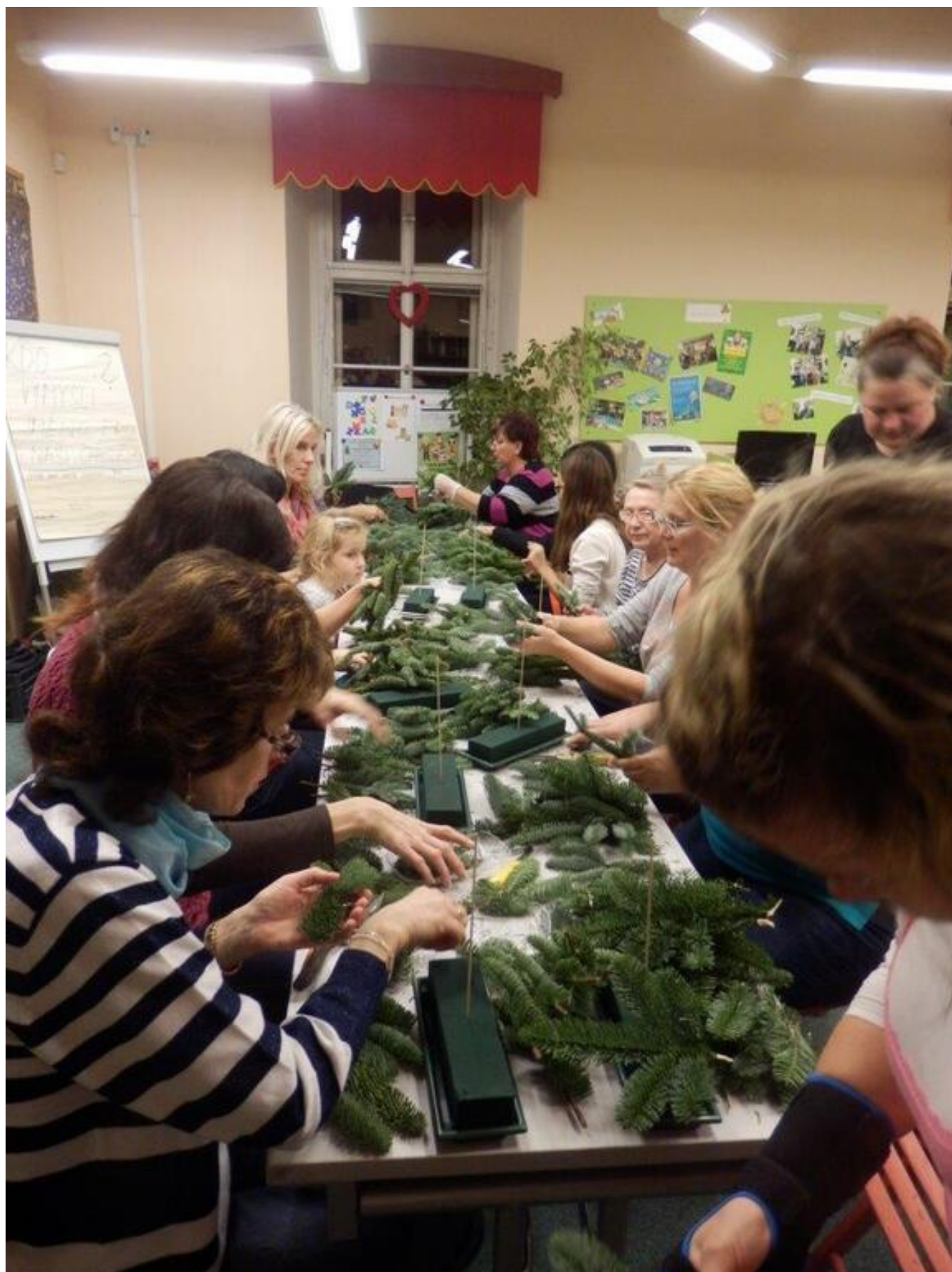
[25] Setkávání - vytváření dekorací z chvojí