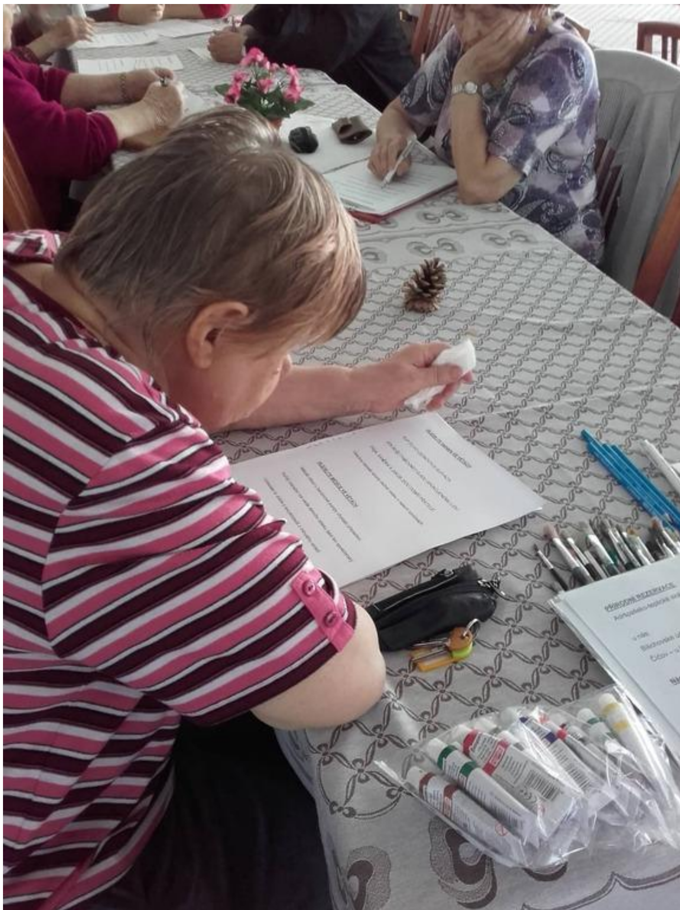
[31] Hrátky s pamětí - rébusy