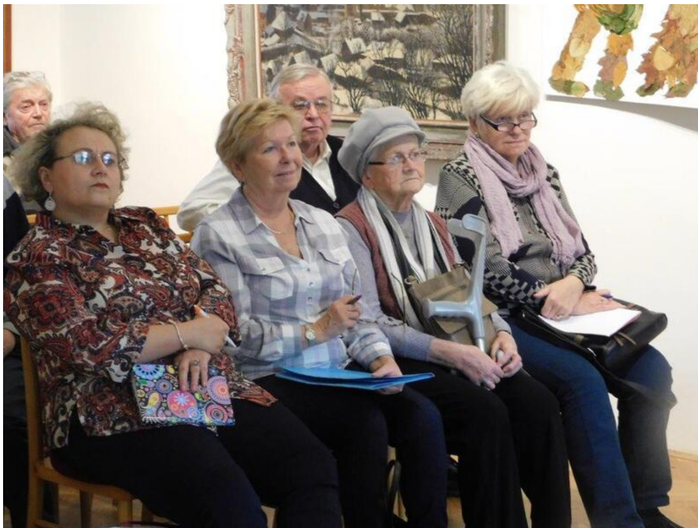
[23] Setkávání - povídání o stromu života