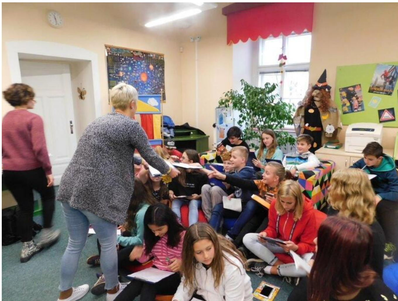
[17] Živá knihovna - co je stereotyp