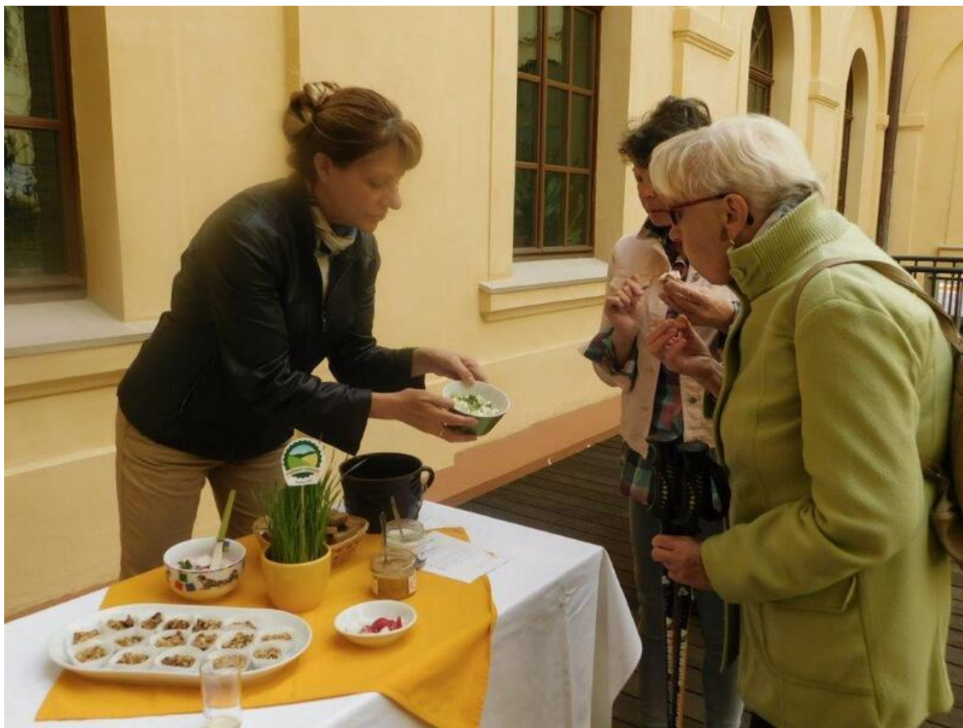
[34] Férová snídaně - domácí pomazánky