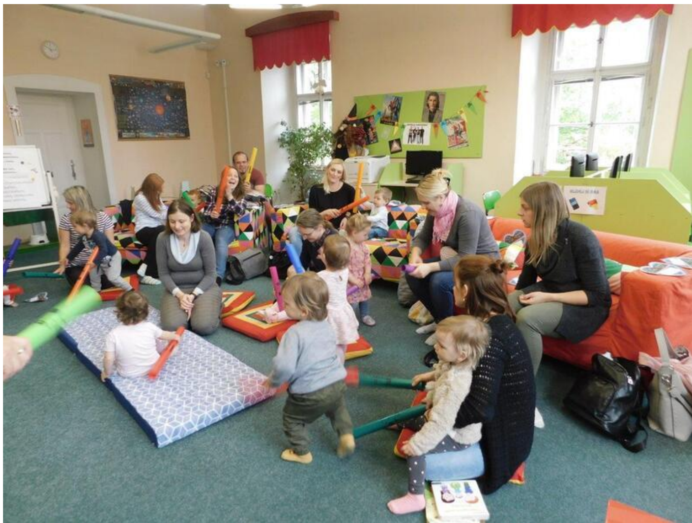
[14] Čítálek – hraní na boomwhackers