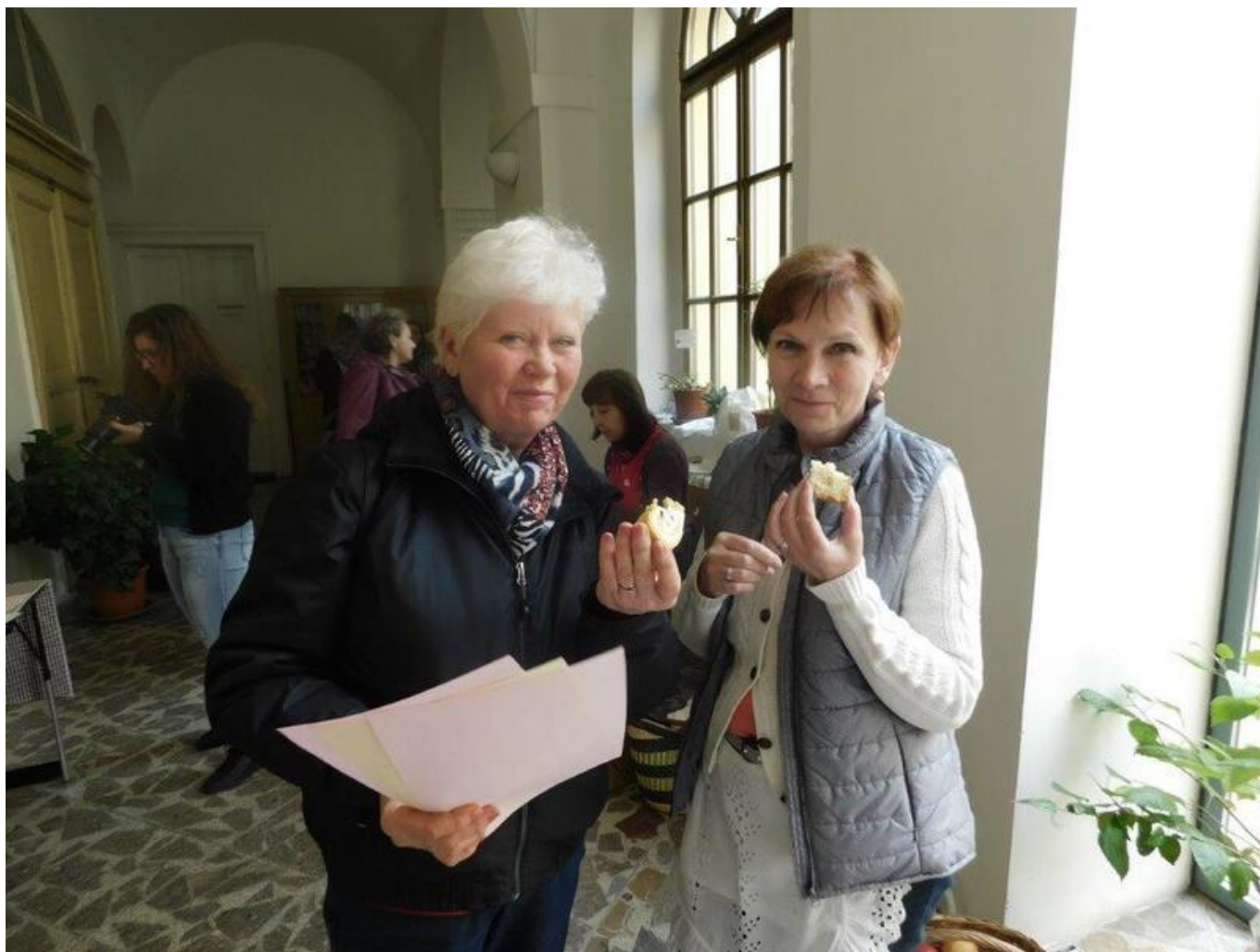
[36] Férová snídaně - předávání receptů