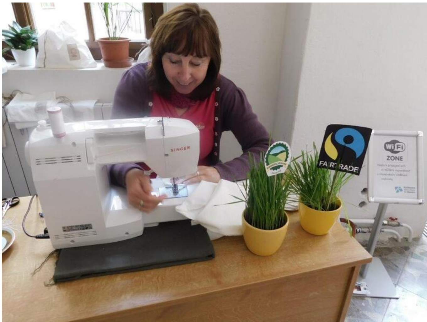
[37] Férová snídaneň - šití sáčků na potraviny