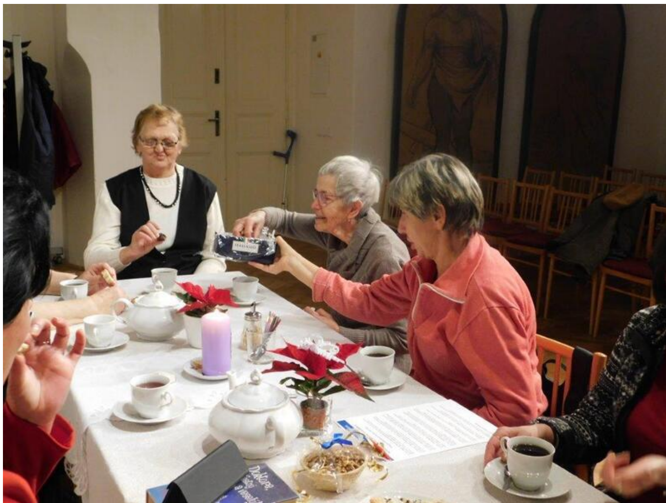
[26] Setkávání - vánoční posezení