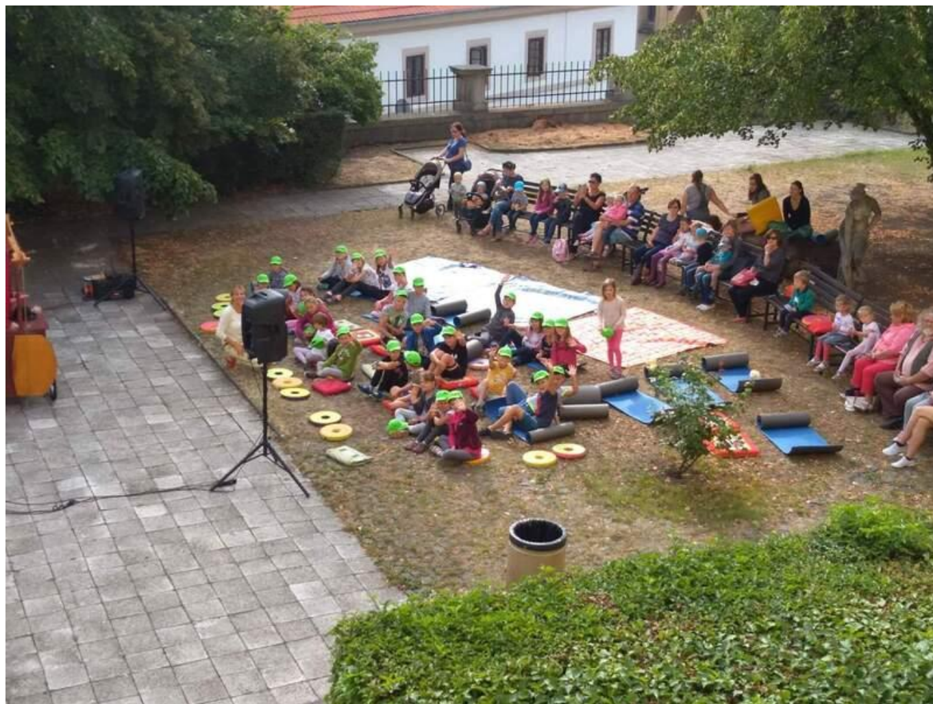
[20] (NE)obyčejné prázdniny – divadlo v zahradě