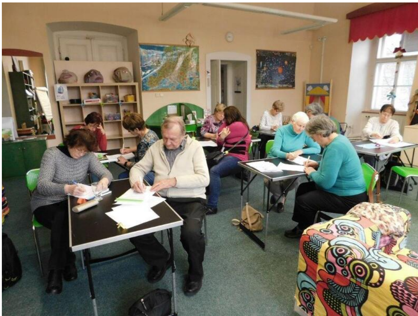
[29] Hrátky s pamětí v plném proudu