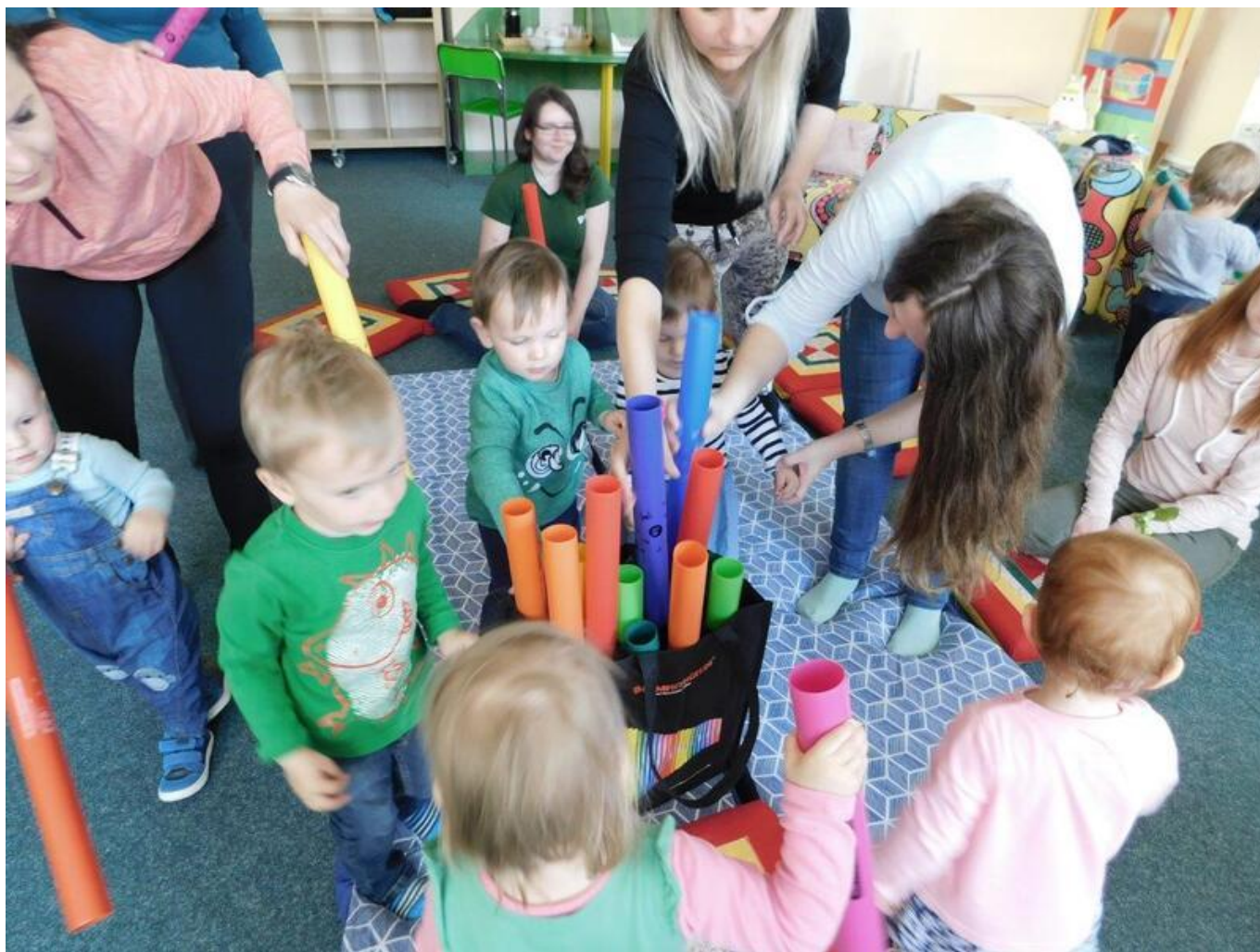
[13] Čítálek - hudební nástroje