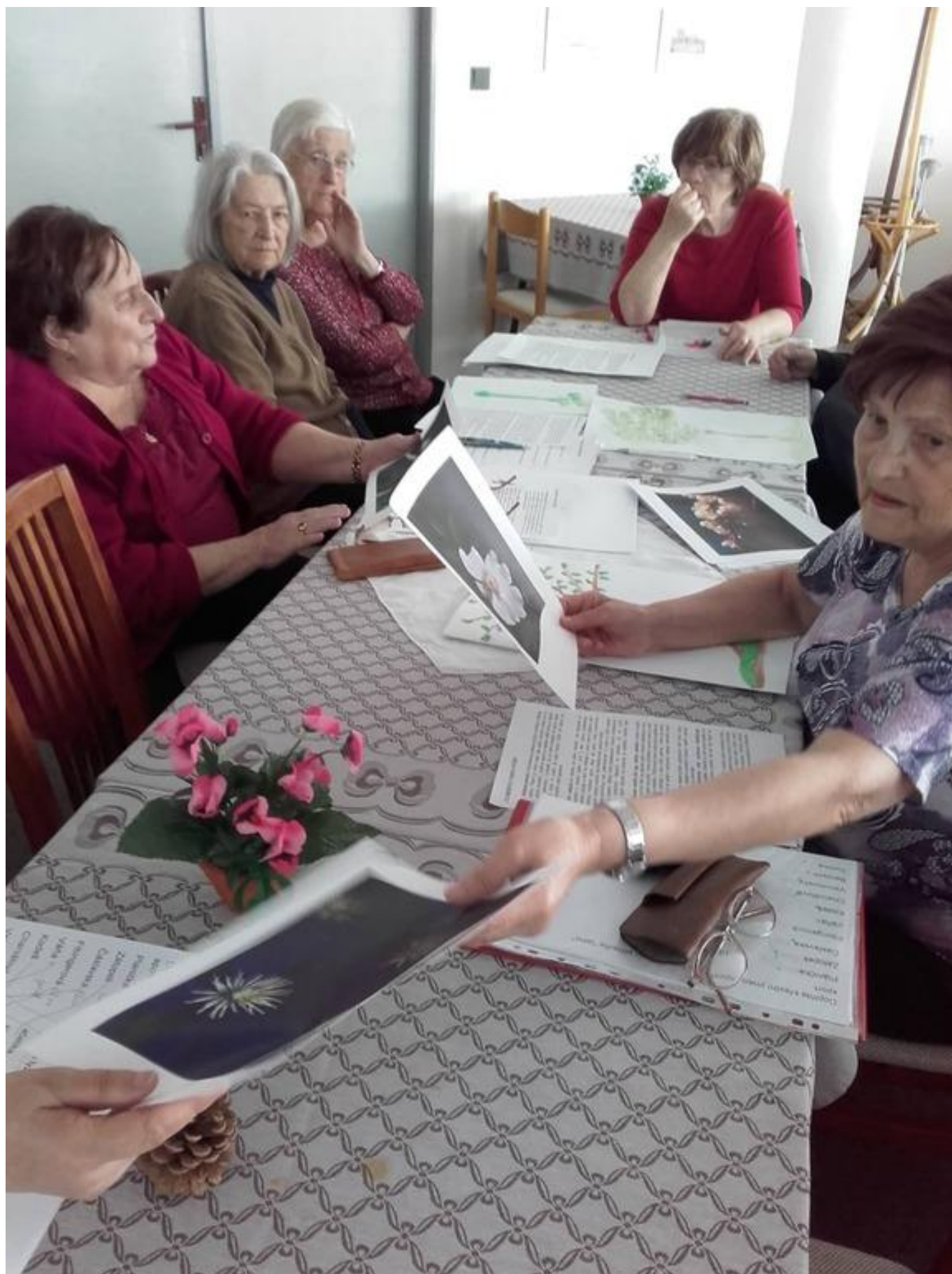
[30] Hrátky s pamětí - kvíz