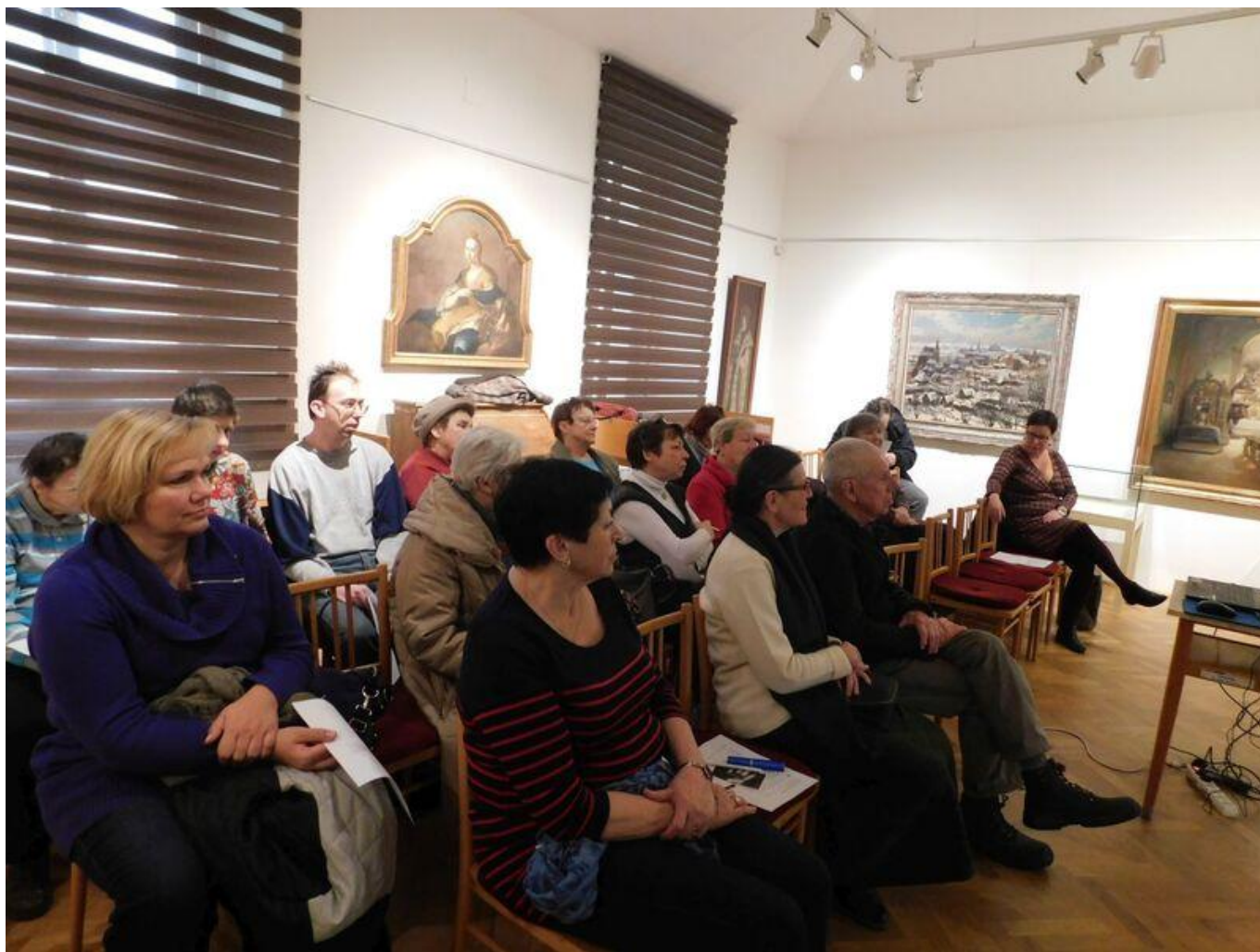
[27] Setkávání - účastníci