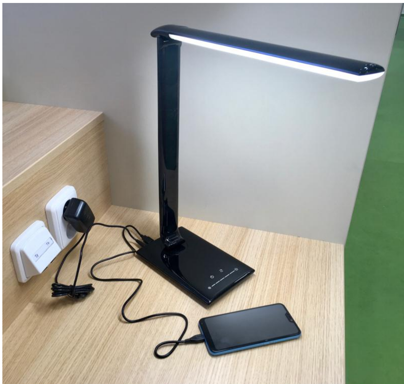
[18] Nabíjení mobilního telefonu pomocí stolní lampy