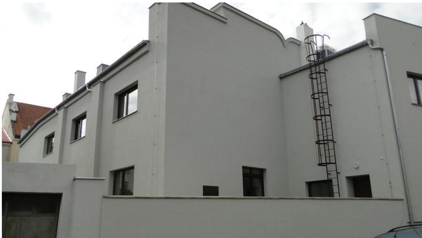
[13] Nová fasáda