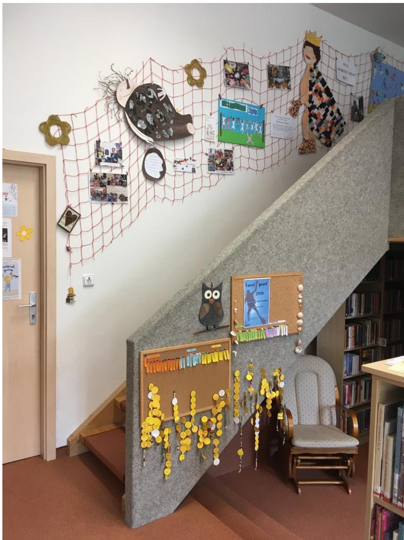
[13] Nyní jsou již doplněny i o koláž z letošního roku (Otesánka)