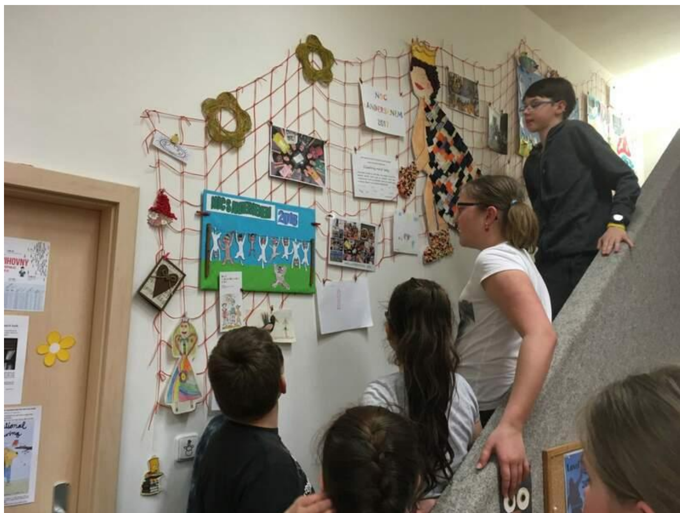
[12] Vystavené koláže z předchozích Nocí s Andersenem