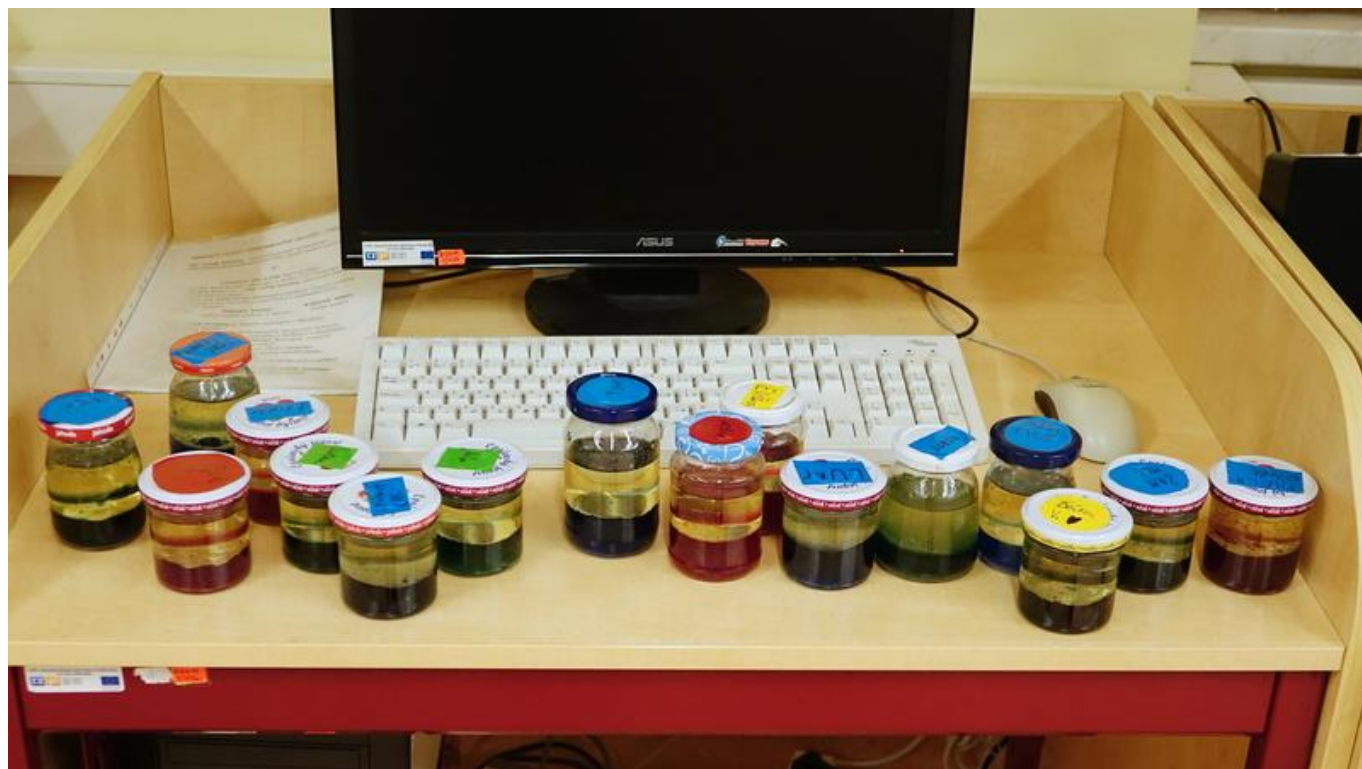
[14] Každý máme svou lávovou lampu