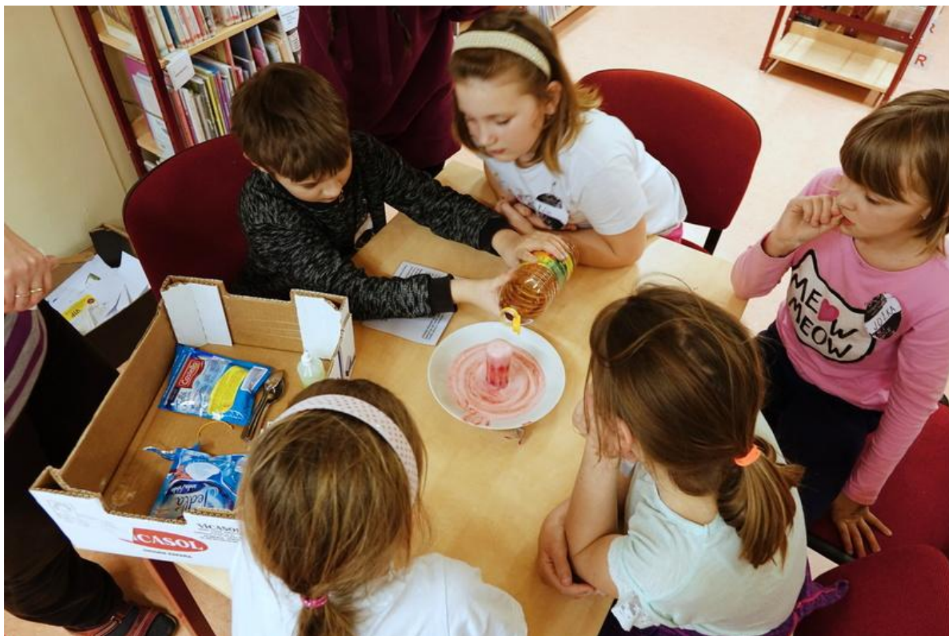
[17] Takhle se dělá sopka

Čas ubíhal strašně rychle a my vyrazili ven po šipkách, plnili úkoly a čekali, kam nás šipky dovedou. Dorazili jsme do interaktivního muzea Pod čepicí, kde nám paní lektorka připravila další várku tajemných vědců a jejich pokusů.