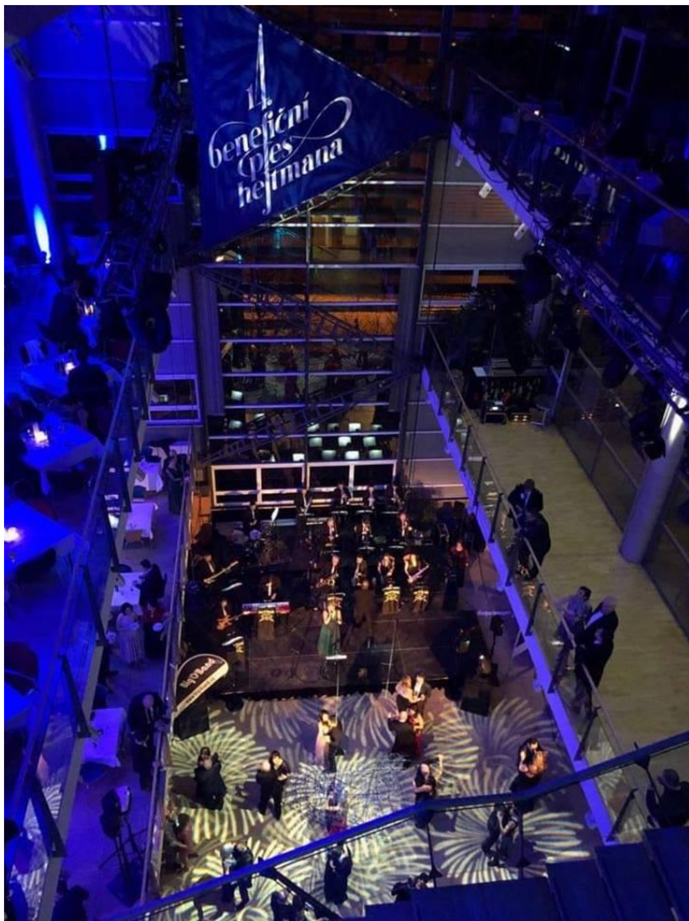
[21] Z plesu hejtmana v roce 2019