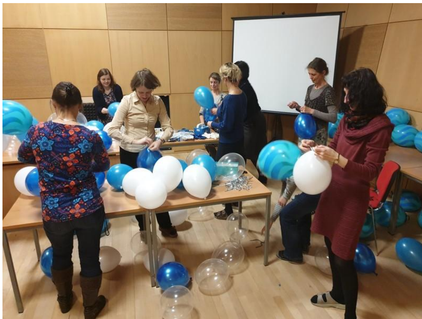
[9] Přípravy - nafukování balónek