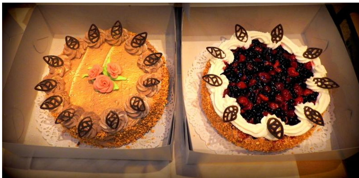
[16] Dorty do tomboly