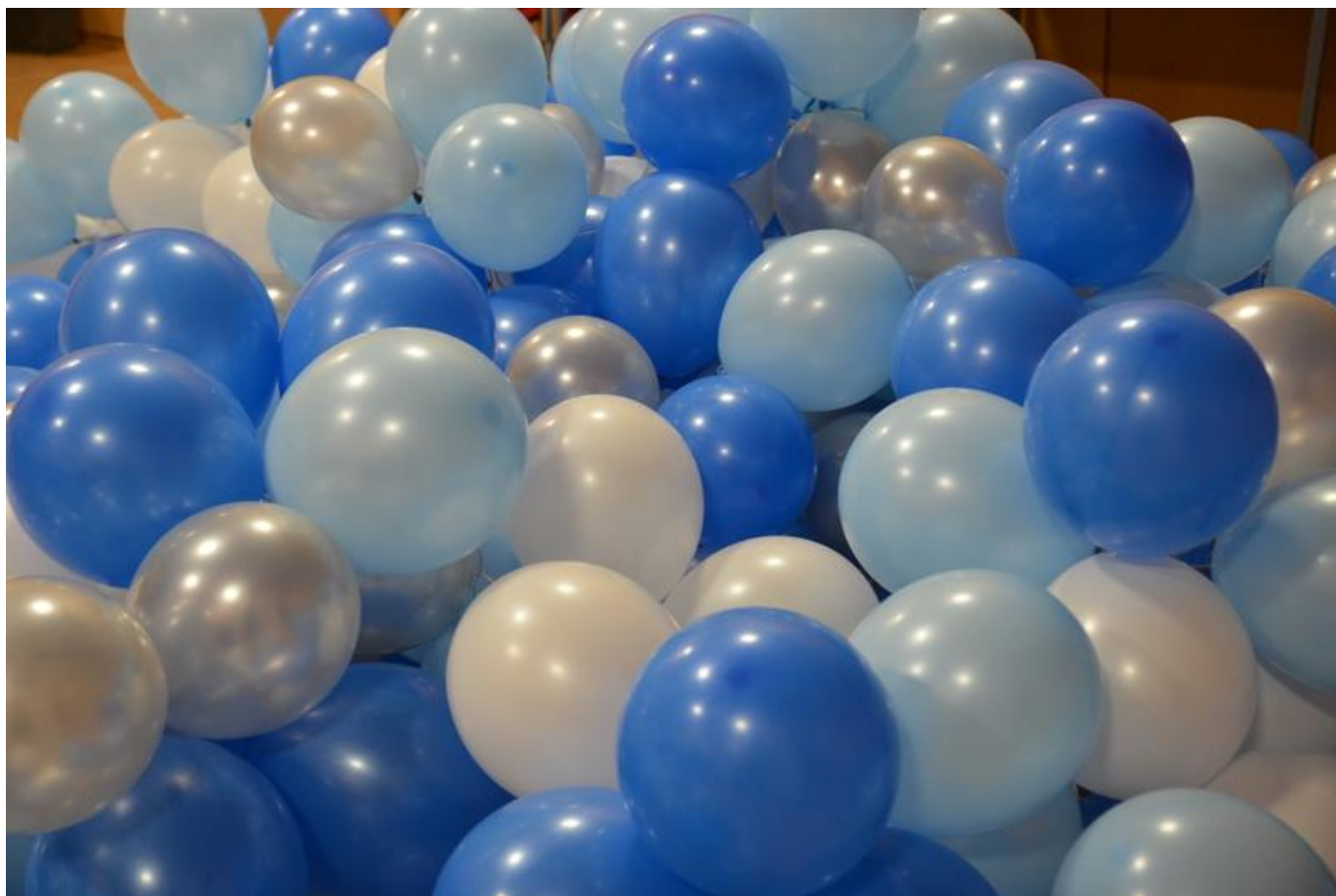
[10] Před instalací