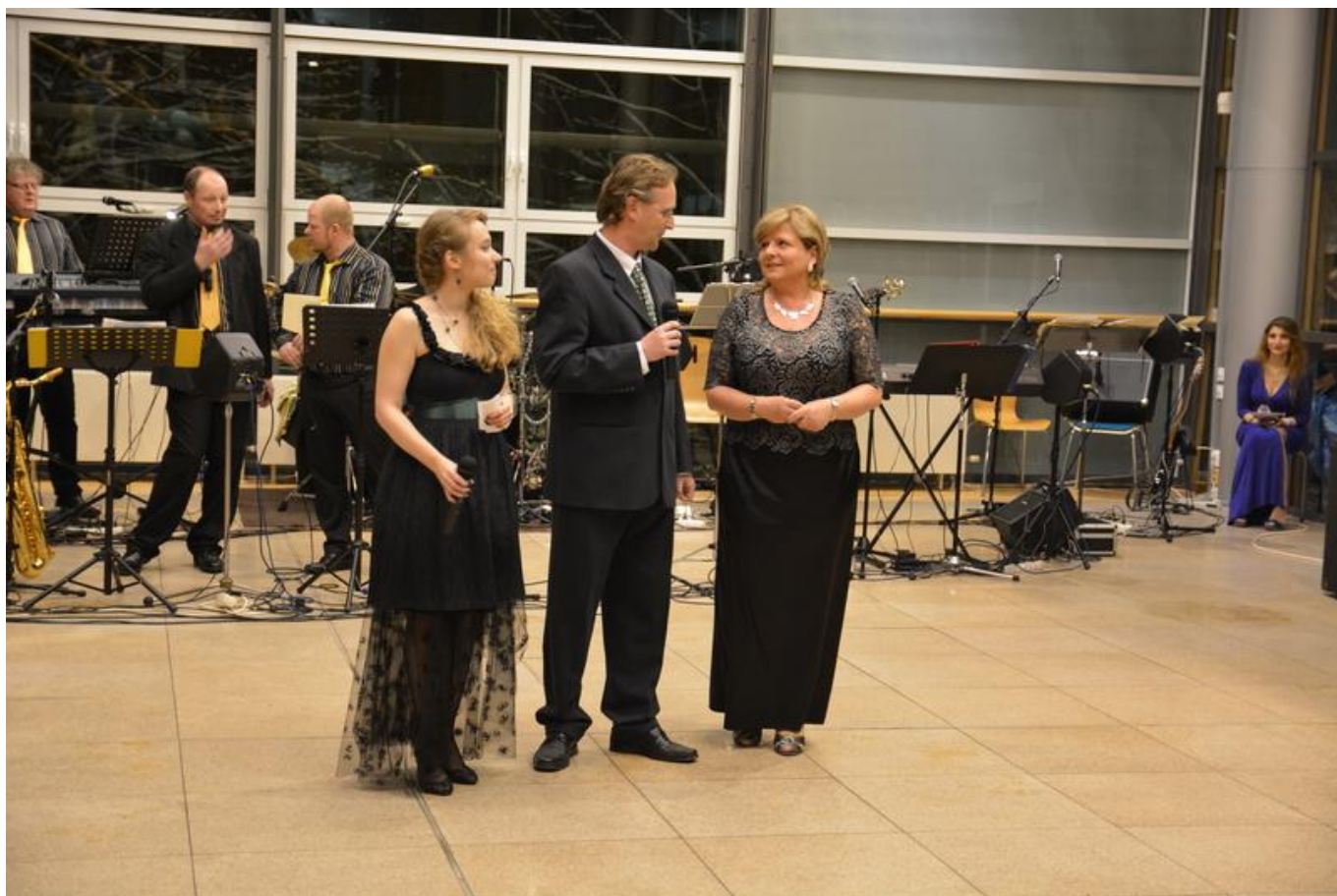
[13] Paní radní zahajuje ples