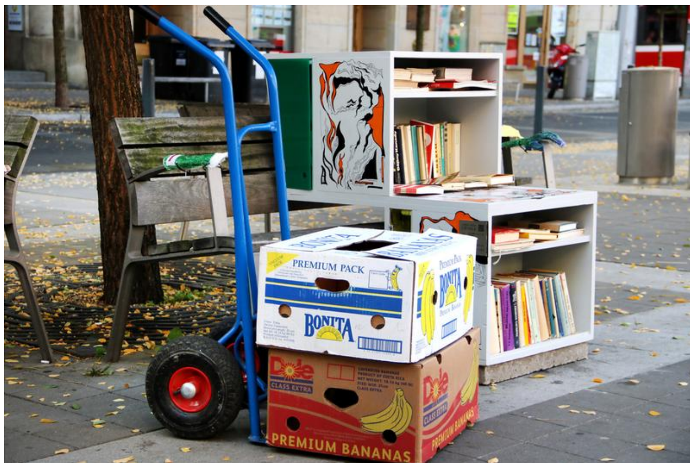
[12] Jiřinka v novém

Další změnou, kterou realizace v průběhu oněch necelých tří let přinesla, je podoba knihovniček. Jednotlivé regály byly před rozmarnou počasí chráněny dvířky z plexiskla. Ta se však nějakým záhadným způsobem často rozbíjela, a tak – protože jsme neměli prostředky na doporučený typ plexiskla užívaný na hokejových stadionech – jsme se rozhodli vydat jinou cestou. Korpus laviček jsme nabídli dalšímu brněnskému studiu, tentokrát výtvarníkům z ateliéru Malujeme jinak [11] (ateliér se specializuje na velké nástěnné malby v interiéru i exteriéru, ale také grafiku a ilustrace), a dali jim poměrně volnou ruku s jednoduchým zadáním vytvořit z laviček výtvarné dílo. Předpokládali jsme, že lavičky s unikátní malbou budou vandalům odolávat lépe, a jsme rádi, že se tento předpoklad potvrdil. Za necelý rok existence laviček ilustrovaných graffiti stylem jsme nezaznamenali jediný šrám na kráse.