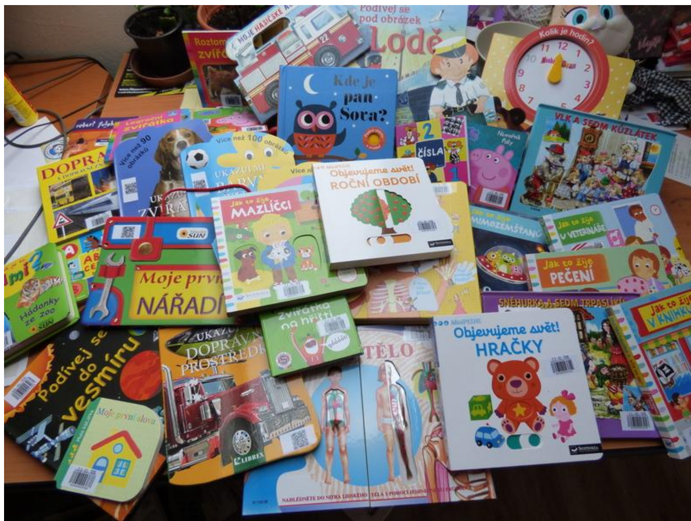
[23] Klub (nejen) maminek

Velmi úspěšný byl projekt Bali všemi smysly. Ten ocenili návštěvníci všech věkových kategorií. Seznámili se s kulturou, historií, tradicemi, výtvarným uměním i tancem tohoto ostrova. Slavnostní vernisáže se zúčastnil indonéský velvyslanec s delegací. Pro nejmenší byla připravená akční, hodně hlasitá pohádka s tradičními balijskými loutkami a tancem s vlastnoručně vyrobenými vějíři.