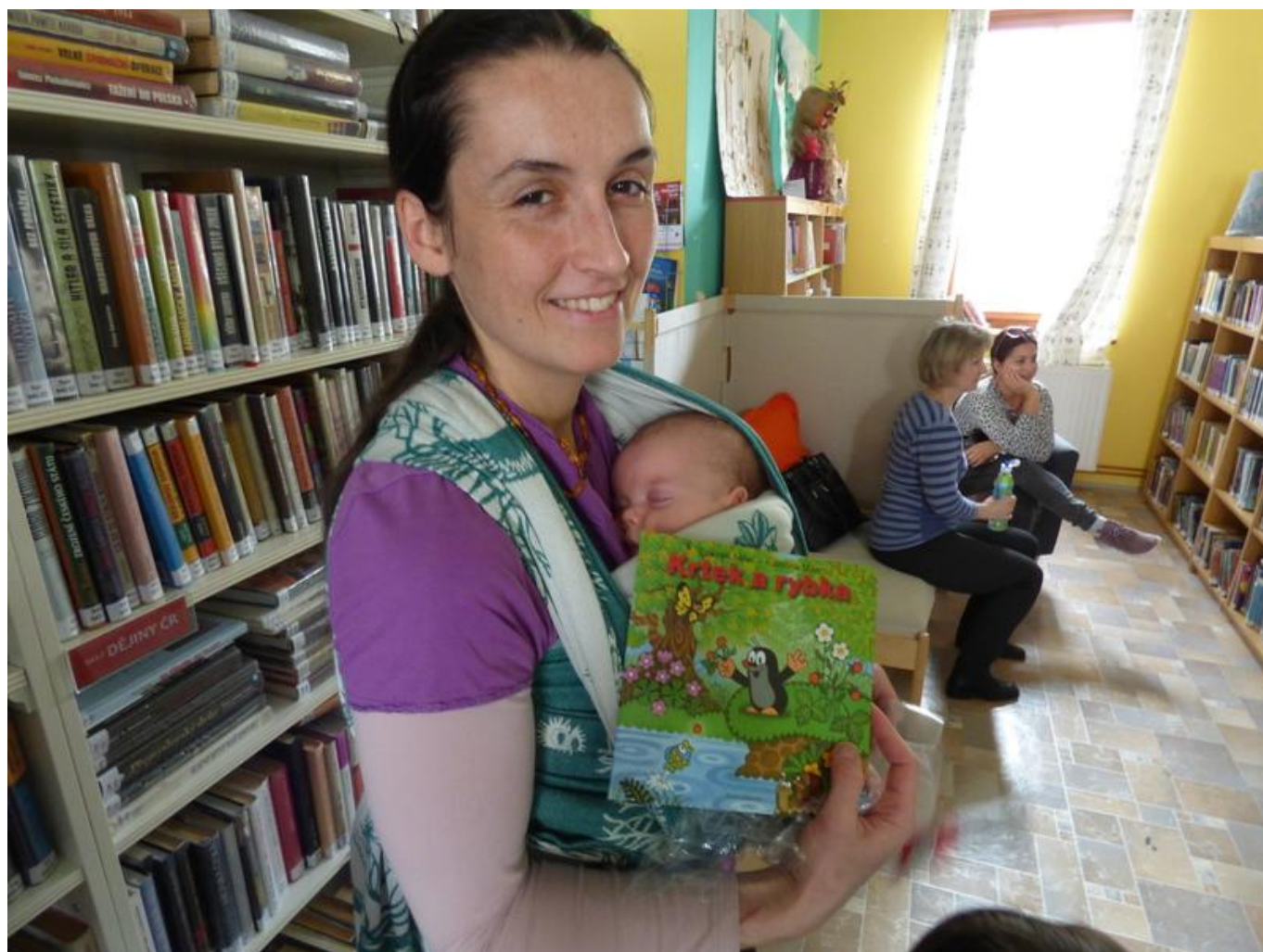
[15] Předávání dárků nejmenšímu čtenáři