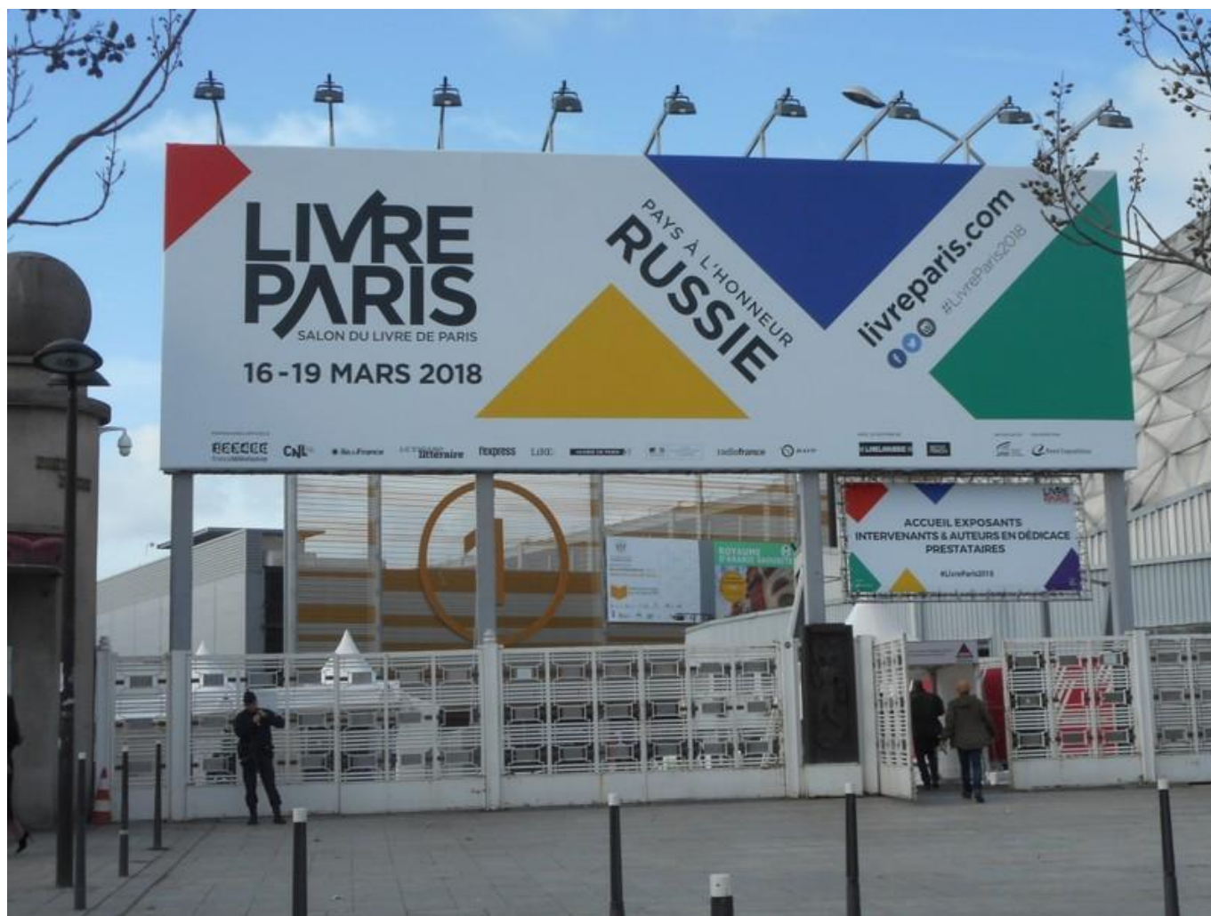
[11] Vstup do areálu výstaviště