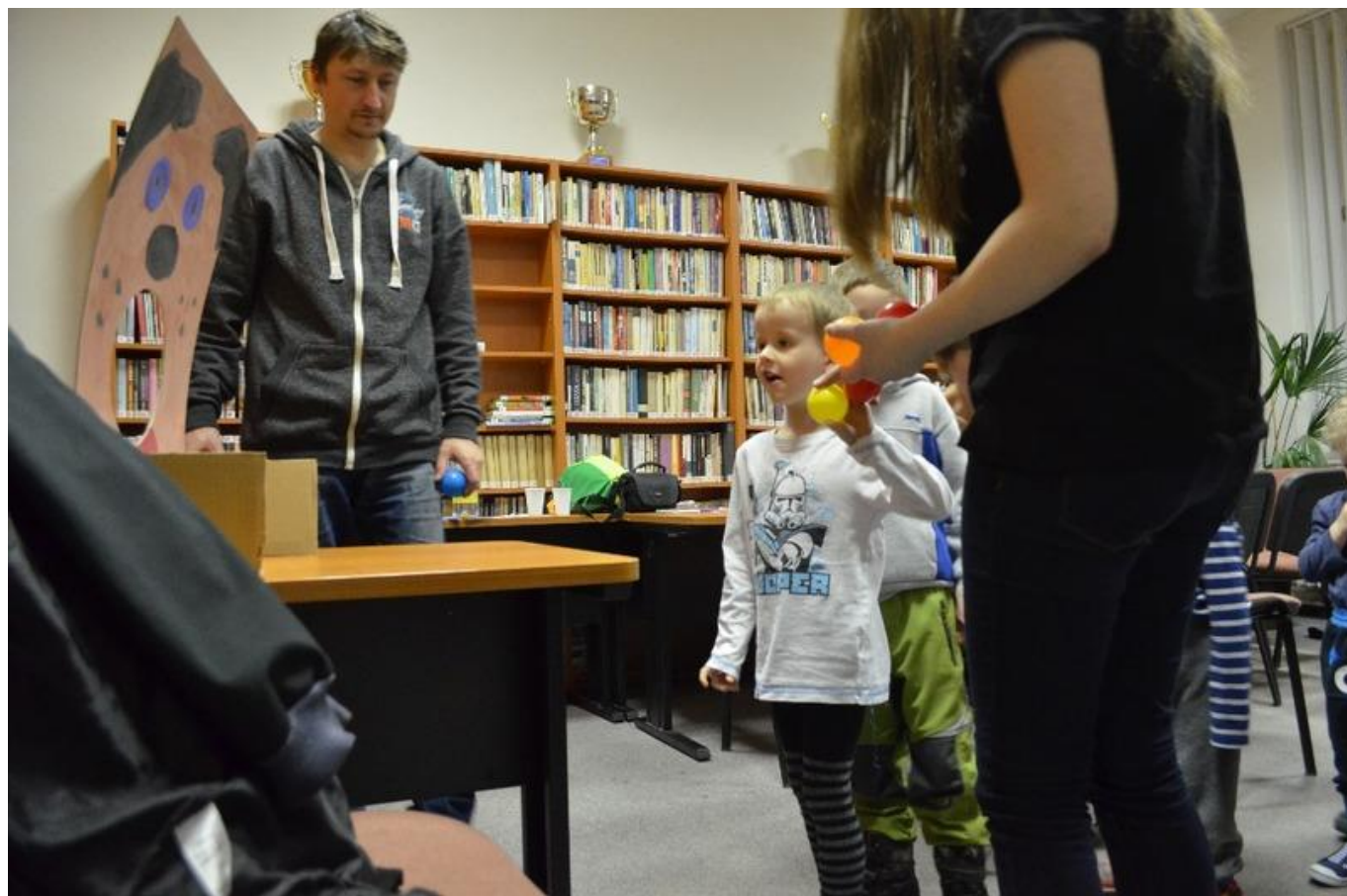
[19] Krmení hladového psa

Další hra, která měla úspěch, se nazývá punčochový úder. Soutěžící si na hlavu natáhli punčocháče. V jedné z nohavic byl schovaný balónek. Rozhoupáním nohavice s balónkem se srážely ruličky a lahve, které stály na zemi. Ruce musely zůstat schované za zády.