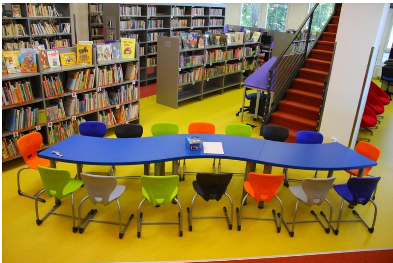
[14] Dětský koutek