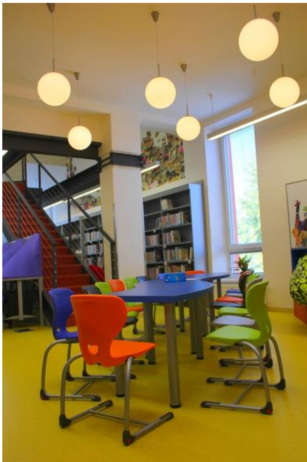
Dětský koutek se schodištěm do patra