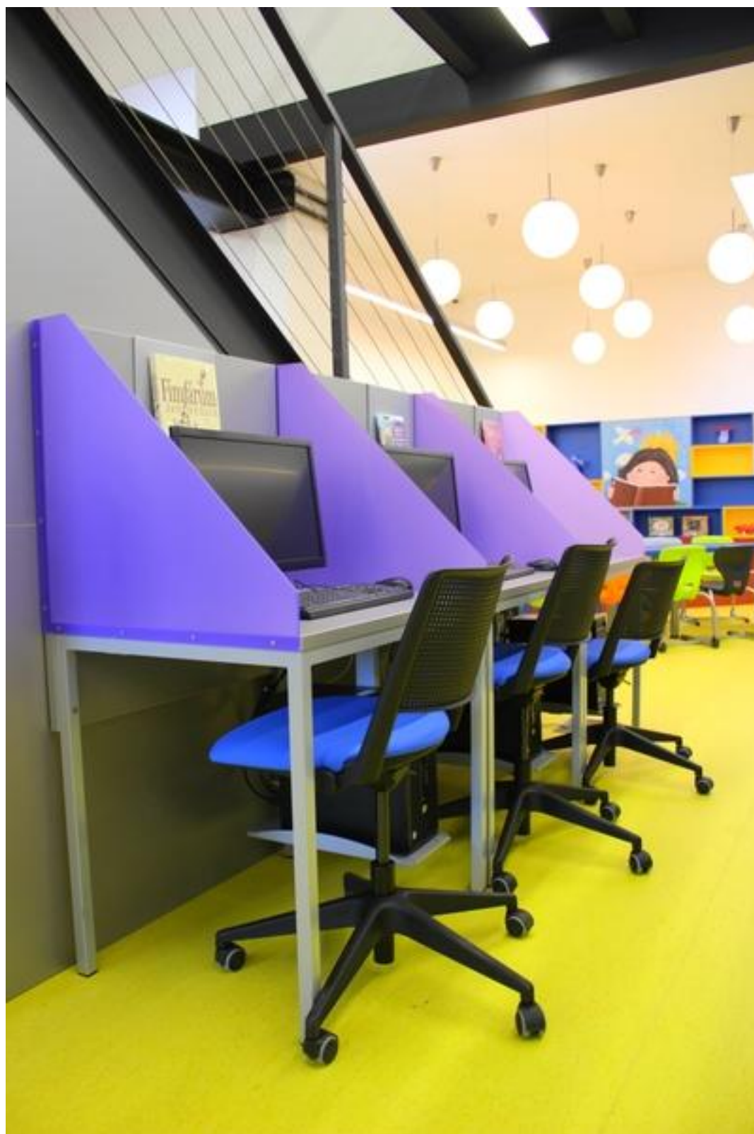
Jeden ze dvou počítačových koutků