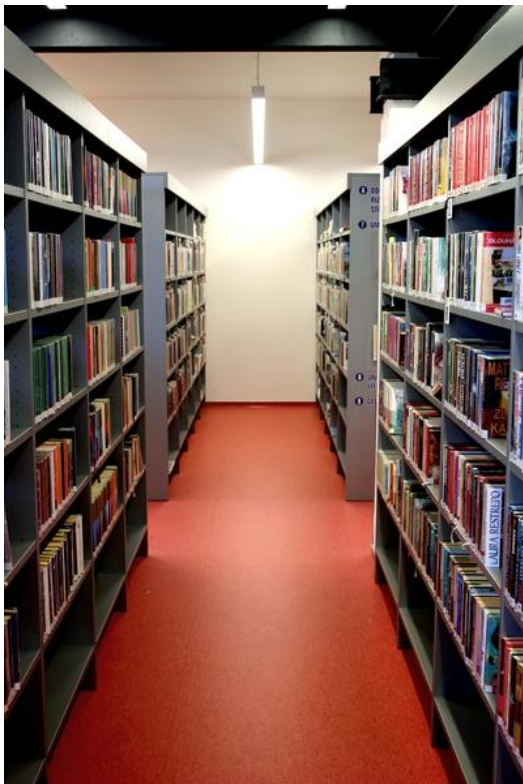
Regály s beletrií a naučnou literaturou pro dospělé