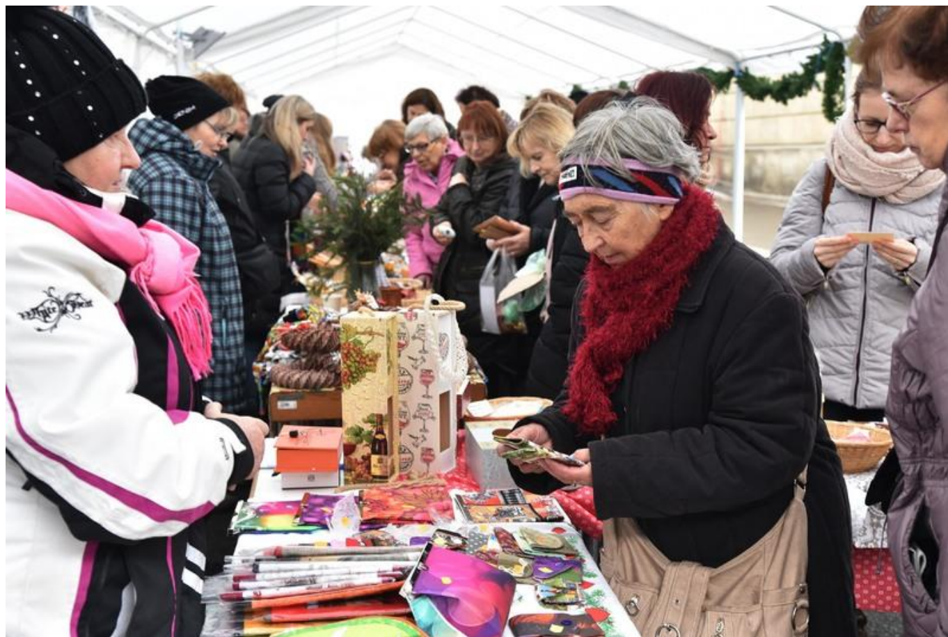
[9] O výrobky knihovnic byl velký zájem – celkový pohled na prodejní stan

Vánoční atmosféru si přišlo užít poměrně dost skalních příznivců hlavně z řad zaměstnanců knihoven i z řad knihovnické veřejnosti. Přidali se noví nakupující, náhodně procházející turisté a jarmark si nenechali ujít ani lidé z řad zájemců o prohlídku rekonstruovaných prostor Klementina.