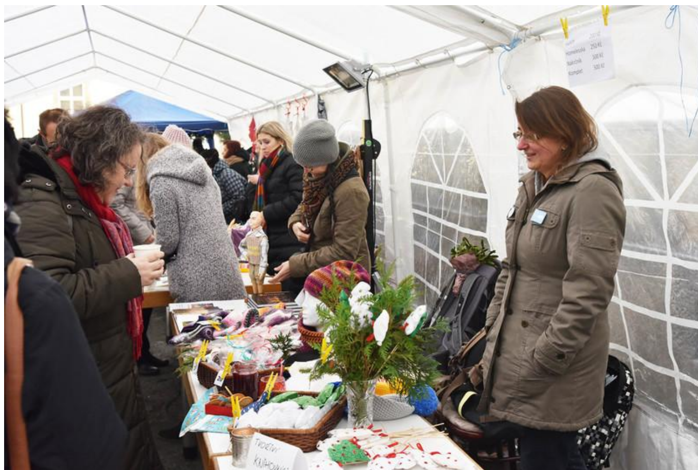
[12] Pletené a háčkové výrobky, v pozadí nabízená fotokniha