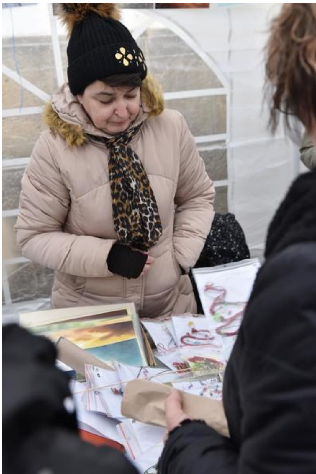
Obrázky a šperky