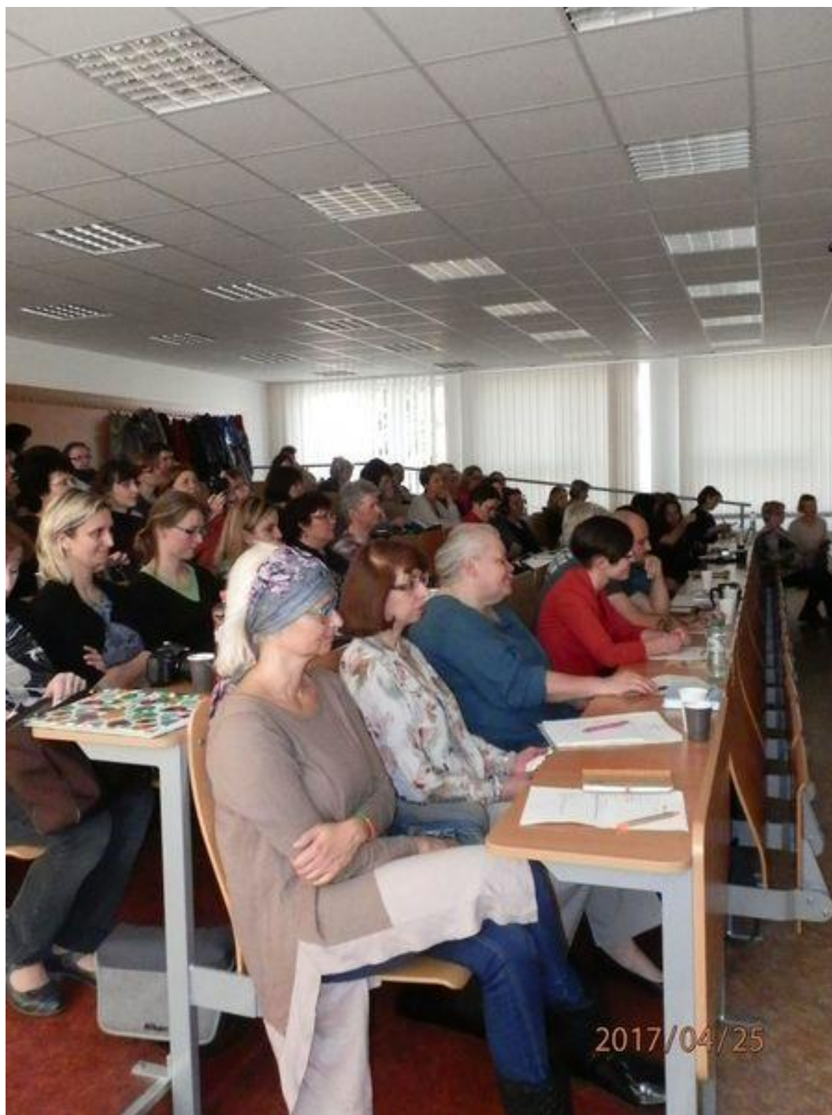
Přehlídka OKnA v roce 2017 - zahájení