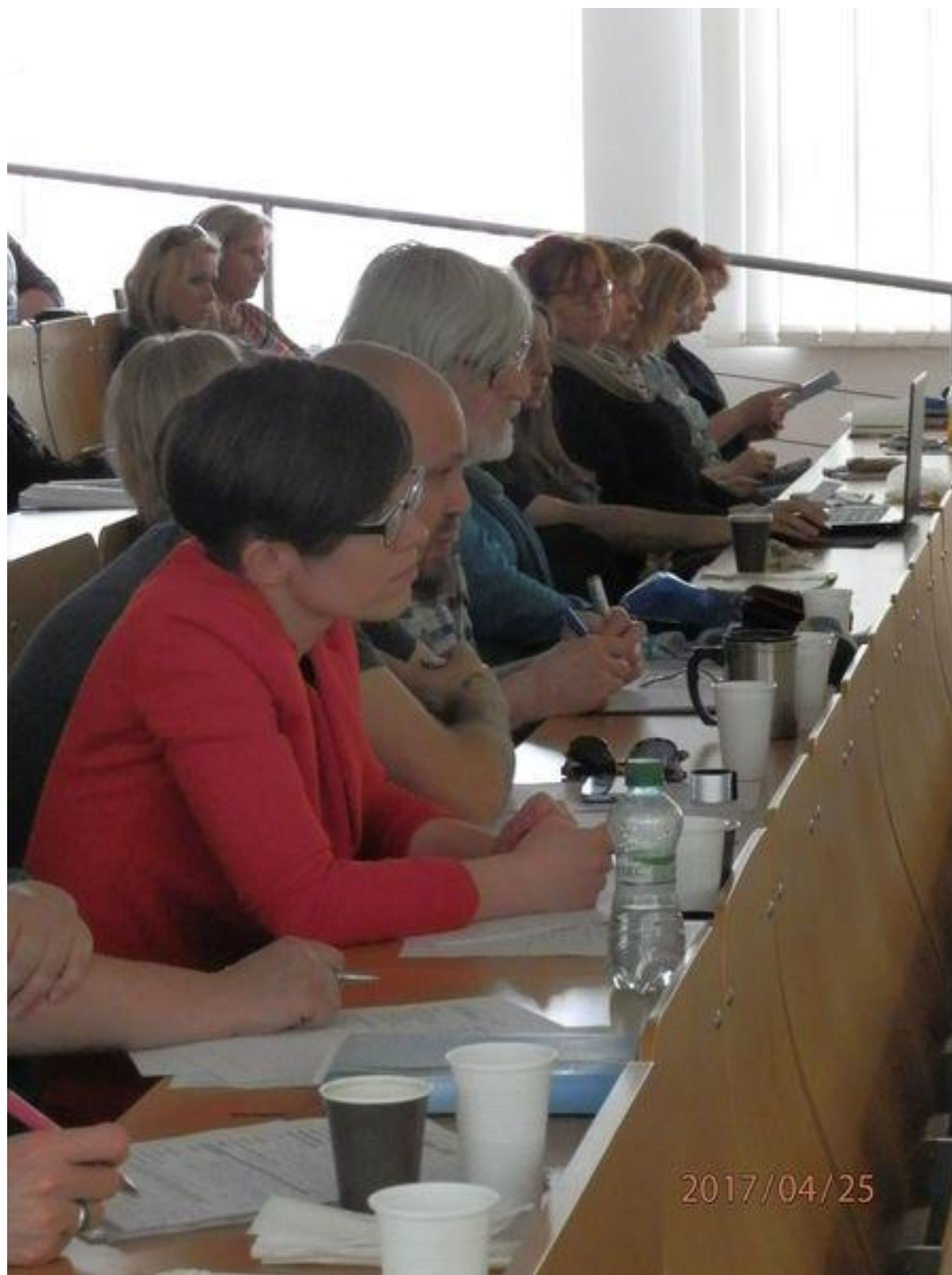
Přehlídka OKnA v roce 2017 - porota