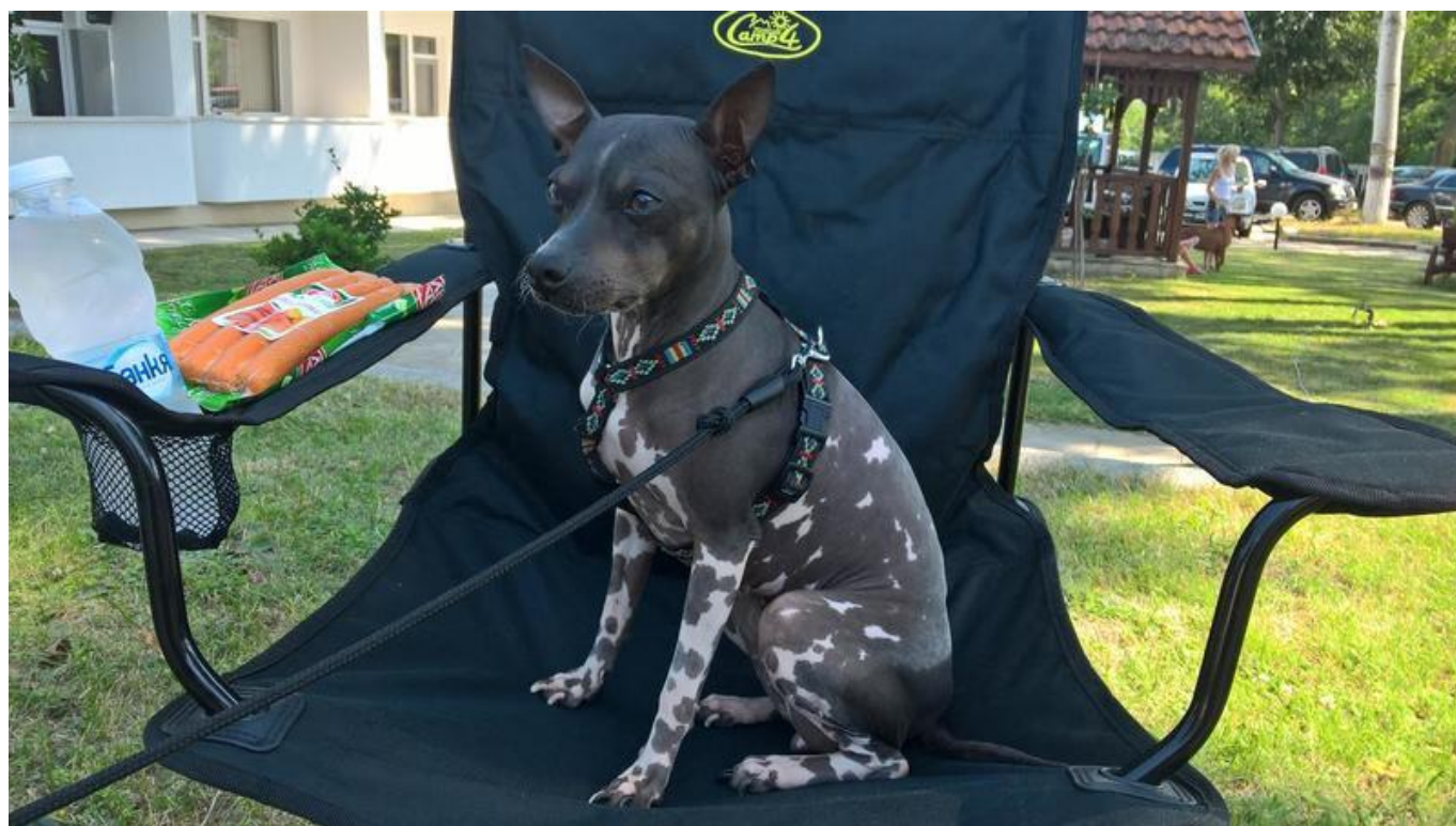
[14] Fenka Bára na dovolené v Bulharsku