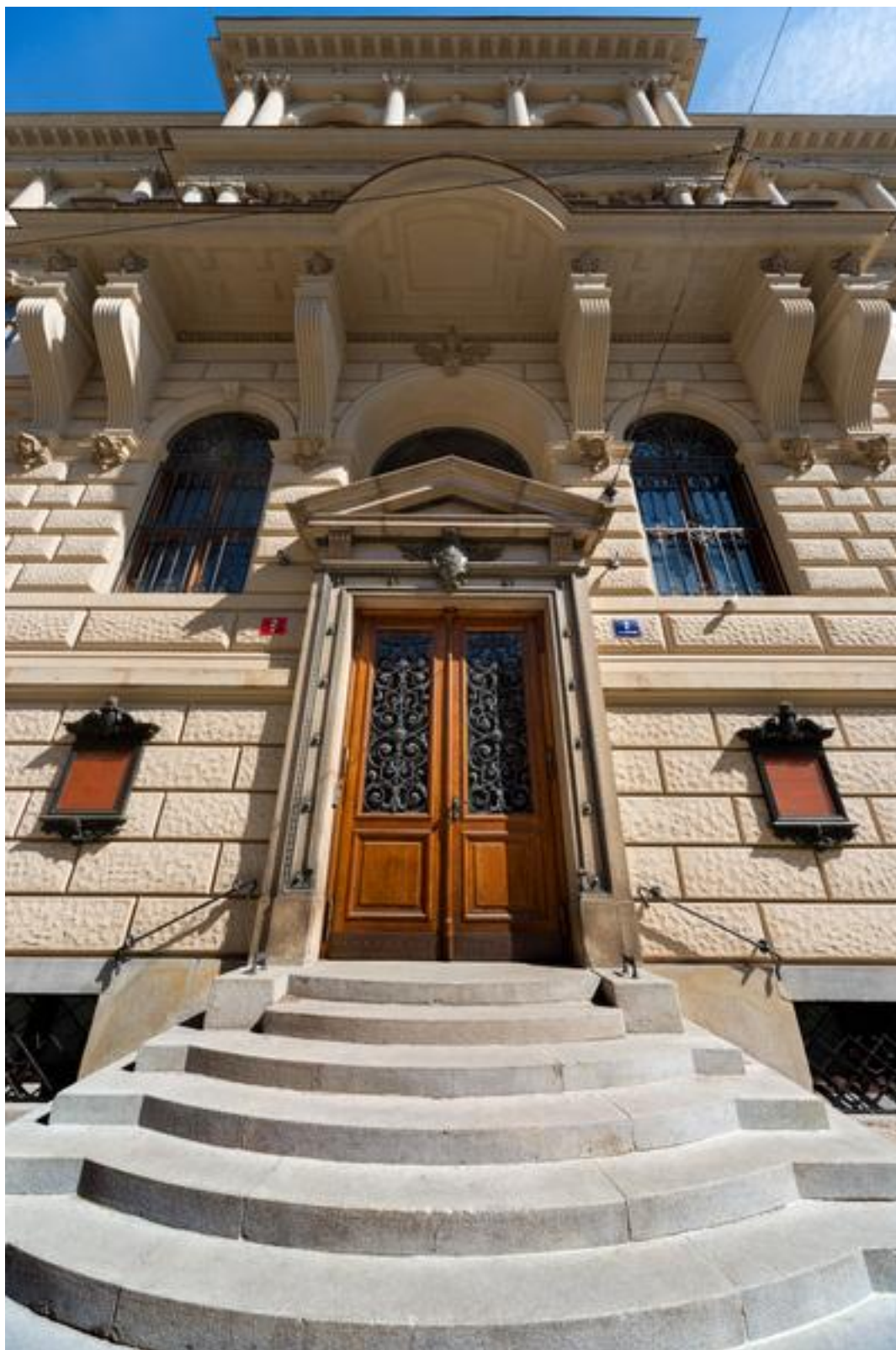
Historický vchod do budovy