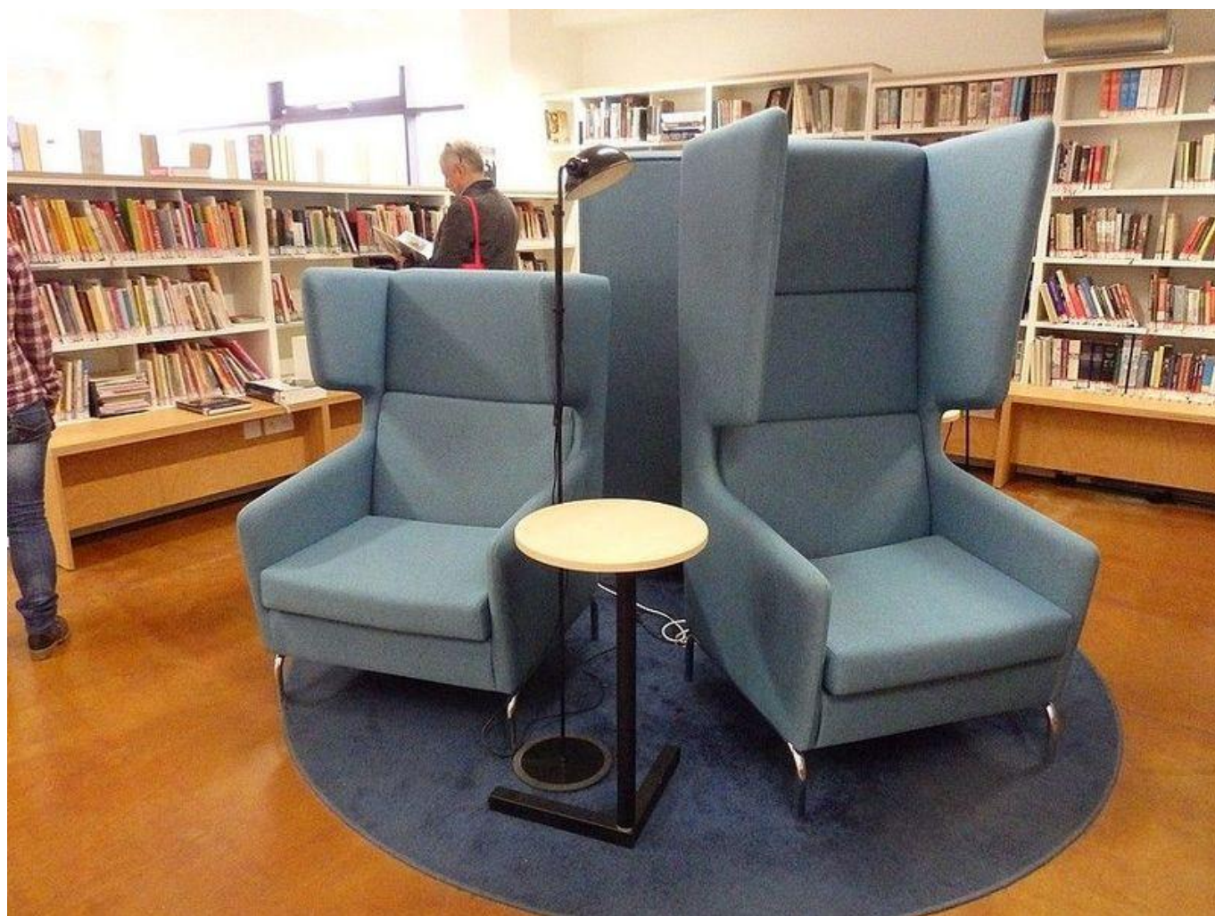
[18] Městská knihovna v Praze, pobočka Vozovna