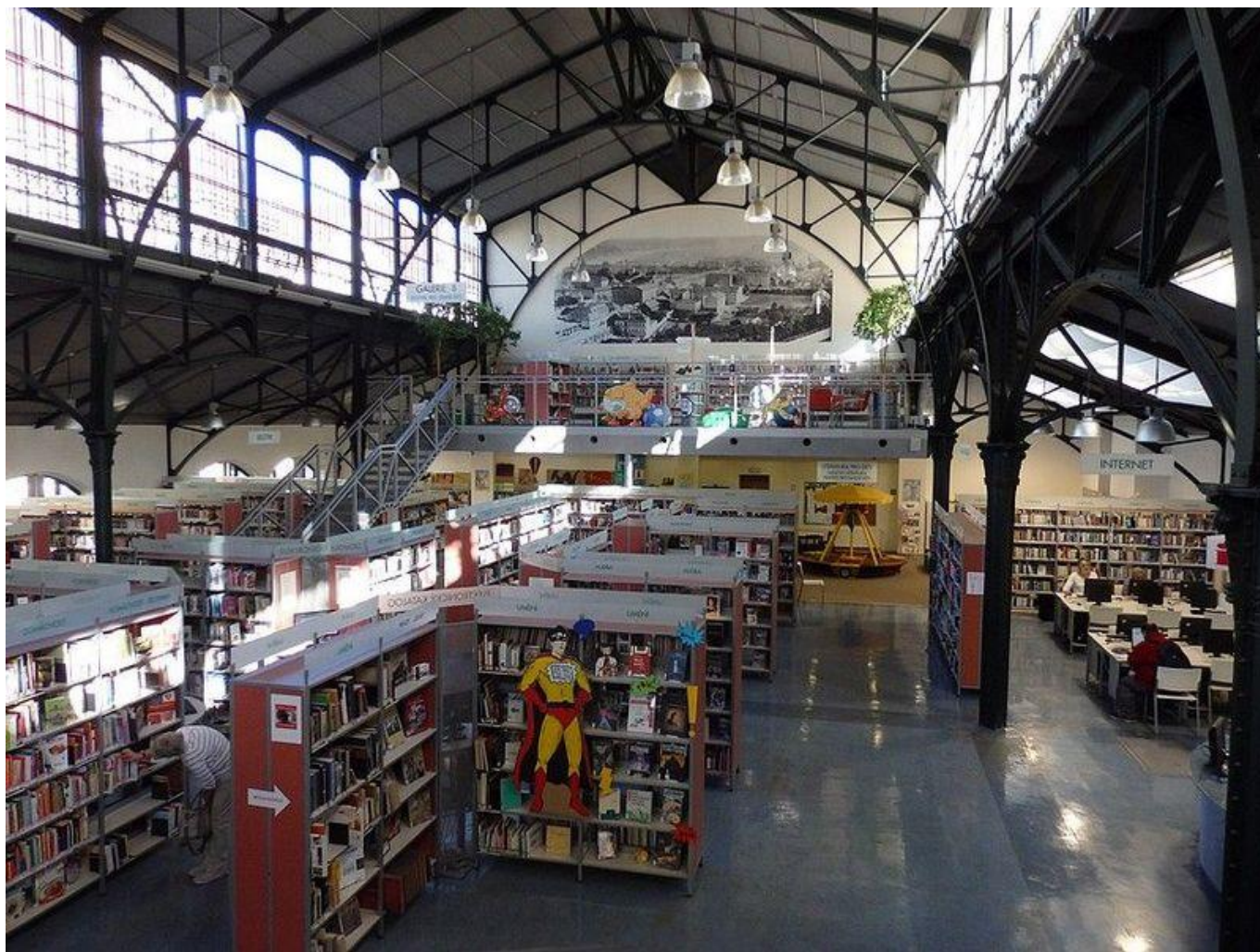
[20] Městská knihovna v Praze, pobočka Smíchov