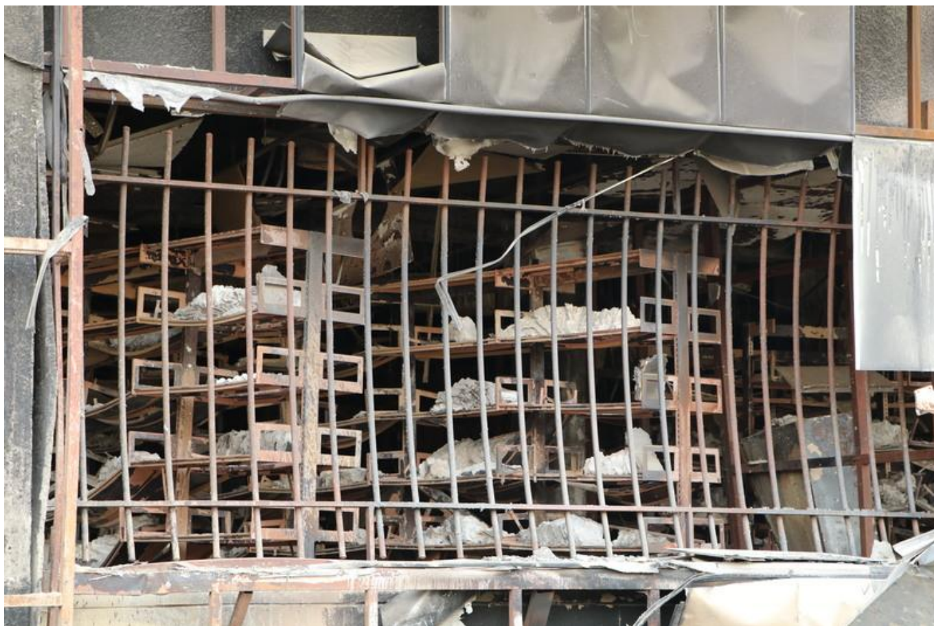
[15] Trosky původního vybavení