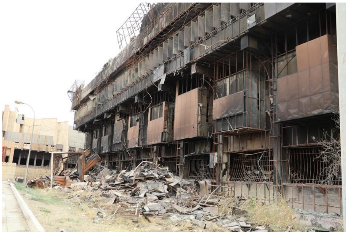
[13] Poškozená budova knihovny