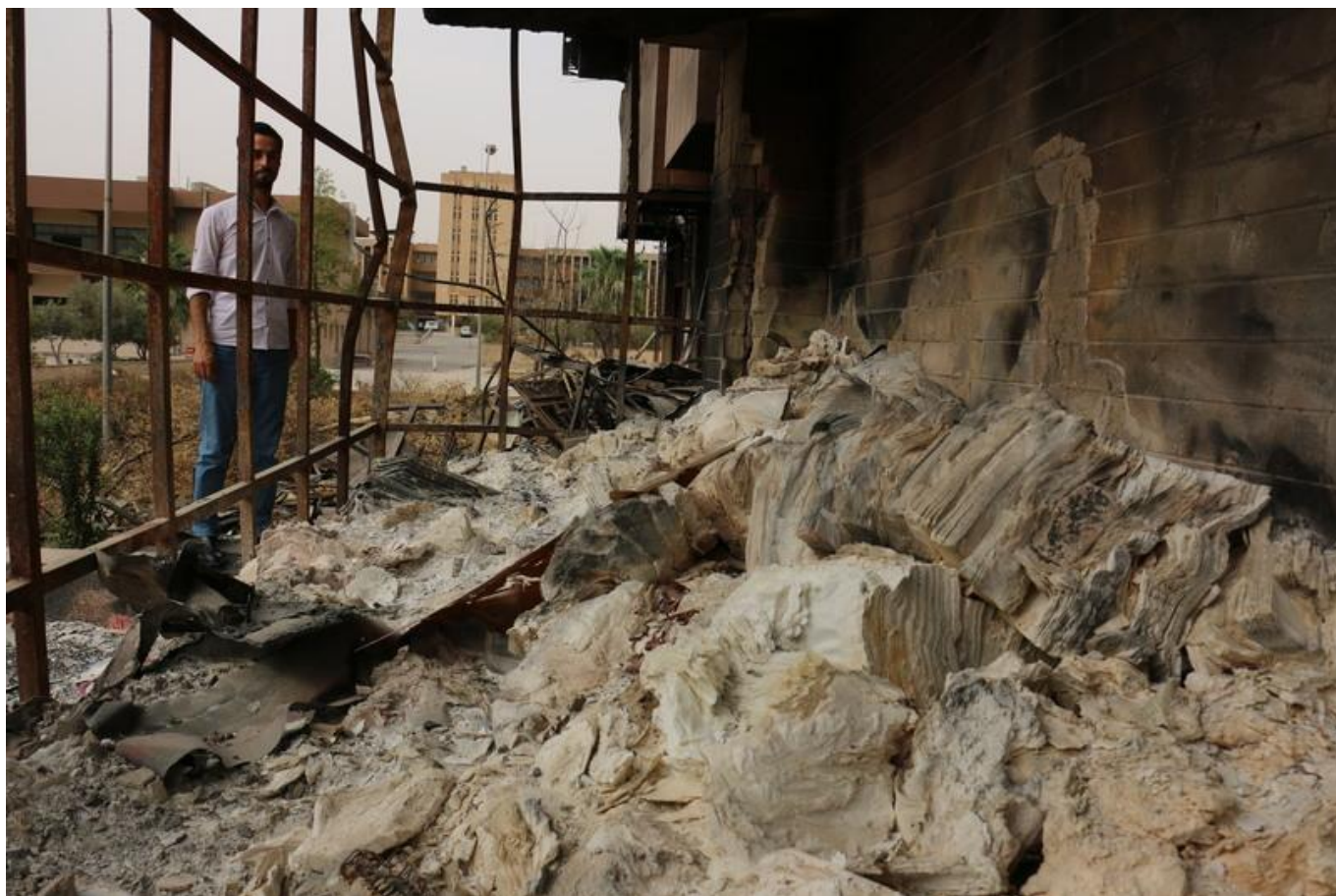
[14] Smutný pohled na poškozený fond