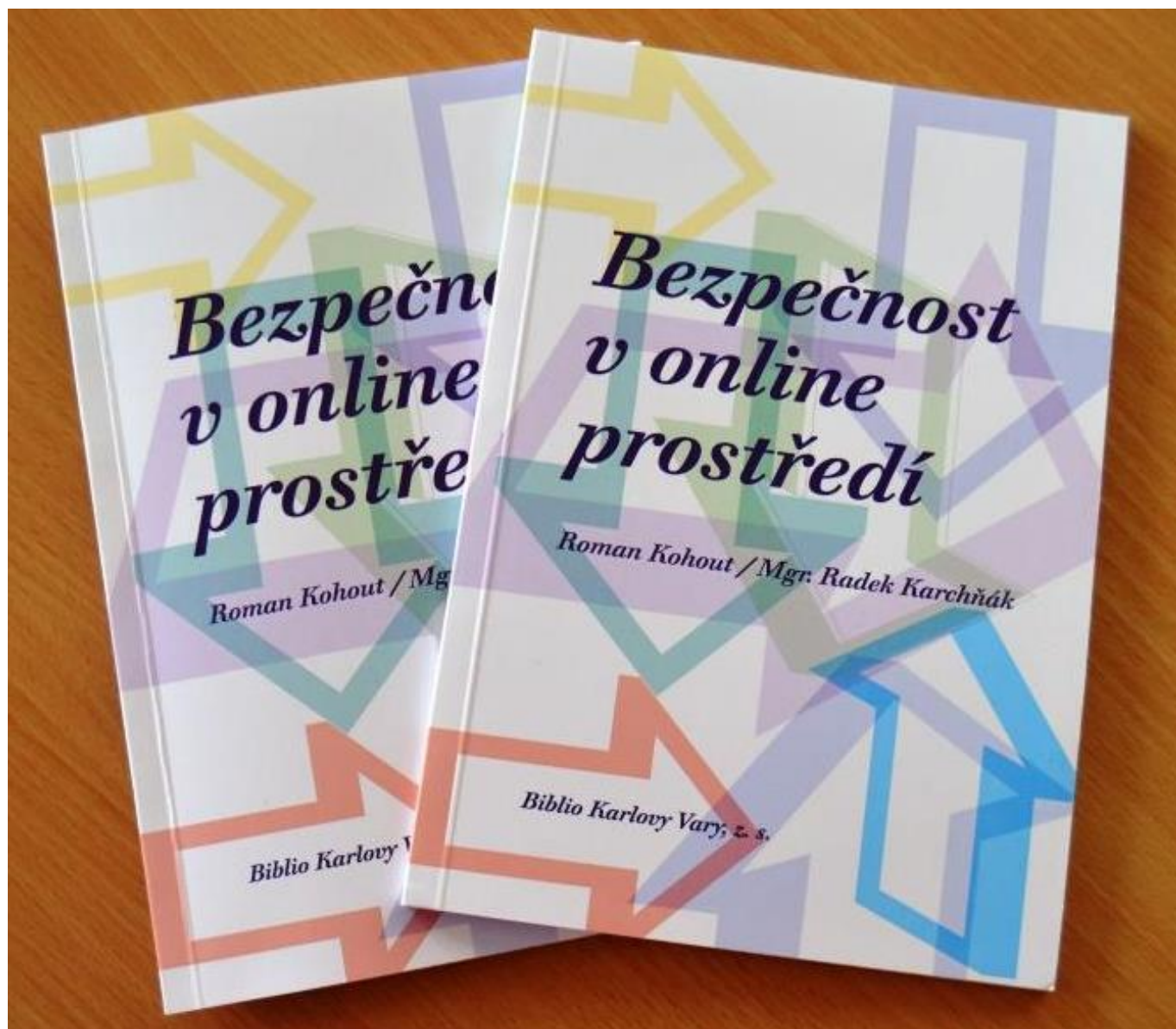
[12] Publikace Bezpečnost v online prostředí