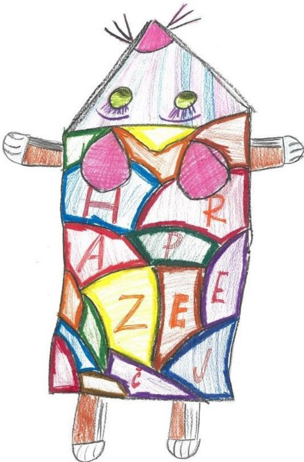
[13] Adéla Černá, 8 let