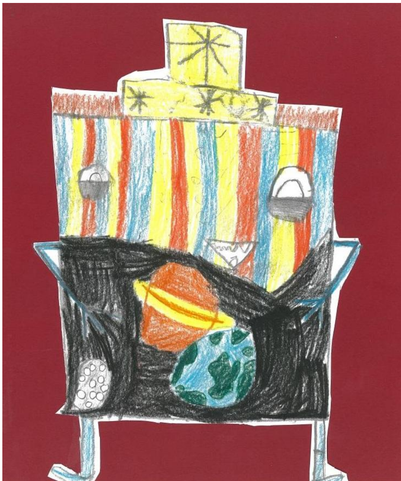
[14] Daria Meruňková, 6 let