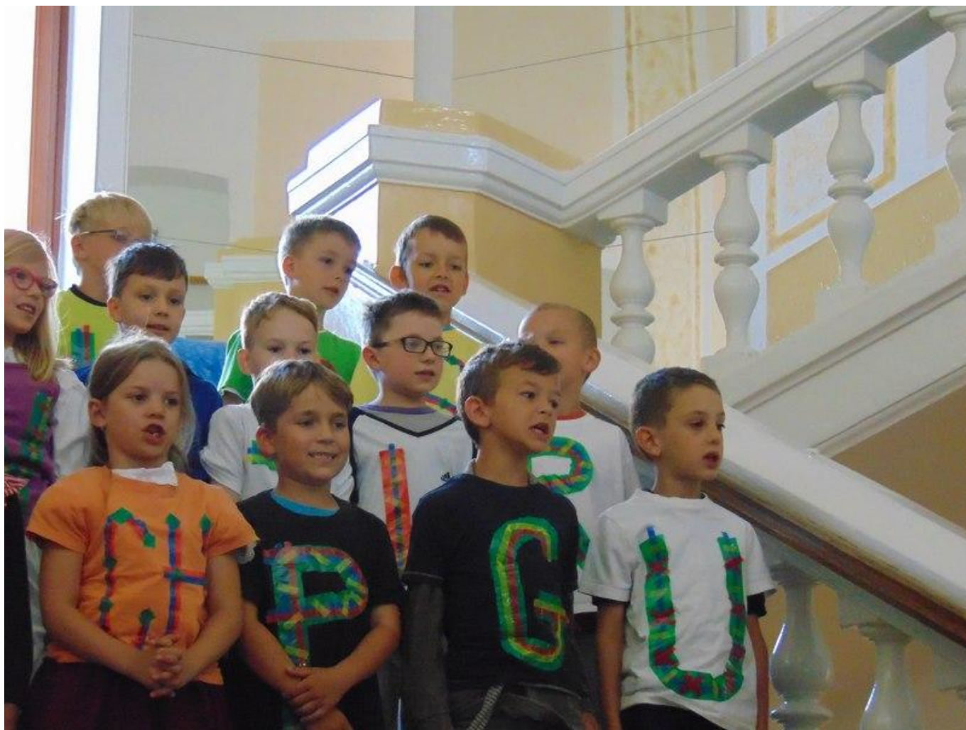
[13] Letošní lomničtí rytíři